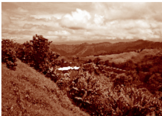
Vista panorámica de las montañas desde la comunidad. Cuauhtémoc, La Trinitaria, Chiapas. Fotógrafo: Fernando Limón Aguirre, 2005. Acervo personal.