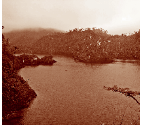
Aspectos de las condiciones climatológicas en la región. Cinco Lagos, Tzisco, La Trinitaria, Chiapas. Fotógrafo: Fernando Limón Aguirre, 2004. Acervo personal.

de clima templado, donde predominan los bosques de coníferas y mixtos de pino, encino y liquidámbar, con algunos reductos de bosques mesófilos. Pero, al igual que en Guatemala, la región se extiende también hacia zonas cálidas, con vegetación selvática (selva mediana perennifolia). Es una región lacustre con gran precipitación pluvial, por la que fluyen ríos y riachuelos, y se advierte una flora y fauna muy variadas, donde destaca una gama sorprendente de orquídeas que caracterizan a la región.