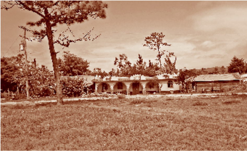
Vivienda chuj construida con remesas. San Lorenzo, La Trinitaria, Chiapas.

to de La Trinitaria. El origen cultural de los grupos más antiguos se reconoce con dificultad; a su vez, a la gente de comunidades nuevas se les llama “asimilados” o “guatemaltecos” sin distinción, en sentido peyorativo y sin reconocer sus diferencias idiomáticas, étnicas, históricas o de cualquier otra índole.