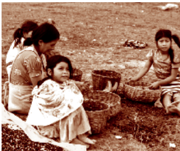
Mujeres y niñas despulpando café. Tzisco, Chiapas. Fotógrafo: Lorenzo Armendáriz García, 1987. Fototeca Nacho López, CDI.