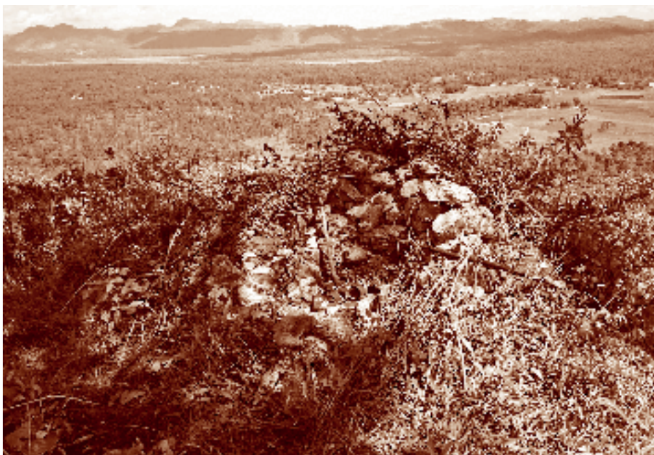
Altar en la cima del cerro Zacatepec, conocido como "Cerro Poderoso". La Trinitaria, Chiapas. Fotógrafo: Fernando Limón Aguirre, 2006.

El territorio también nos ofrece el marco de posibilidad para el despliegue de nuestras potencialidades colectivas en comunidad. Este marco "del ser pueblo" —sobre el que construimos nuestra identidad— es un espacio de relaciones simbólicas y significativas; relaciones entre un nosotros comunitario —con quienes construimos y compartimos una identidad— y los otros. Dicho en palabras sencillas, palabras indígenas, el territorio "es 'onde' pende nuestro pueblo".