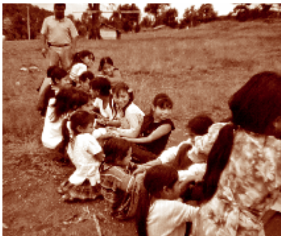
Niñas “escuelantes” jugando. Nuevo Porvenir, La Trinitaria, Chiapas. Fotógrafo: Fernando Limón Aguirre, 2005. Acervo personal.