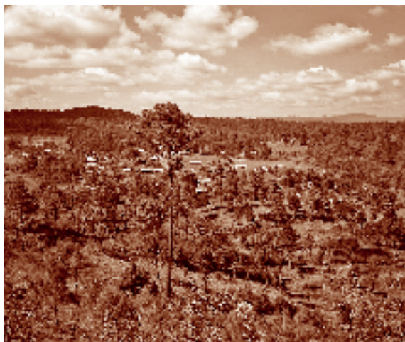
Vista panorámica de la comunidad Nuevo Porvenir, La Trinitaria, Chiapas. Fernando Limón Aguirre, 2005. Acervo personal.