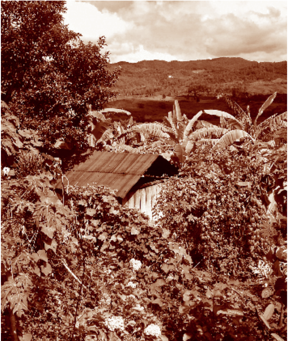
Vivienda y solar. Pinal del Río, La Independencia, Chiapas. Fotógrafo: Fernando Limón Aguirre, 2005. Acervo personal.