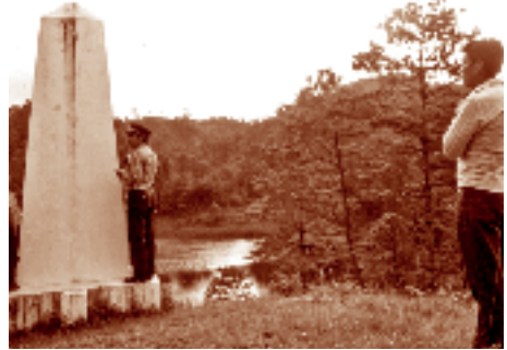
“Monumento” que marca la frontera entre México y Guatemala. Tziscaco, Chiapas. Fotógrafo: Lorenzo Armendáriz García, 1987. Fototeca Nacho López, CDI.

En esta zona destacan también otros casos como el de los mam y los q'anjobales . Al momento del trazo de la frontera quedaron en territorio mexicano comunidades cuyo centro cultural está