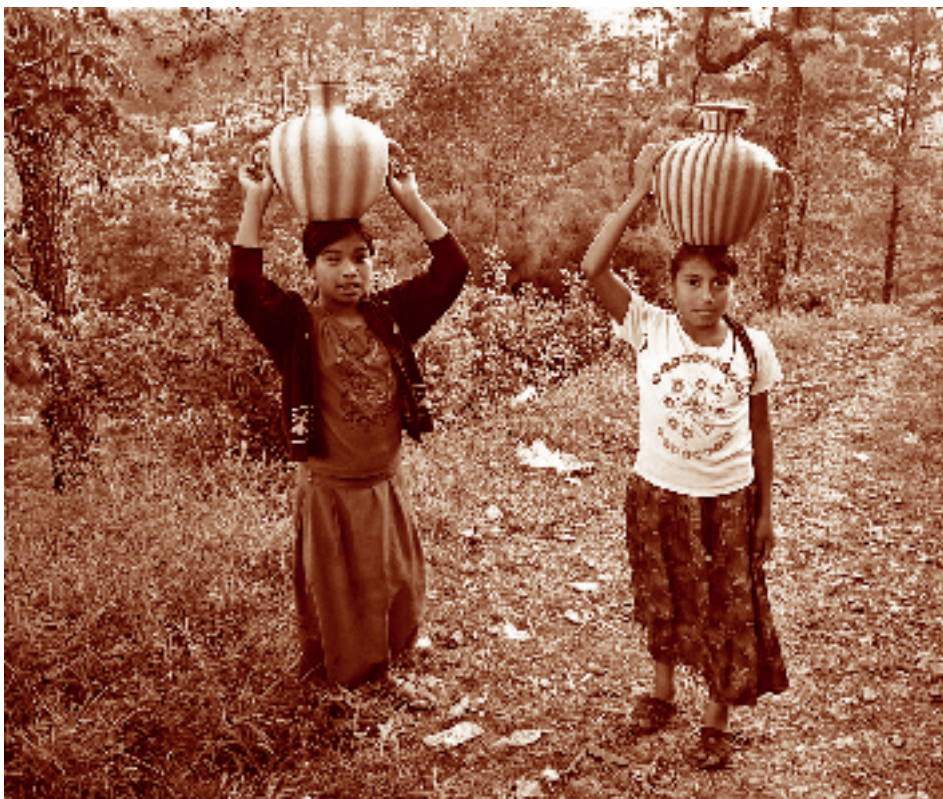
Muchachas chuj cargando agua. Río Loma Linda, La Trinitaria, Chiapas. Fotógrafo: Fernando Limón Aguirre, 2005. Acervo personal.

ticular o específica de vivir “lo maya”, que hoy por hoy es una conjunción de lo cultural, lo histórico y lo político, teniendo a la espiritualidad como soporte y sustento de su visión del mundo o cosmovisión.