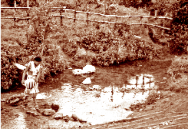
Mujer chuj acarreado agua. Tzisco, Chiapas. Fotógrafo: Lorenzo Armendáriz García, 1987. Fototeca Nacho López, CDI.

de vida más importante, el espacio vital de la familia; puesto que en los momentos más trascendentes de la vida es la comunidad la que ofrece el marco de posibilidad para bien vivirlos, para enfrentarlos y para salir venturosos. Es la comunidad la que refrenda el sentido con el que se vive la vida.