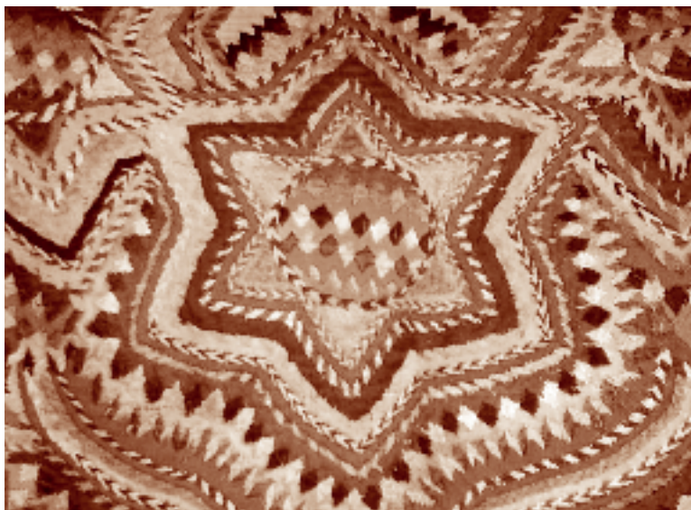
Detalle de las estrellas representadas en el huipil de las mujeres chuj. Río Loma Linda, La Trinitaria, Chiapas. Fotógrafo: Fernando Limón Aguirre, 2005. Acervo personal.

como consecuencia de su trabajo en el campo. Existe cierta añoranza respecto a la forma de celebrar estas fiestas en toda la comunidad, en las que se mataba una res en kokta'in 18 (es decir, todos cooperan para pagar el animal, lo que les da derecho a recibir pedazos de la carne), preparaban atole de maíz, rezaban a diario (durante nueve días), comenzando por el lesalum (rezador), compartían “un medio vaso” de aguardiente, tocaban sones en la marimba y bailaban.