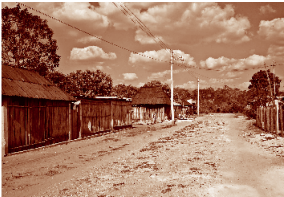
Barrio chuj en Campeche. Santo Domingo Kesté, Champotón, Campeche.

te, en los municipios de Las Margaritas, Maravilla Tenejapa y Marqués de Comillas. También se constató en los criterios de la actual búsqueda de tierras de los grupos ya situados en la región.