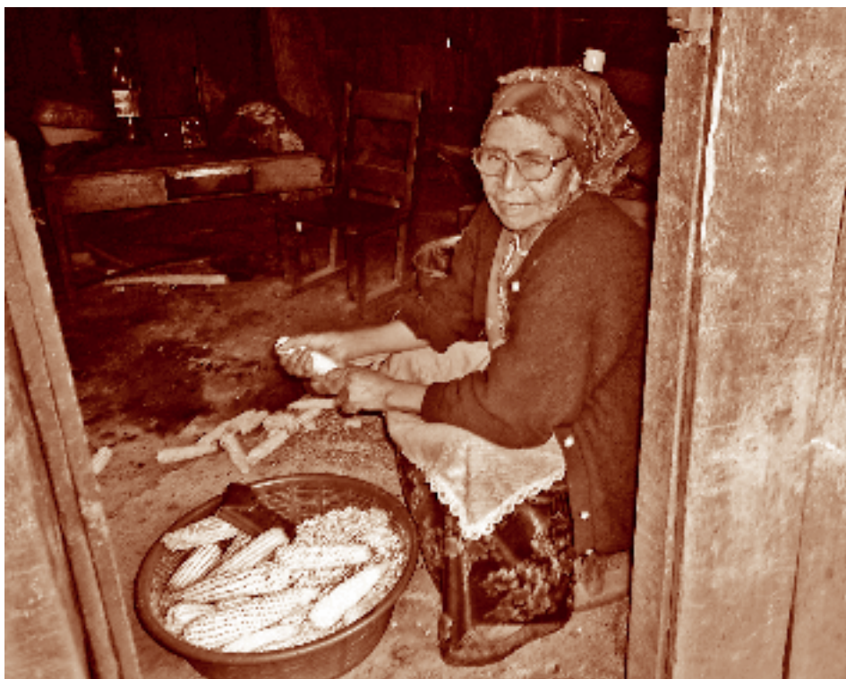
Anciana desgranando maíz. San Lorenzo, La Trinitaria, Chiapas. Fotógrafo: Fernando Limón Aguirre, 2005. Acervo personal.

El tiempo para llegar de Comitán, centro rector de la región al que se acude para atender asuntos de trámites ofi-