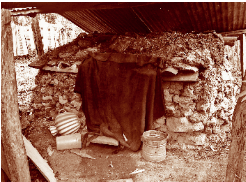
Ika baño chuj. San Lorenzo, La Trinitaria, Chiapas. Fotógrafo: Fernando Limón Aguirre, 2005. Acervo personal.

Esta espiritualidad invita a pensar siempre en el “Creador y Formador” y a hacer oración en todo momento, principalmente en los acontecimientos familiares (la reproducción familiar y socio-cultural) y en aquellos que tienen que ver con el maíz. En todo lo realizado se espera que se tome en consideración a la divinidad, se cuente con su bendición, se pida perdón por las acciones y se obtengan buenos resultados. La pala-