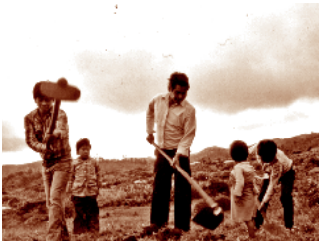
Familia trabajando en el campo. Tziscaco, Chiapas. 1987.

ciales o de mercado y de salud, a las primeras comunidades (ubicadas a 50 kilómetros) es de casi una hora, o de cuatro horas para llegar a las más lejanas (a 100 kilómetros).