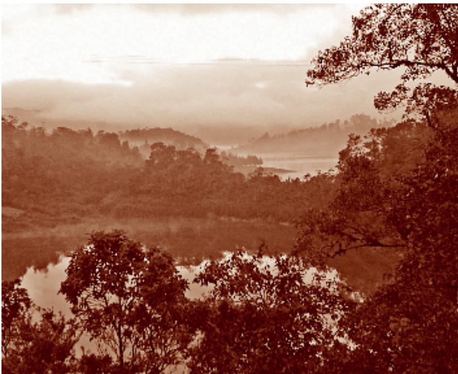
Lagunas Patianú y Tzisco. La Trinitaria, Chiapas. Fotógrafo: Fernando Limón Aguirre, 2004. Acervo personal.

con Chinhax cada cinco ( Wotonh , Lanhb'at y B'e'en ) son Alkal Oras (alcaldes), que significan los cuatro cargadores del mundo; y junto con Chawok y Ajaw son también los cargadores de años (estos, que los años siempre comienzan con uno de tales Oras).