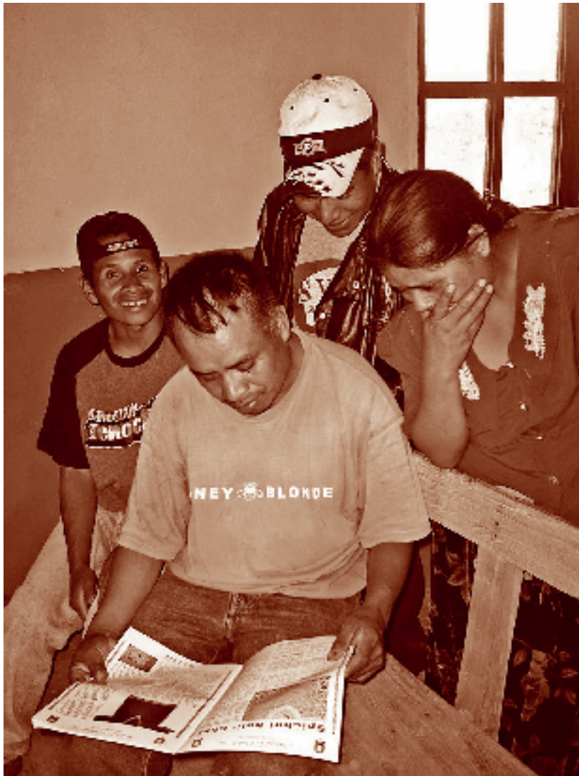
Leyendo una revista chuj donde se explica la simbología de su traje tradicional. Santa Rosa, La Trinitaria, Chiapas.