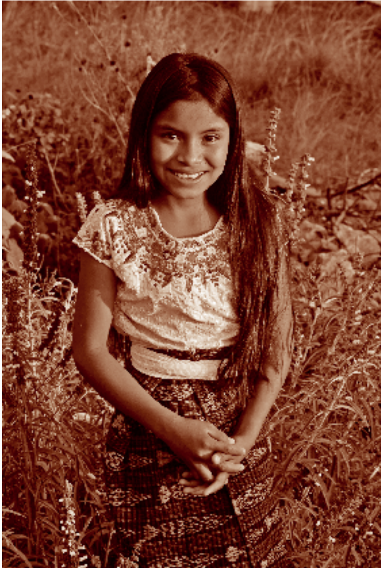
Niña chuj vestida con el traje tradicional. Nuevo Porvenir, La Trinitaria, Chiapas. Fotógrafo: Óscar Hagerman Mosquera, 2006. Acervo personal.