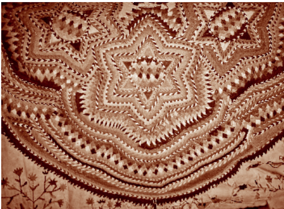
Detalle de un huipil chuj, río Loma Linda, La Trinitaria, Chiapas. Fotógrafo: Fernando Limón Aguirre, 2005. Acervo personal.

si se enteran nos maltratan; hasta ahora, nos burlan." "Si queremos quemar copal ha de ser de noche, que nadie lo vea." "Nos dicen que acá es México, que los indios son de Guatemala, pero nosotros sabemos que no es así, que es nuestra herencia y es nuestro derecho, 'onde sea que estemos'."