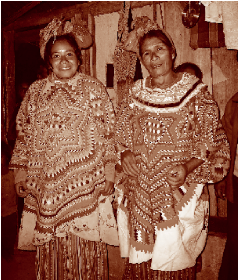
Mujeres chuj con el traje tradicional, río Loma Linda, La Trinitaria, Chiapas. Fotógrafo: Fernando Limón Aguirre, 2005. Acervo personal.

dentro de su territorio, en los cerros del entorno está el “dueño de la montaña”, que convive con otros seres a quienes se les reconoce y se les puede seguir respe-