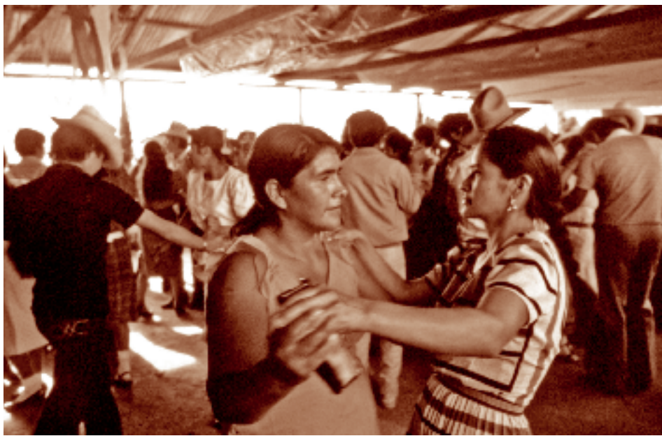
Al ritmo de la marimba. Tzisco, Chiapas. Fotógrafo: Lorenzo Armendáriz García, 1987 Fototeca Nacho López. CDI.