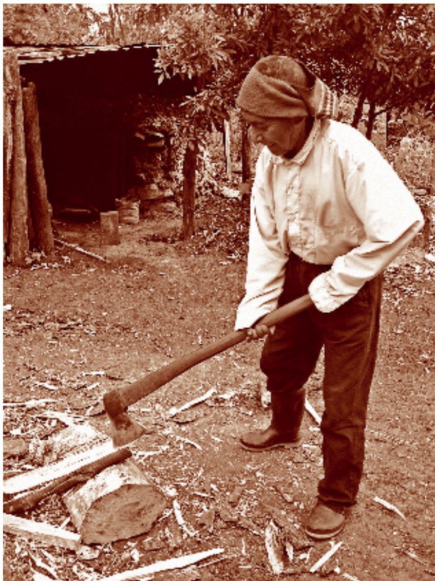
Anciano rajando leña. San Lorenzo, La Trinitaria, Chiapas.