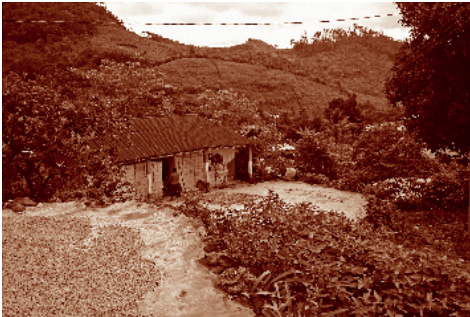
Secado de café y vivienda. El Horizonte, La Independencia, Chiapas. Fotógrafo: Fernando Limón Aguirre, 2005. Acervo personal.

El Estado mexicano ofrece, sobre todo en las localidades más grandes, ser-