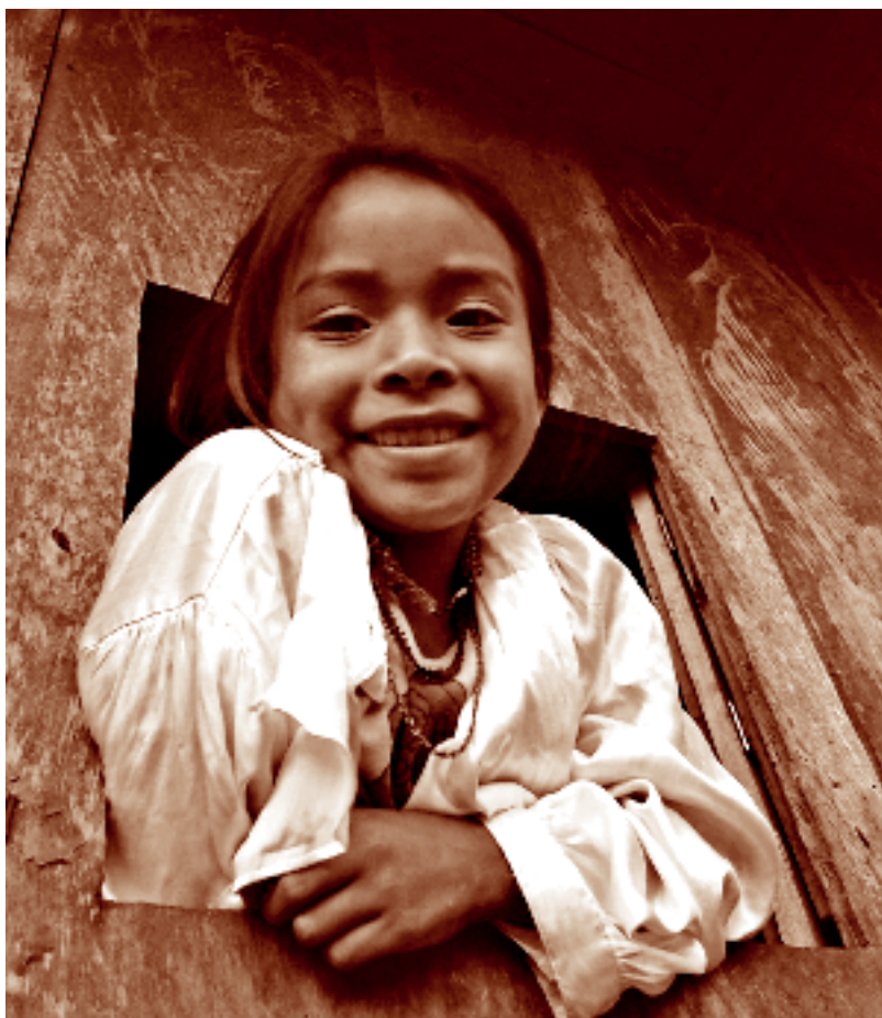
Mirando por la ventana. Santa Rosa, La Trinitaria, Chiapas. Fotógrafo: Fernando Limón Aguirre, 2005. Acervo personal.

La presencia chuj en México y sus actuales condiciones han sido producto de medidas gubernamentales adversas no sólo a su pueblo, sino a los indígenas en general. La vida de los chuj en