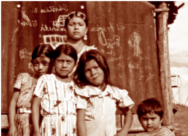
Niñas y niño chuj. Tziscaco, Chiapas. Fotógrafo: Lorenzo Armendáriz García. 1987. Fototeca Nacho López, CDI.

La negación de la identidad chuj es una situación que no se olvida. Por el contrario, refuerza la memoria histórica de discriminación que, a la vez, ha sido de resistencia: “hicieron que quemáramos nuestros huipiles y el kapixay ; ahí está el fuego... Algunos lo enterraron”. “Estamos como enterraditos; si queremos hablar la idioma (el chuj), debe ser dentro de nuestras casas. Nadie lo debe saber. Ese tiempo [en sentido genérico],