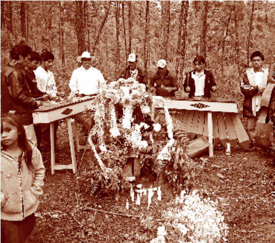
Músicos chuj tocando sones con la marimba en la fiesta de Todos Santos en el camposanto. San José Montebello, La Trinitaria, Chiapas. Fotógrafo: Fernando Limón Aguirre, 2005. Acervo personal.

bración de la Candelaria para Tziscoa, todos se congregan por ese motivo.