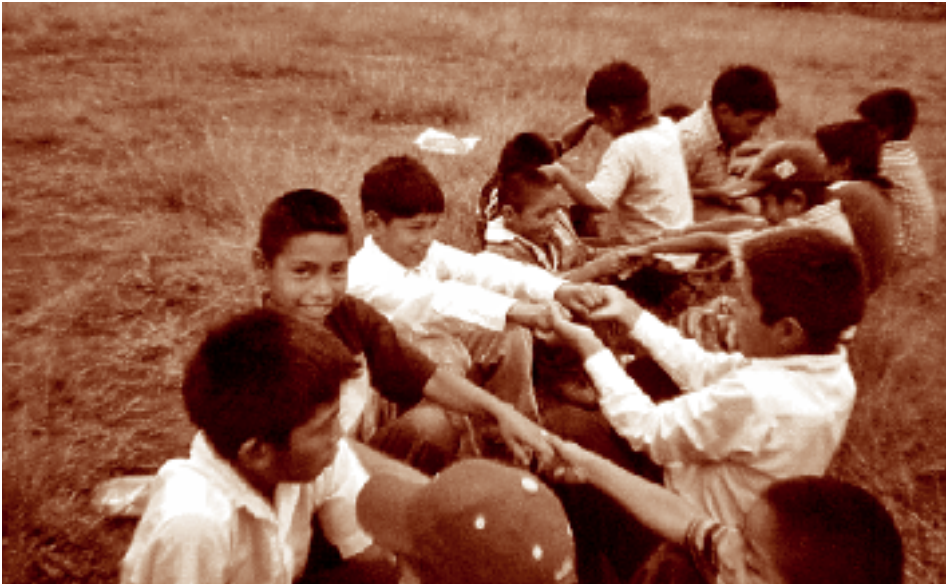
Niños “escuelantes” jugando. Nuevo Porvenir, La Trinitaria, Chiapas.

mas con respecto a la posesión de terrenos; algunos únicamente cuentan con el espacio ocupado por el sitio doméstico, en tanto que otros no son dueños ni de este pedazo de tierra. En este último