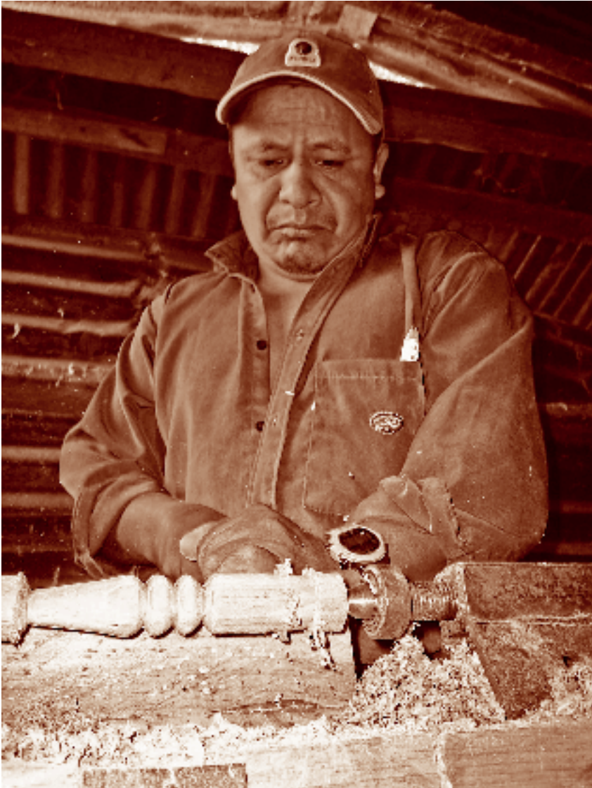
Carpintero. San Lorenzo, La Trinitaria, Chiapas. Fotógrafo: Fernando Limón Aguirre, 2005. Acervo personal.