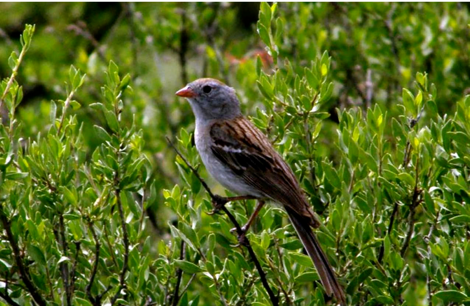
Figura 2. Gorrión Altiplanero perchado en hojásén ( Flourensia cernua ) en La Carbonera, Galeana, Nuevo León.

Sin embargo, durante los últimos 40 años sólo se ha reportado en un pequeño territorio que comprende la zona colindante entre los estados de Nuevo León y Coahuila, y más recientemente, en localidades de Zacatecas y San Luis Potosí (Canales del Castillo et al. , 2010a, Canales-Delgado et al. , 2015, Ruvalcaba-Ortega et al. , en prep.). Este territorio se incluye mayormente dentro de la región conocida como El Tokio, la cual está considerada por la Comisión Nacional para el Conocimiento y Uso de la Biodiversidad (CONABIO) como una de las 152 Regiones Terrestres Prioritarias del País (RTP-80; Arriaga-Cabrera et al. , 2000), así como una de las 193 Áreas de Importancia para la Conservación de las Aves (AICA NE-36; Arizmendi y Márquez, 2000). Dentro de dicha zona se encuentran las áreas de La Soledad,