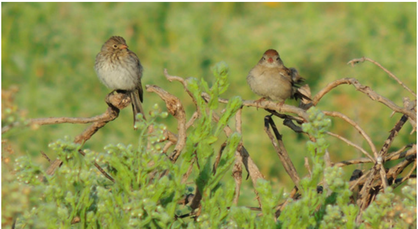
Figura 9. De izquierda a derecha, juvenil y adulto de Gorrión Altiplanero.

La supervivencia de los polluelos en la etapa de anidación es la única que se ha evaluado, la cual llega a ser tan baja (0%) como alta (50%) (Ruvalcaba-Ortega et al. , en prep. ). Sin embargo, no se han llevado a cabo estudios sobre la supervivencia de volantones o de adultos durante ciclos anuales. Como referencia, estudios recientes sobre la su-