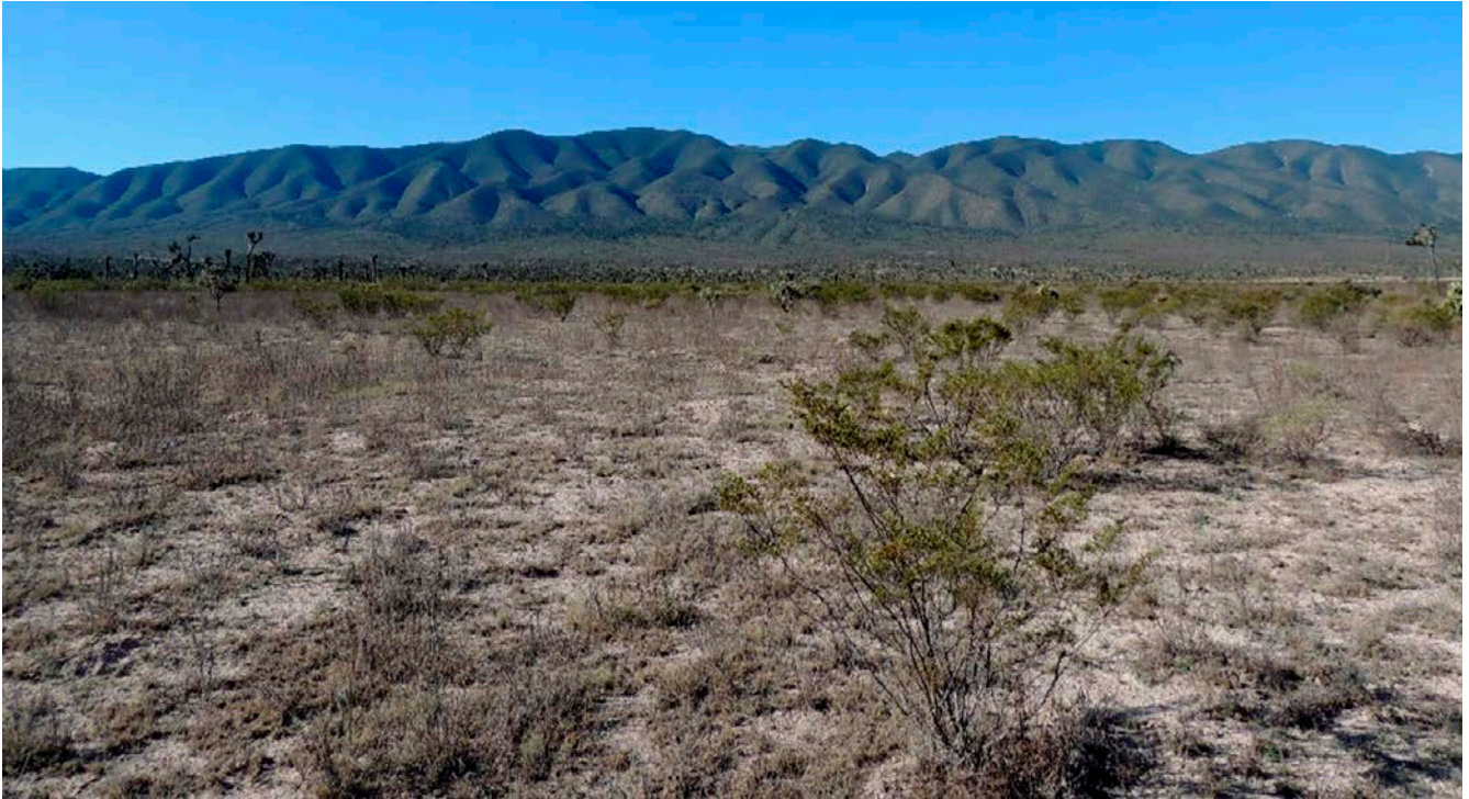
Figura 7. Área invernala del Gorrión Altiplanero en Tanque de Emergencia, Saltillo, Coahuila.