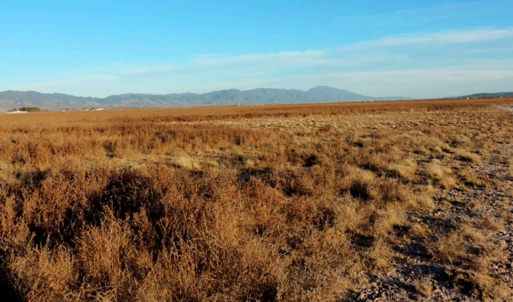
Figura 8. Área invernal del Gorrión Altiplanero en vegetación secundaria en El Erial, Galeana, N.L.

que se obtuvieron desde 0 hasta el 50% de éxito reproductivo aparente, donde la principal causa de pérdida de nidos fue la depredación (72%), además de algunos eventos de destrucción directa por ganado, vehículos y lluvias severas (Canales del Castillo, 2010, Ruvalcaba-Ortega et al. , en prep; Figura 9).