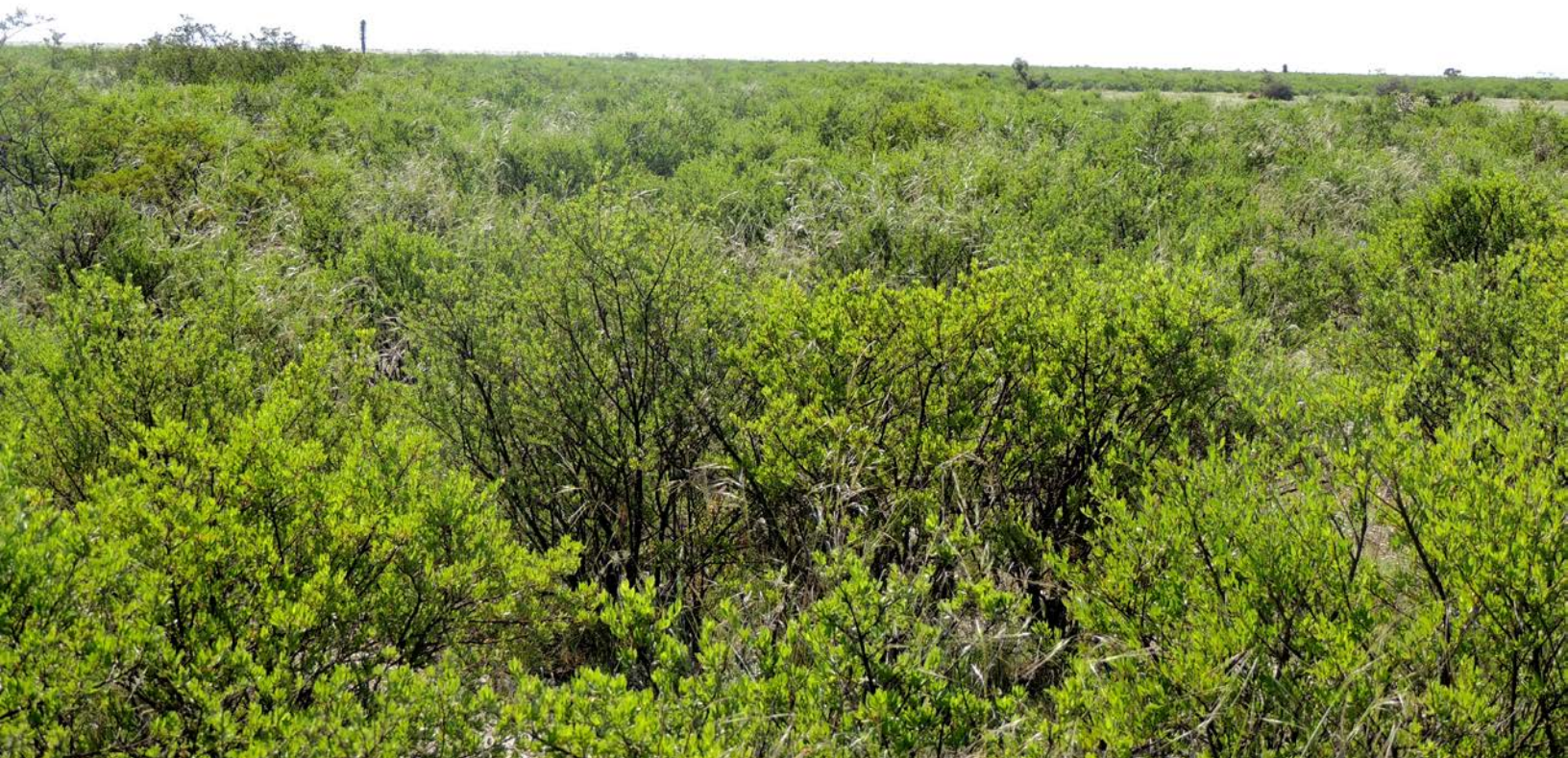
Figura 4. Zona de anidación del Gorrión Altiplanero en La Carbonera, Galeana, N.L., conformada en su mayoría por áreas de hojásén ( Flourensia cernua ) adyacentes a pastizal.

Los trabajos sobre selección del arbusto de anidación con base en 57 nidos analizados en el 2006, provenientes de diversas localidades de Coahuila y Nuevo León, muestran una mayor frecuencia de uso del hojásén ( Flourensia cernua ; 63%) seguido por nopal ( Opuntia sp.; 25%), hojásén- Opuntia sp. (7%), corona de cristo ( Koeberlinia spinosa ; 3%) y tomatillo ( Lycium berlandieri ; 2%; González-Rojas et al. , 2007). En cuatro años de estudio posteriores (2007-2010), se mostró que, con base en 193 nidos, los dos arbustos desérticos principales para la anidación fueron hojásén (49.2%) y chamizo ( Atriplex canescens ; 28%); sin embargo, también se han registrado diversas herbáceas secundarias con estructura arbustiva que son utilizadas como sitios anidación, incluyendo especies del género Conyza , Chenopodium y Artemisia (15%; Ruvalcaba-Ortega et al. , en prep.).