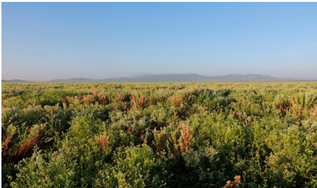
Figura 5. Zona de anidación del Gorrión Altiplanero en El Salero, Galeana, N.L., conformada por vegetación secundaria.

Pocos sitios de anidación se habían reportado hasta el 2010. En 1991 se encontró un sitio en el ejido La India, municipio de Saltillo, y en el 2004 se localizaron siete nidos con un éxito del 14 % (Garza de León et al. , 2007). Durante el 2005 en la localidad de Tanque de Emergencia, Saltillo, Coahuila, se localizaron cinco nidos abandonados y uno activo (Canales-Delgadillo et al. , 2007); también se han reportado sitios de reproducción en Las Esperanzas (Behrstock et al. , 1997) y recientemente en los Ejidos San Rafael y La Carbonera en el municipio de Galeana, Nuevo León y San José del Alamito en Coahuila (Canales del Castillo et al. , 2010a). Entre el 2007 y 2010 se evaluó la supervivencia durante el periodo de anidación en diversas localidades, con base en 172 nidos, en las