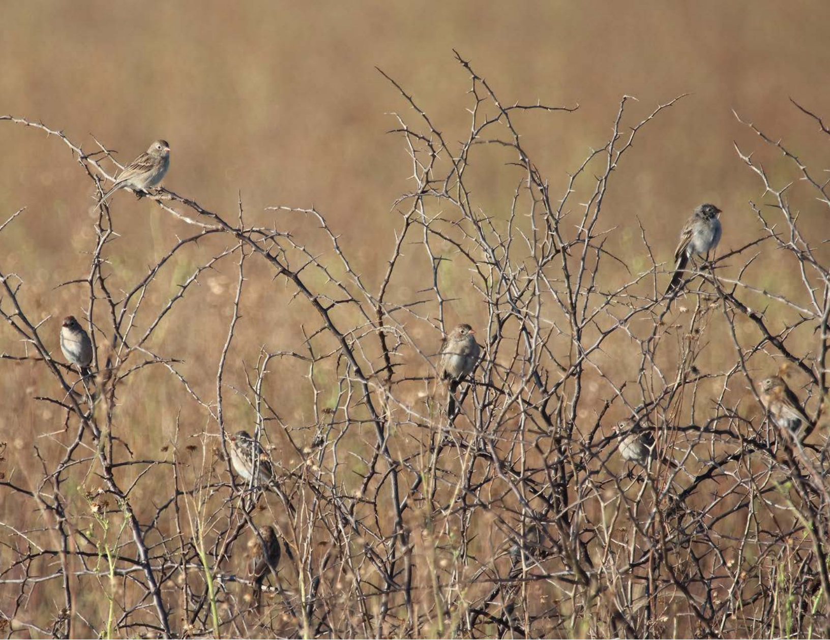
Figura 10. Parvada monoespecífica post-reproductiva del Gorrión Altiplanero.

pervivencia invernal de gorriones de pastizal ha sido variable entre años, oscilando entre una media de 28% y 81% (Macías-Duarte et al. , en prep. ).