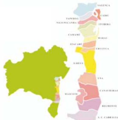
Principais municípios produtores de piçava na Bahia