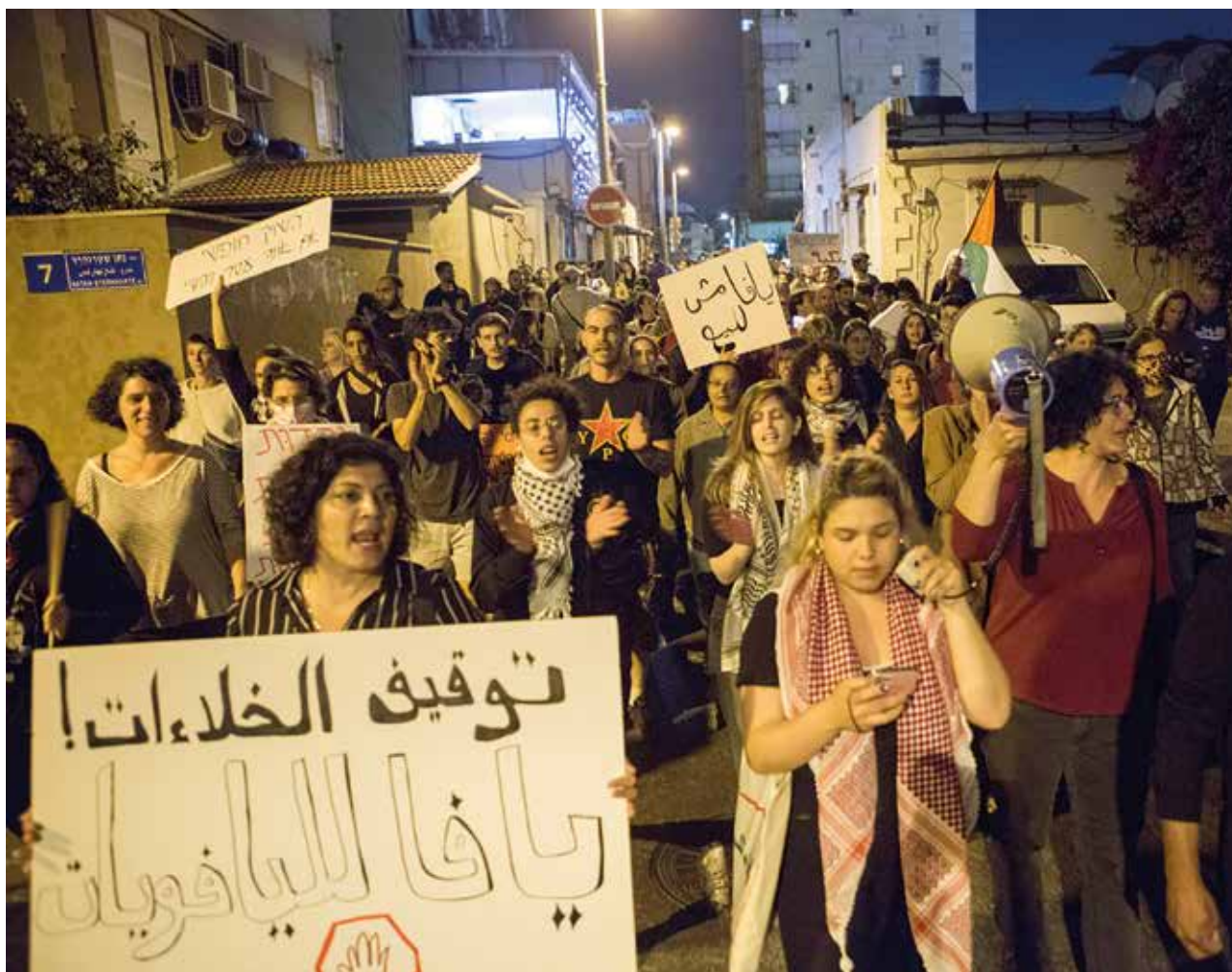
Jaffa - op de borden: 'Jaffa voor de Jaffawi!' & 'Jaffa is niet te koop!'

Israel heeft deze archeologische projecten op bedrieglijke wijze verkocht als ‘toeristische ontwikkeling’ en ‘stadsvernieuwing’, waarbij zelfs wordt beweerd dat een en ander is bedoeld om ‘joods-Arabische betrekkingen’ te verbeteren. De huidige protesten richtten zich onder meer tegen een binnenkort te openen museum voor het