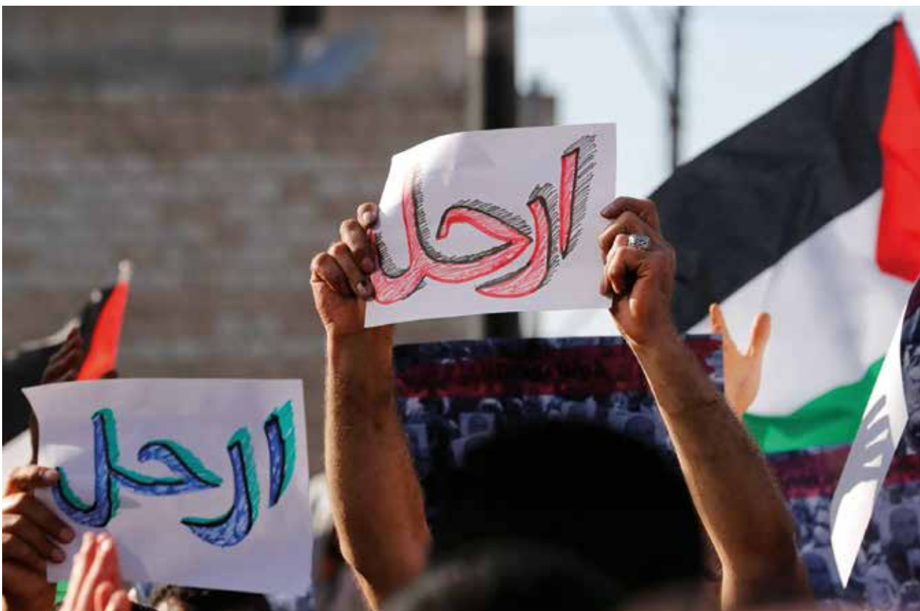
Ramallah – oproep aan Mahmoud Abbas: 'vertrek!'

Net als gemeentebesturen hield het leiderschap van elke Palestijnse gemeenschap zich – op enkele uitzonderingen na – uitsluitend bezig met lokale aangelegenheden. Zo werd de relatie van HAMAS met Israël grotendeels gereduceerd tot het zoeken naar verlichting van de alomvattende blokkade van de Strook van Gaza, concentreerden Palestijnse partijen binnen Israël zich op het steeds schaamtelozer wordende racisme van de Staat tegenover hun Palestijnse achterban, terwijl in Ramallah Mahmoud Abbas er zich bijna volledig op toelegde om tot zijn laatste adem als PNA-president in functie te blijven. Zo ging op het