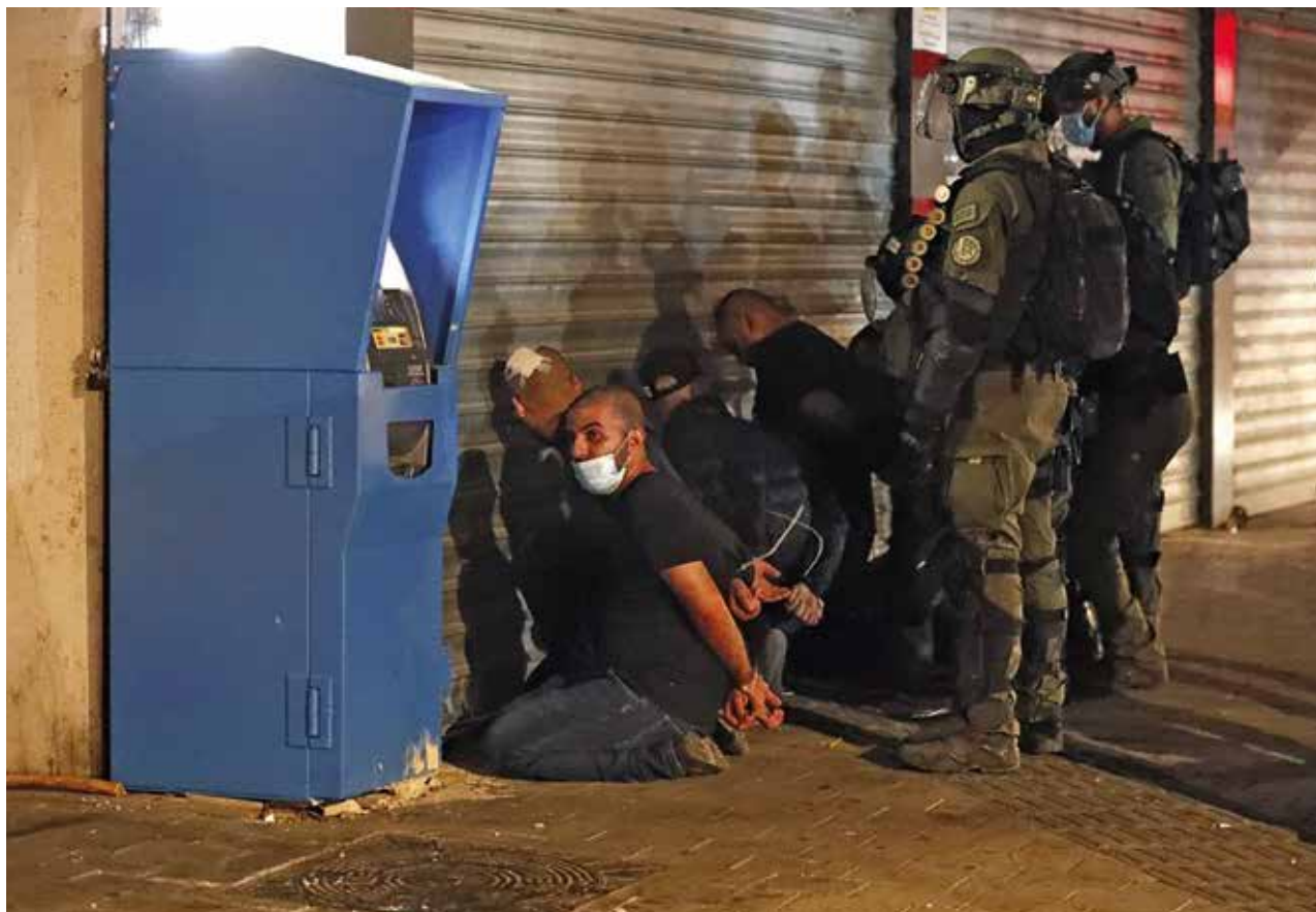
Lod/Lyddá - agenten 'Grenspolitie' en Palestijnse arrestanten