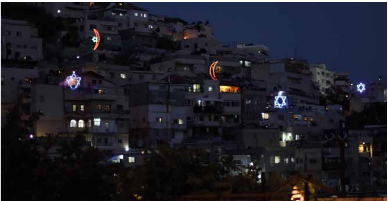
Silwan – deels al verjoedst