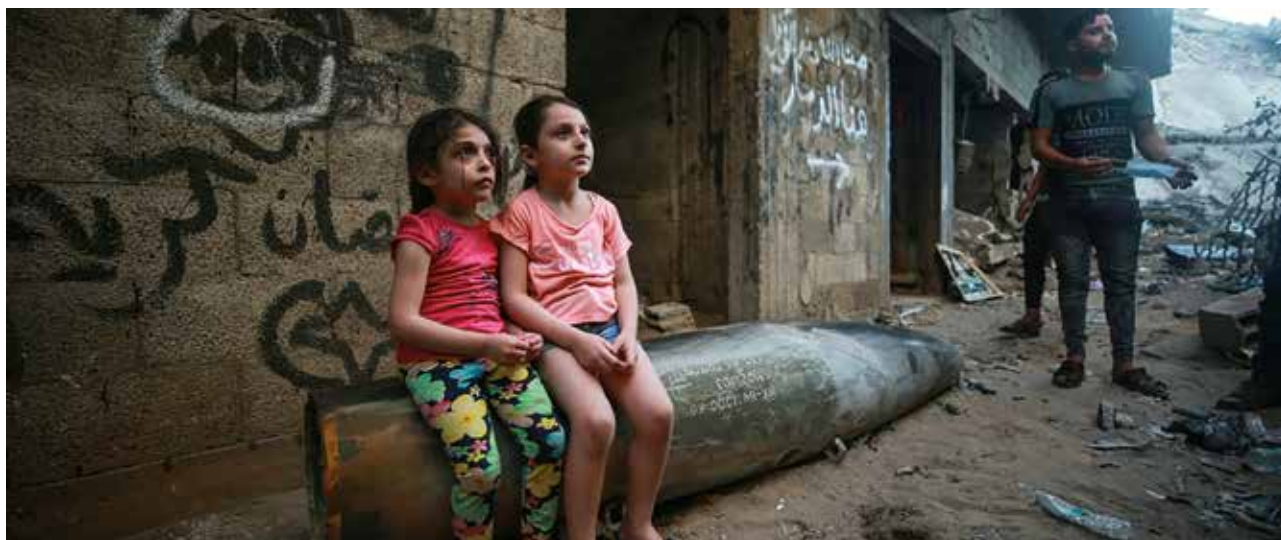
Gaza – niet-ontplofte Israelische munitie