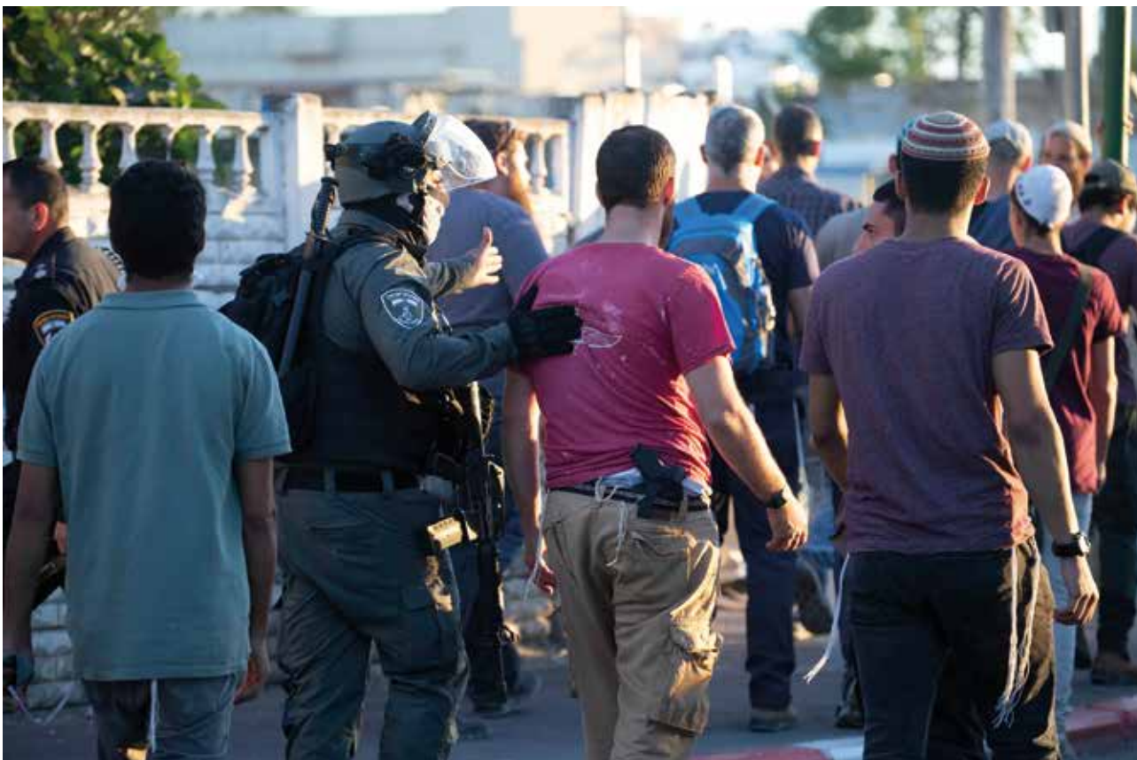
Lod/Lyddá - agent 'Grenspolitie' begeleidt een gewapende joodse kolonist

Maar er zijn praktische, veel banalere redenen waarom synagogen en yeshiva's tot de eerste gebouwen in Lod behoorden die werden aangevallen.