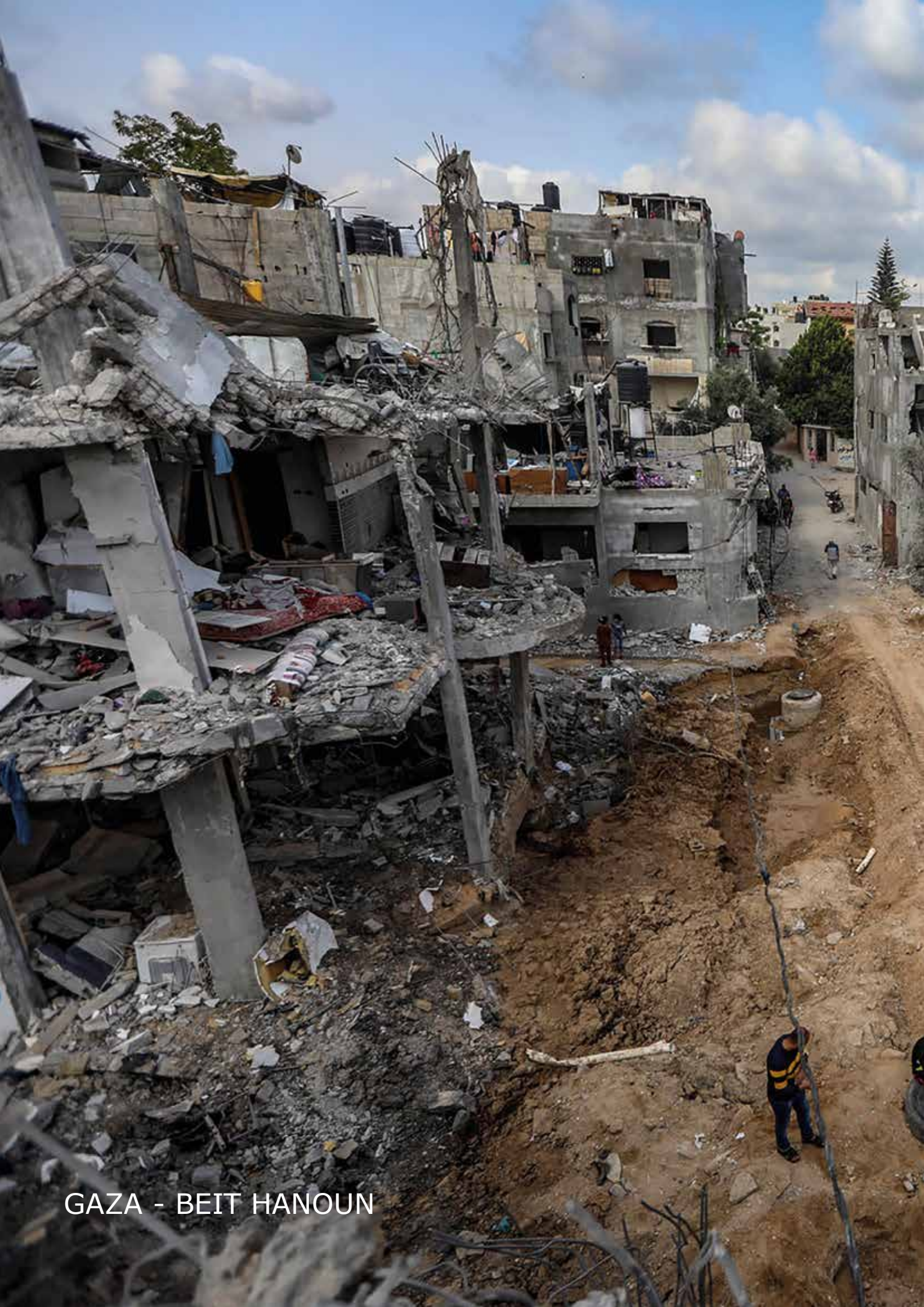
GAZA - BEIT HANOUN