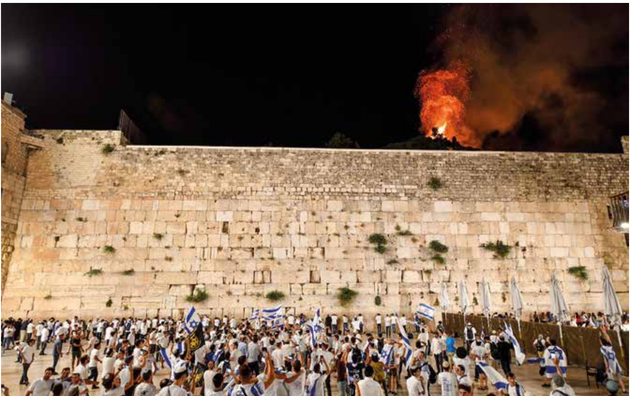
Klaagmuur - brand op terrein Aqsa Moskee