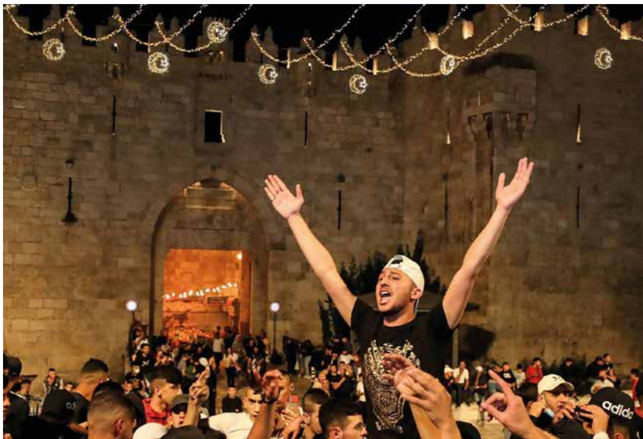
Damascus-Poort, Oude Stad Jeruzalem

De repressie tegen de protestbeweging is niet alleen fysiek geweest. Activisten in Sheikh Jarrah hebben geklaagd dat sociale mediagiganten hun