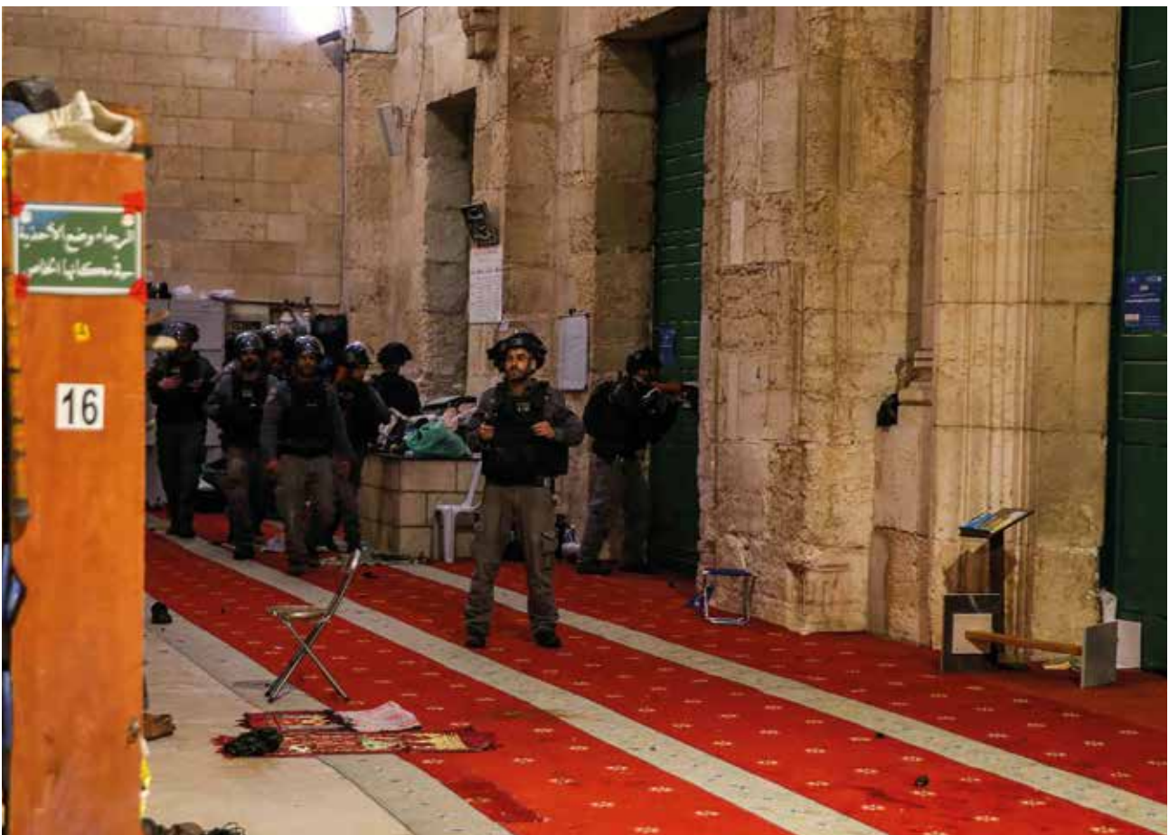
inval 'Grenspolitie' in Aqsa Moskee