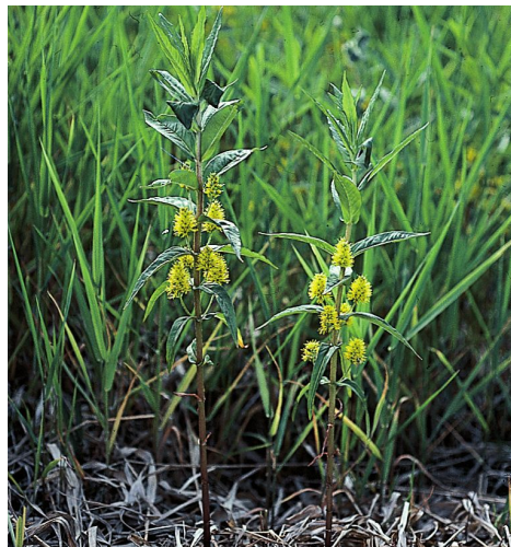
Gulldusk. (Bjørn Moe)

Ta av ved skiltet «Fossevatna», 4 kilometer nord for Alversund. Frå enden av vegen (parkeringsplass) går det stig inn i reservatet.