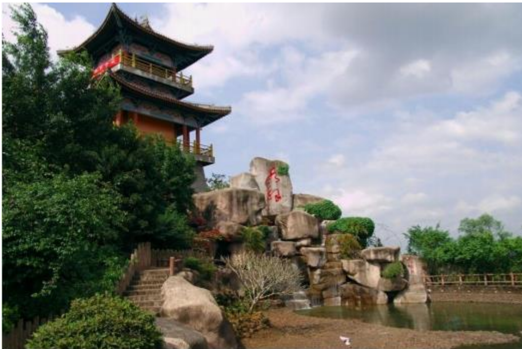
Templo de los Cinco Oficiales, Hainan.