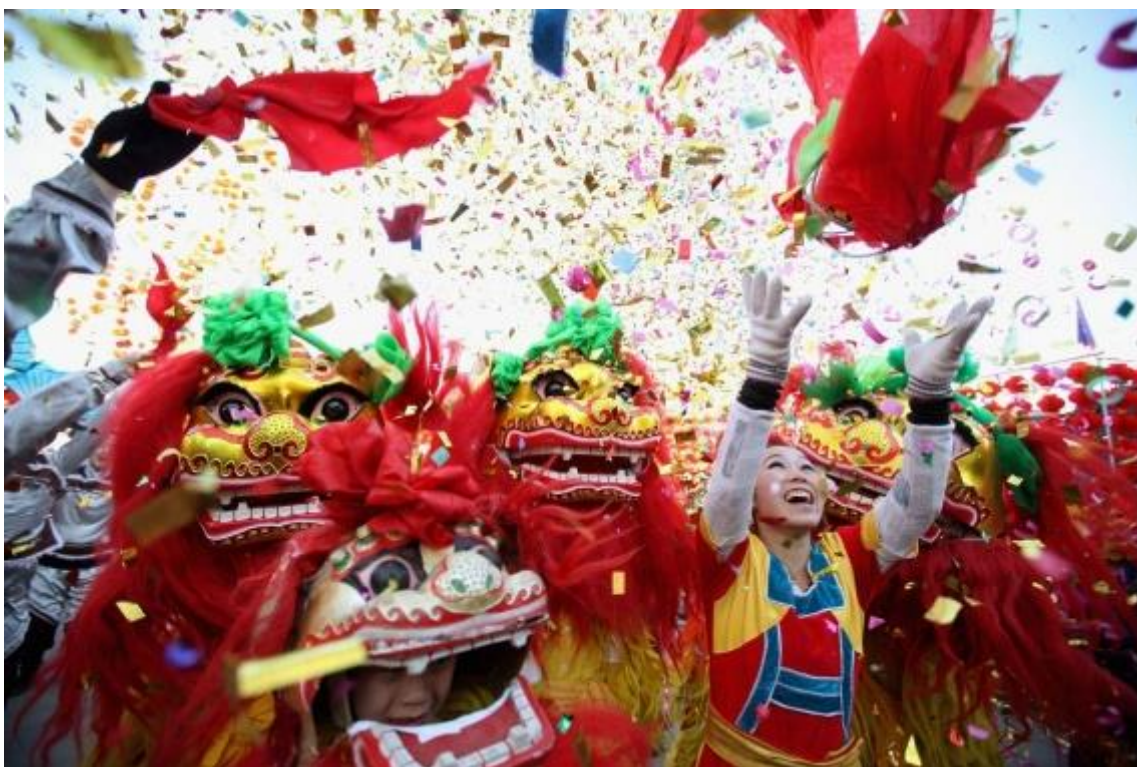
Fotografía de la Festividad de Año Nuevo Chino (2021).

Festival QingMing o Día de Limpieza de la Tumba (清明节 Qīngmíngjié): El tercer día festivo chino del año es el festival de Qingming, también llamado el Festival del Brillo Puro o el Día de Barrido de Tumbas. El Festival Qingming, que data de hace 2.500 años, simboliza el profundo respeto del pueblo chino por sus antepasados. El Festival de Qingming cae el día 15 después del Equinoccio de Primavera, que puede ser el 4, 5 o 6 de abril en cualquier año.