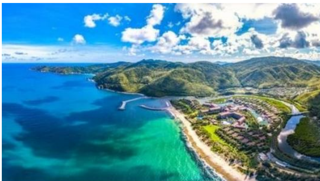
Vista aérea de una playa de la Provincia de Hainan.

Las playas de arena con pendientes lentas ocupan alrededor del 50-60% de las costas de Hainan. En la mayoría de los lugares, el mar está en calma con agua clara y la playa está bordeada de árboles verdes y cubierta de suaves arenas blancas. Con una temperatura que oscila entre los 18 y 30 °C y un sol cálido, es posible nadar en el mar o bañarse en la playa durante la mayor parte del año. A lo largo de la costa este, desde Haikou hasta Sanya, más de 60 lugares muestran potencial como áreas de baño. Además, los arrecifes de coral y los manglares son grandes atractivos turísticos. Hasta ahora, se han establecido cuatro zonas de protección de bosques manglares en el distrito de Qiongshan de Haikou, y el puerto Qinglan de Wenchang (People's Government of Hainan Province, s.f.).