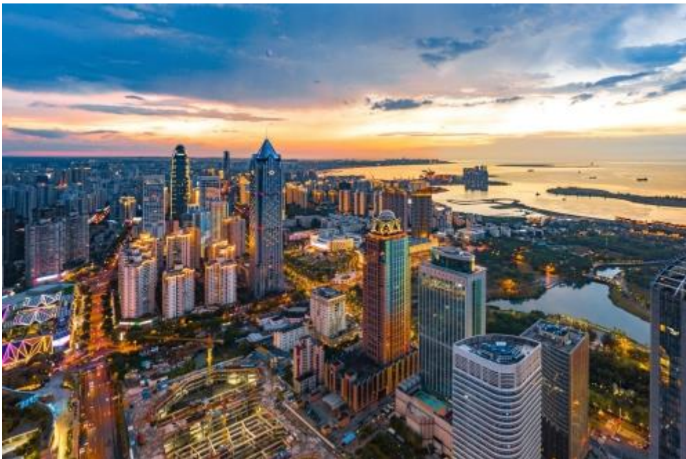
Vista aérea de la capital de la Provincia de Hainan, Haikou.

Hainan destaca por ser la provincia más meridional de China y está formada por diferentes islas -siendo la mayor de ellas la isla homónima de Hainan- situadas en el mar de China Meridional, en la parte más meridional del país, a 240 km al este de Vietnam. Tiene una superficie de 33.920 km 2 (siendo catalogada como la más pequeña en términos de superficie terrestre) y la capital provincial es Haikou. Cabe destacar que dentro de las ciudades más importantes de dicha provincia se encuentran Meilan, Hedong, Nada, Yongxing, etc (People's Government of Hainan Province, s.f.).