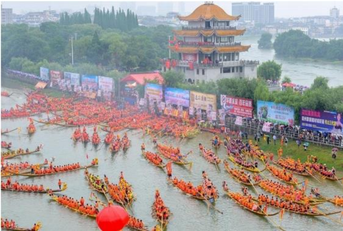
Vista Aérea del Festival del Bote del Dragón en la República Popular China (2020).

Con más de 2,000 años de historia, ésta es una de las fiestas chinas más tradicionales, y también una de las que involucra más supersticiones (迷信 míxìn).