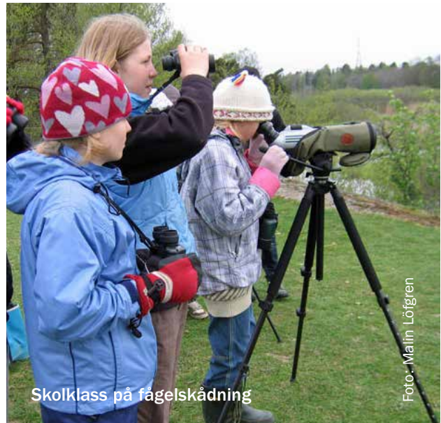
Skolklass på fågelskådning

Kunskap om kommunens naturvärden är en grundläggande förutsättning för ett hållbart nyttjande av naturen och för all planering för en hållbar utveckling av kommunen. Målet är därför att höja kunskapsnivån hos politiker, tjänstemän och allmänhet. Kunskap och engagemang hänger ihop och stärker varandra.