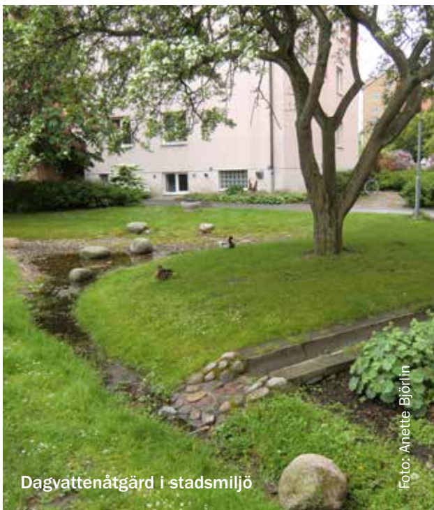
Dagvattenåtgärd i stadsmiljö

De fem åtgärdsområdena anger kommunens ambitioner för naturvårdsarbetet. Alla åtgärder inom åtgärdsområdena ska leda till att minst en av naturvårdsplanens övergripande målsättningar uppfylls. Inom varje åtgärdsområde finns ett antal konkreta åtgärder som respektive nämnd och bolag bör genomföra för att fullfölja naturvårdsplanens målsättningar. Åtgärderna finns redovisade i åtgärdsplanen, se bilaga 1. Pengar ska årligen avsättas i budget för kontinuerliga naturvårdsinsatser inom åtgärdsområdena. Respektive ansvarig nämnd eller bolag ska i sin årliga mål- och budgetprocess arbeta in åtgärder med utgångspunkt från åtgärdsplanen. En avstämning av naturvårdsplanens åtgärdsplan ska göras årligen. I samband med aktualitetsprövningen av kommunens översiktsplan tas ställning till om det är aktuellt att även revidera naturvårdsplanen.