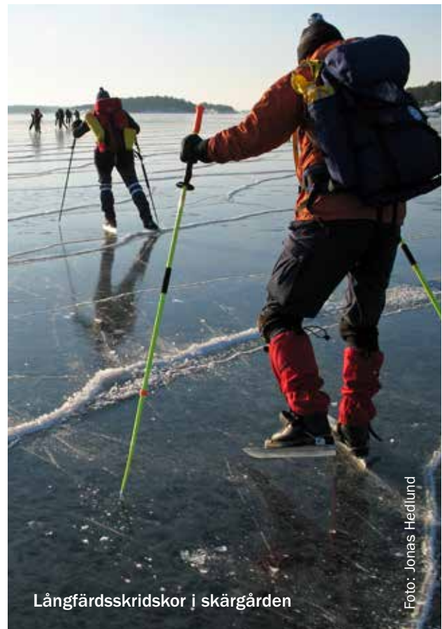
Långfärdsskridskor i skärgården

Information om och skyltning i kommunens naturreservat, värdefulla naturområden, utflyktsmål och attraktioner liksom arbetet med ökad tillgänglighet ska fortsätta att utvecklas. Samarbete ska utvecklas med skärgårdsstiftelsen och Stiftelsen Tyrestaskogen för gemensamma informationsinsatser.