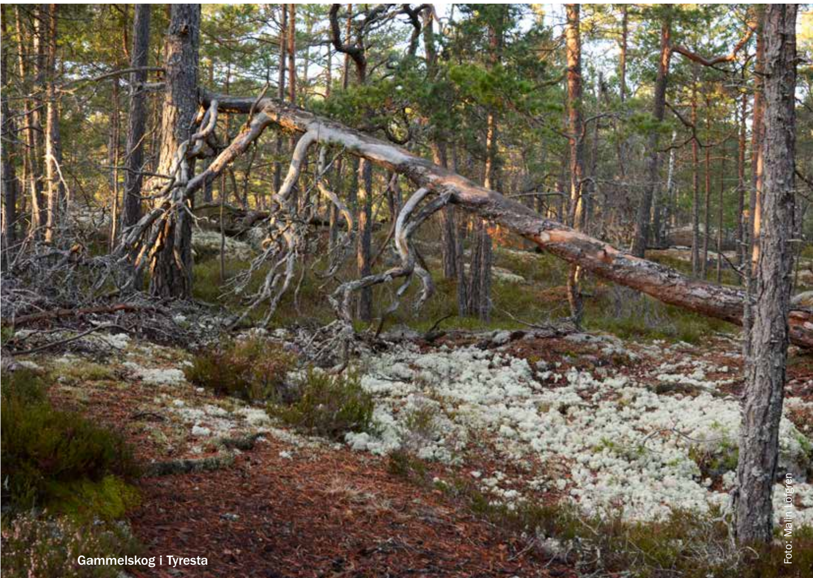
Gammelskog i Tyresta

Haninge är en växande kommun och en av de åtta kommuner som i Regional utvecklingsplan för Stockholms län, RUF 2010, utpekats som en regional stadskärna. Utvecklingen av den nya stadskärnan är ett långsiktigt arbete där en av utmaningarna är att värna kommunens biologiska värden och ekologiska samband samtidigt som mark behöver tas i anspråk för nya bostäder, företagsområden och infrastruktur.