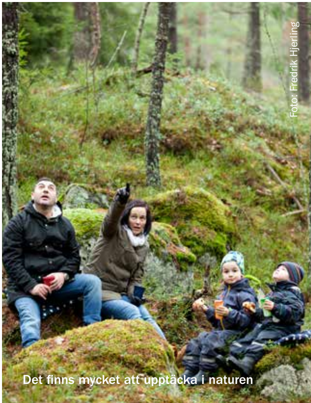
Det finns mycket att upptäcka i naturen