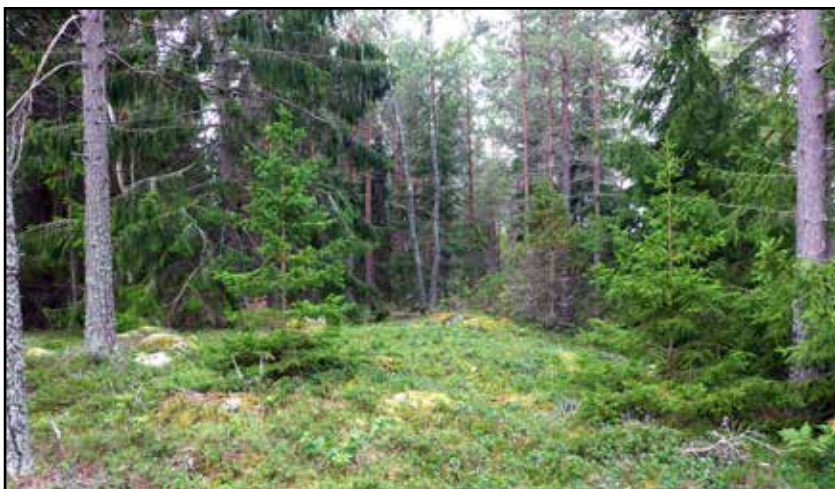
Fig. 3. L2014:4510, en stensättning i den östra delen av utredningsområdet, med kraftig kantkedja. Vy mot V.