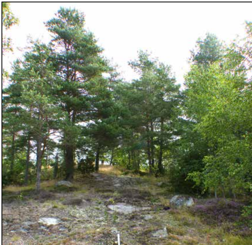
Fig. 9. Objekt 7/L2019.3932, är en hållristning om 3 älvkvarnar inhuggna på en berghäll som sluttar ner mot ängsmarken i väster. Vy mot Ö.

Objekt 6 och objekt 8 är två boplatslägen som utgör möjliga fornlämningar. De består av ett sadelläge med sluttningar respektive en sluttning mot väster. Gemensamt för dem är att de kan ses som en fortsättning av den boplat, L2014:4807, som undersöktes när väg 73 byggdes, de vänder sig mot samma flacka äng. Det är dock oklart hur stor del av markytan som är ursprunglig och hur stor del som förändrats för de greener som finns i området, se fig. 13.