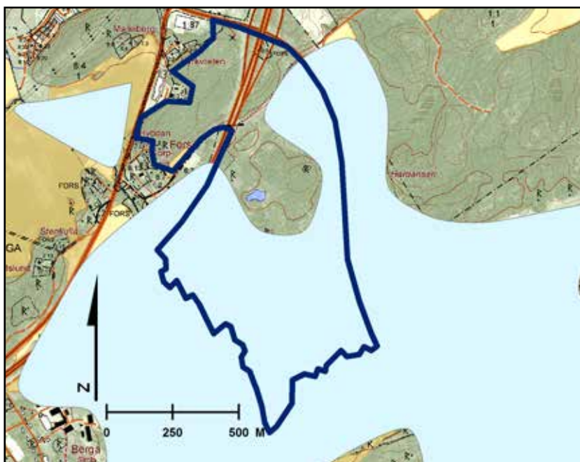
Fig. 4. Karta som visar strandlinjen 4 000 f Kr. På kartan återges utredningsområdet med en blå markering. Digitala fastighetskartan, skala 1:20 000.

I området runt Fors finns det ett stort antal fornlämningar från brons- och järnålder. Bilden av Haningebygden som ovanligt rik på fornlämningar styrks av de många arkeologiska undersökningar som utförts i området för motorvägen, väg 73, och för uppförandet av bostadsområden runt Västerhaninge centrum. Det nu aktuella utredningsområdet har berörts av flera arkeologiska utredningar och undersökningar som visat på många bosättningar från bronsålder fram till historisk tid.