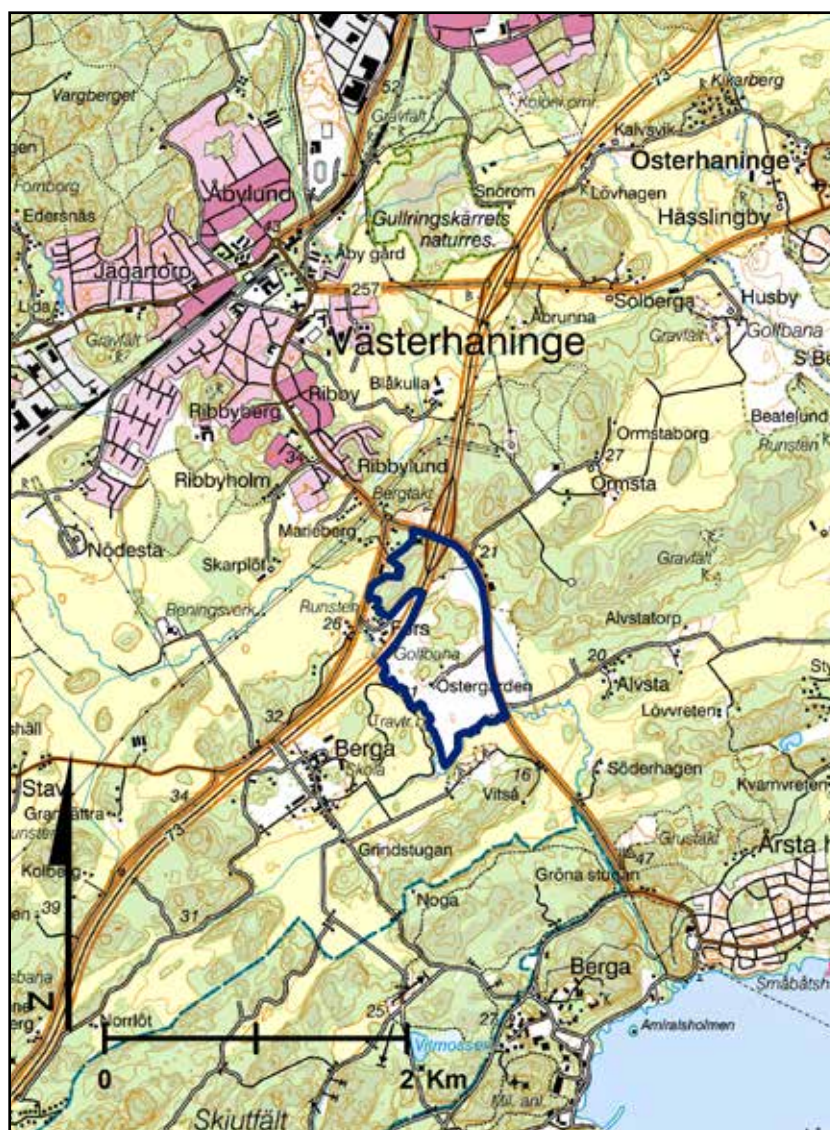
Fig. 2. Utredningsområdet, blå markering, ligger i Haninge kommun, söder om Västerhaninge, på ömse sidor om väg 73. Digitala topografiska kartan, skala 1:50 000.