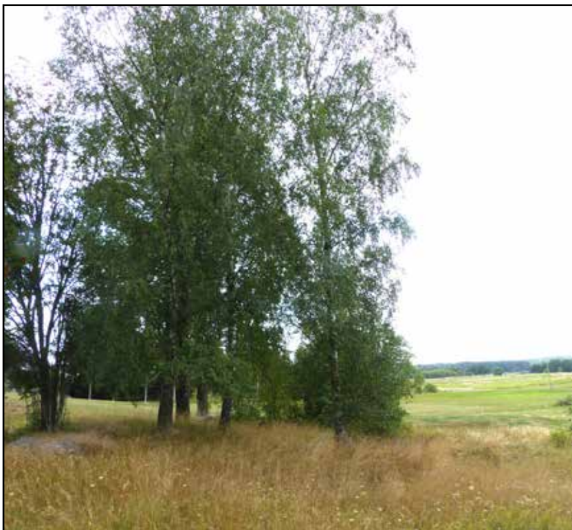
Fig. 12. L2014:4522 avser en stensättning i kanten av en moränhöjd, i sluttningen ner mot golfbanan finns även en källargrund, objekt 15/L2019:3936. Vy mot SSO.

Länsstyrelsen fattar beslut om fortsatta arkeologiska insatser.