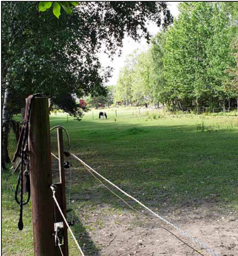
Fig. 1. Objekt 5 avser ett boplatläge på norra sidan av väg 73, helt nära Fors gård. I närområdet ligger gravfält och en boplat som undersöktes när väg 73 byggdes om till motorväg. Vy mot NV.

Sammantaget har de nypåträffade hållristningarna, stensättningen och boplatlägena visat att i likhet med andra områden i Haninge så finns det alltid fler fornlämningar att hitta.