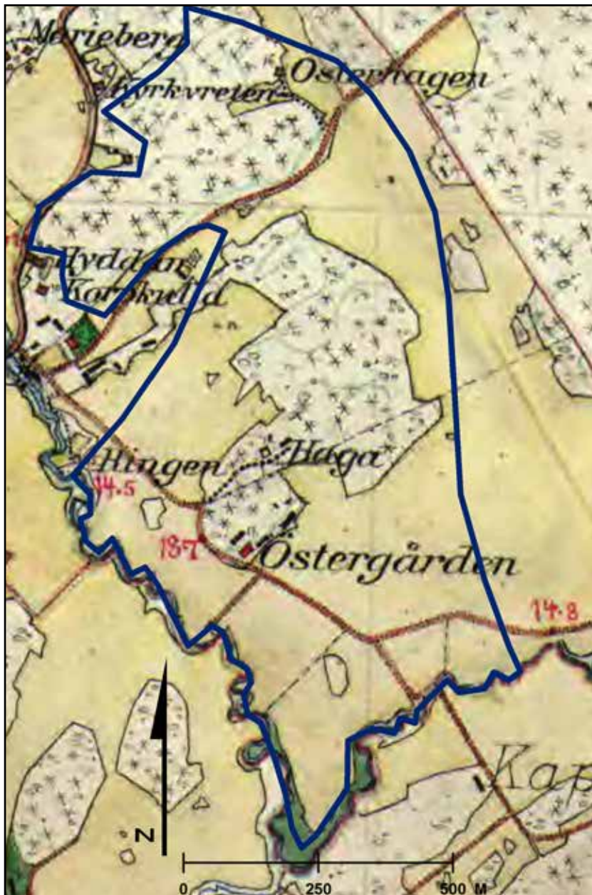
Fig. 6. Häraskartan år 1901 med utredningsområdet i blått. Den visar Östergården, torpet Haga och Hingen som alla uppfördes efter 1861 års laga skifte. Rektifierad, skala 1:10 000.