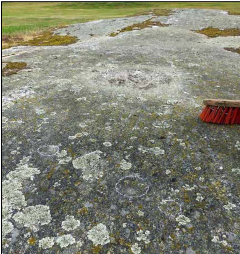
Fig. 14. L2013:4858 avser en hållristning om sju älvkvarnar som ligger på en flack håll i kanten av den öppna gräsmarken. Vy mot N.

Utöver dessa två fornlämningsmiljöer kan det finnas en äldre miljö från stenåldern på höjden i skogen.