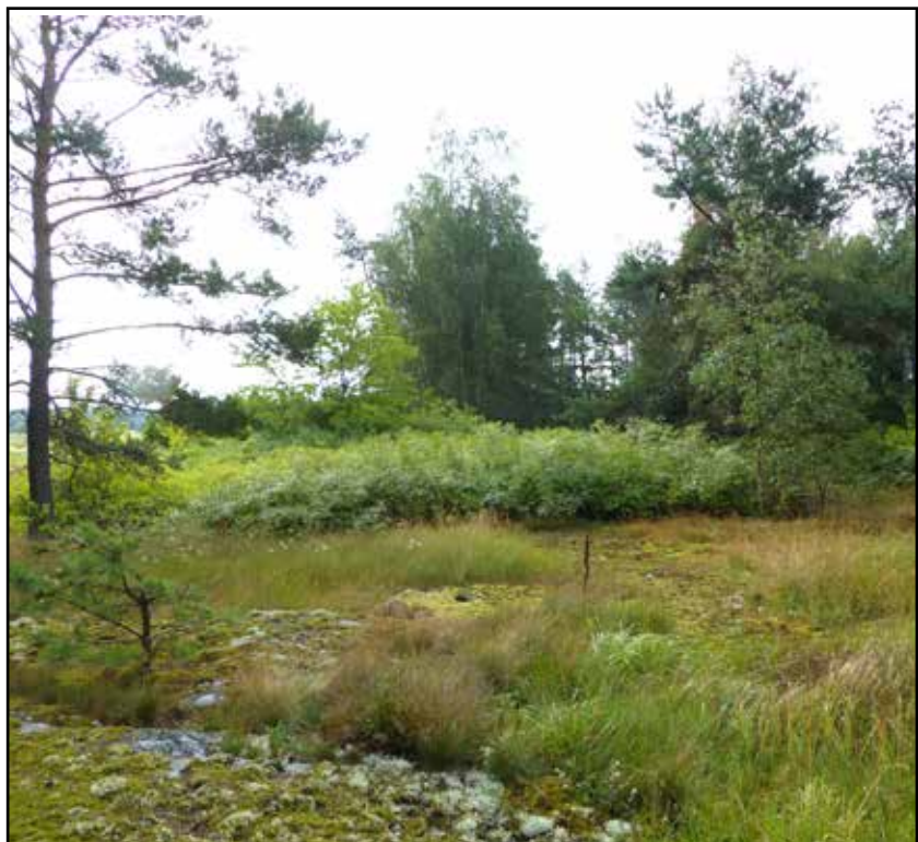
Fig. 11. I buskagen mitt i bild har torpet Haga legat, objekt 14/L2019:3935. Området utgör även ett fint boplatsläge, objekt 12, med hållmark och gravfält runtom. Vy mot SO.

Objekt 17 avser ett boplatsläge som sluttar svagt mot ån i väster. Det ligger i anslutning till ett gravfält. Området kan vara påverkat av marking-