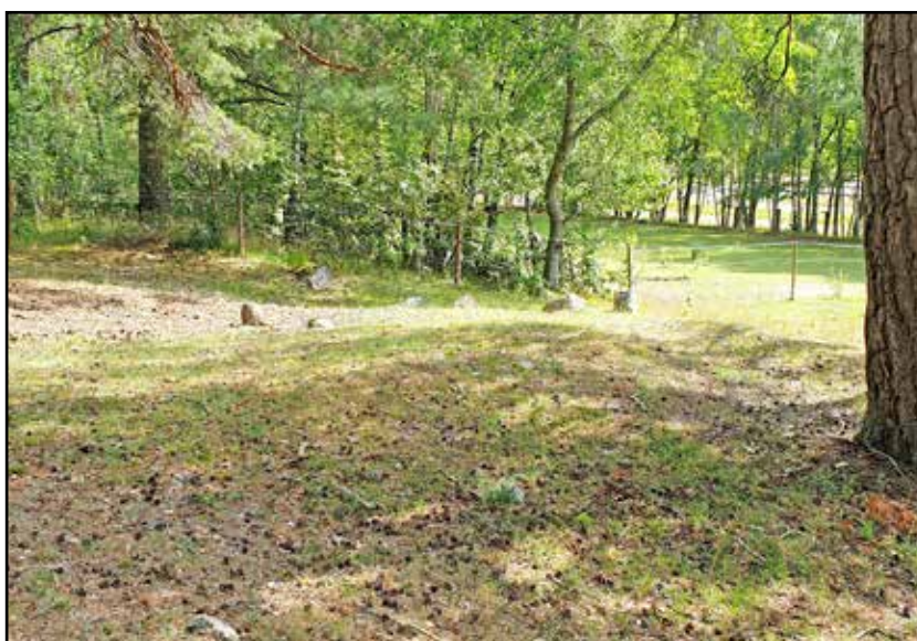
Fig. 7. Objekt 2/L2019:3921, är en nypåträffad grav, strax nordost om Fors gård. Den ligger i kanten av ett boplatsläge, objekt 5, som sluttar ner mot sydost. Vy mot S.

Objekt 3/ L2019:3929 och L2019:3930 , avser en tydlig stensättning som utgör en säker fornlämning och en stensättning som bedömts som en möjlig fornlämning då den är oregelbunden och omrörd i ytan. De är båda övertorvade och ligger intill varandra på en avsats i den sydsluttande hagmarken. I närområdet ligger objekt 4/ L2019:3931 som avser ytterligare en möjlig stensättning i ett liknande läge.