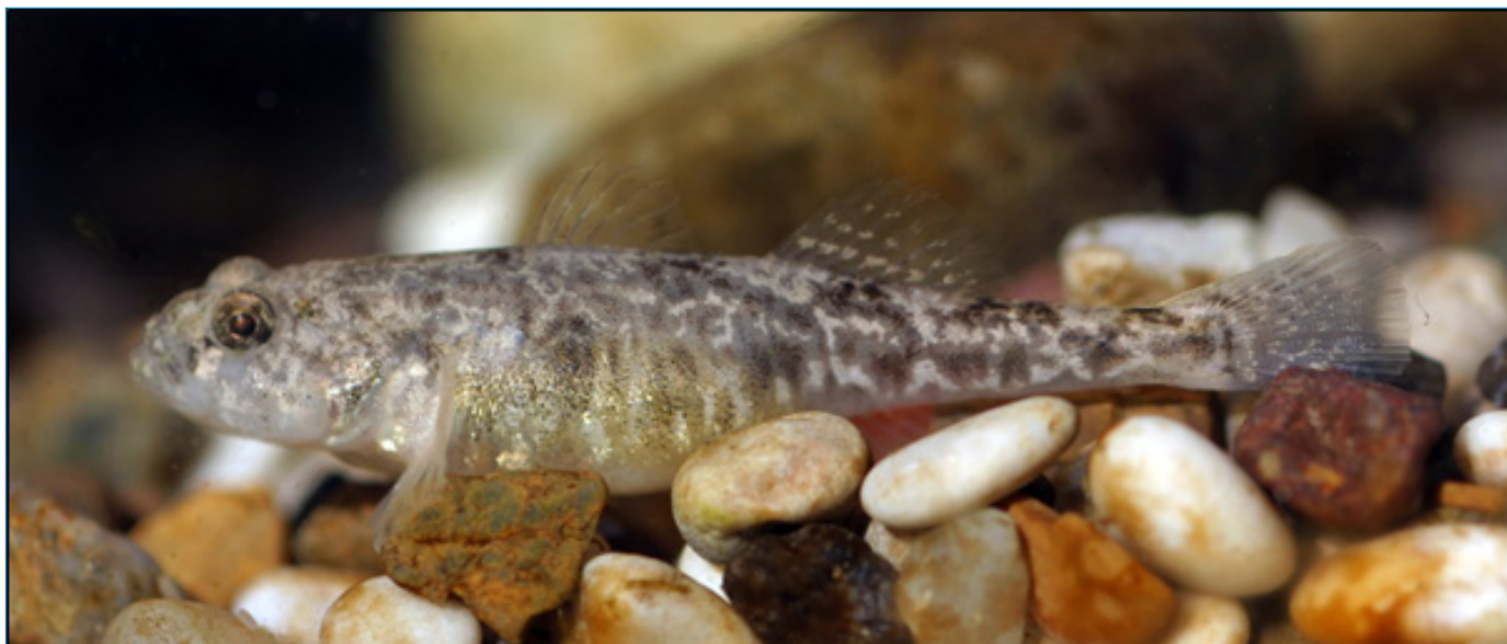
Slika 2. Vrgoračka gobica - ženka