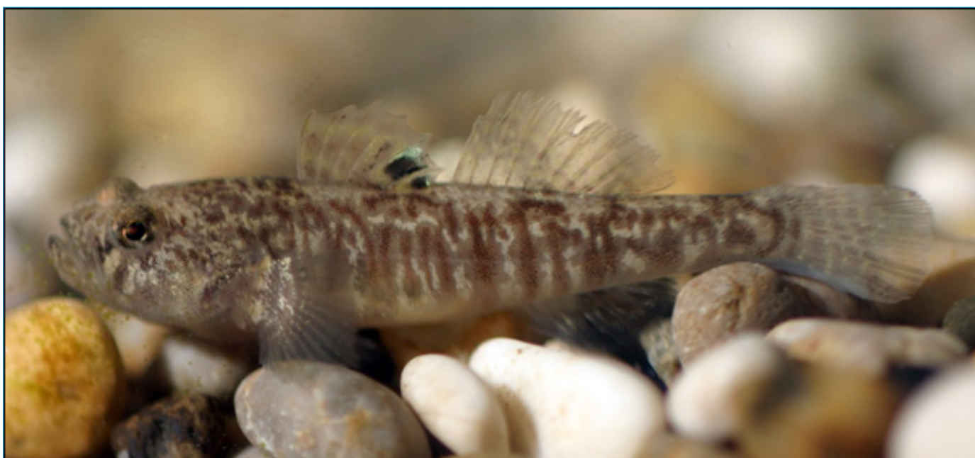
Slika 3. Vrgoračka gobica - mužjak