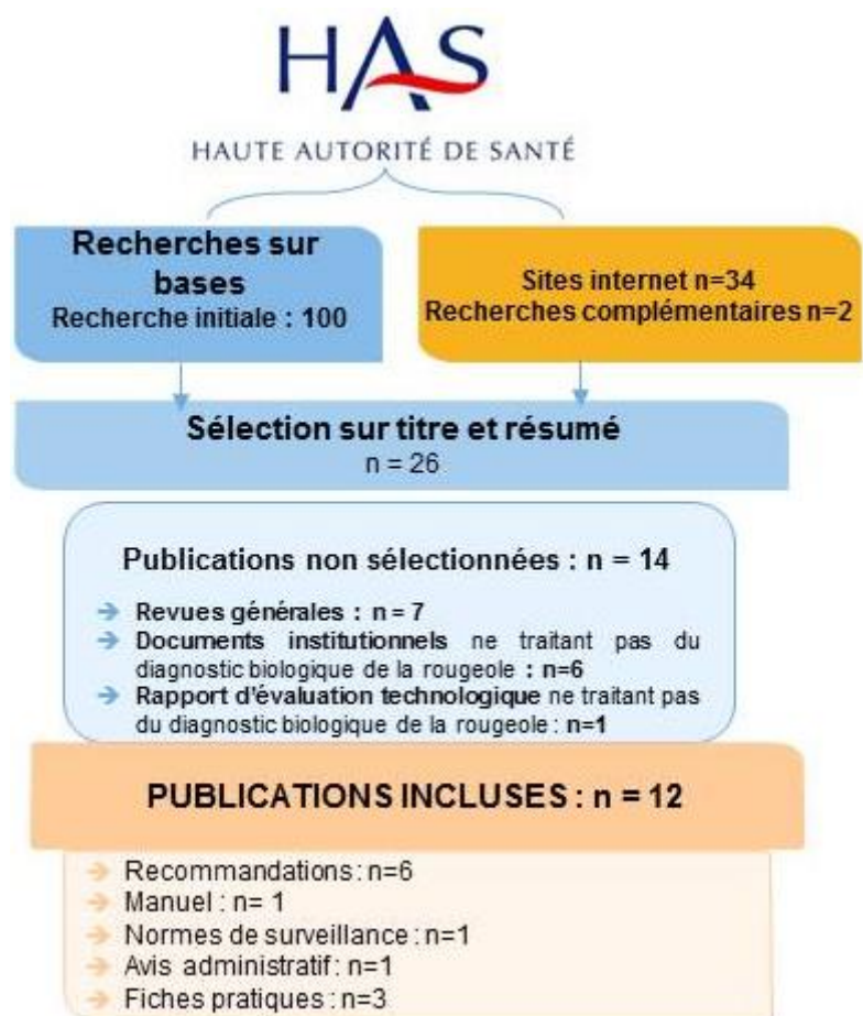
Figure 2. Résultats de la recherche documentaire et de la sélection de la littérature