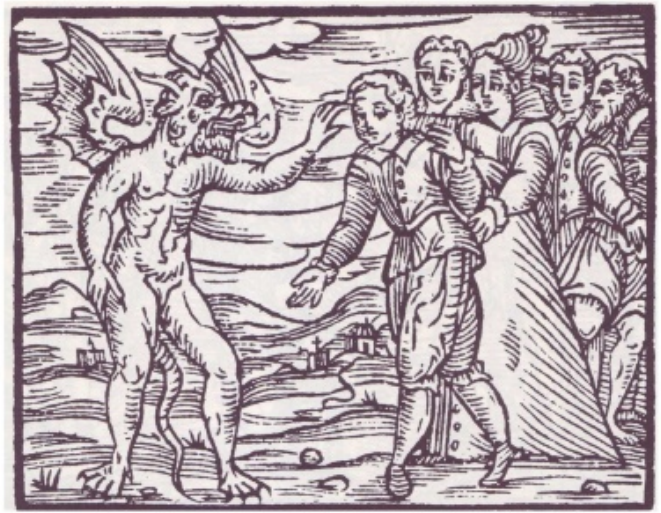
De duivel haalt het zalfkruis van geboorte en vormsel weg voor een paddenteken