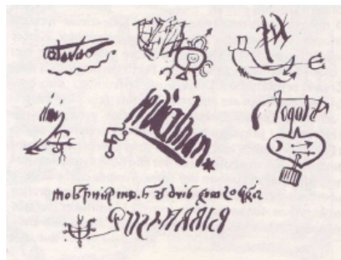
Handtekening van 7 duivels 1634 Lucifer Beelzebub Satan Elomi Leviathan Asteroth Baalbarith