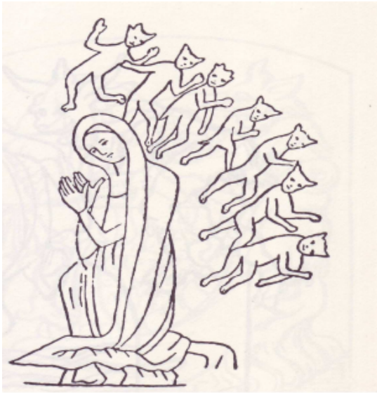
Een vrouw wordt bedreigd door de 7 doodzonden