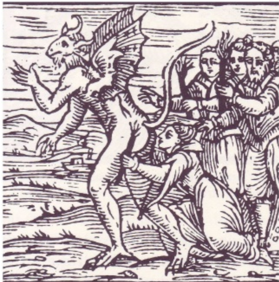
Een heks kust de aars van de duivel "Lech mich am Arsch"

Tot slot is er nog sprake van een zogenaamde broekenduiwel: die droeg een pofbroek!! [om zijn duivelse kenmerken te verhullen?]