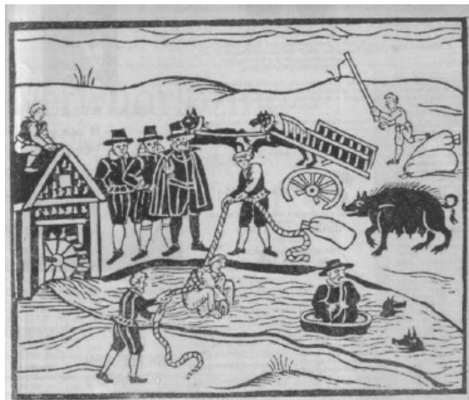
Waterproef met heks vast aan een touw

Tijdens een waterproef bij drie heksen in 1583 in het Duitse Lemgo gaat de zon schijnen terwijl het regent. We zeggen nu nog dat als de zon schijnt tijdens een regenbui dat de duivels dansen in de hel'!