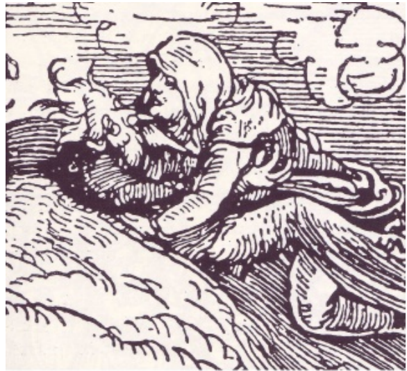
Een heks met haar beest aan het vrijen

een sortilegia : voorspelt de toekomst met gebruik van hulpmiddelen.