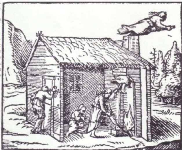
Door de schoorsteen het huis uit

In eerste instantie moest volgens de gangbare ideeën een heks zichzelf met heksenzalf bestrijken. Dan kon ze daarna door de schoorsteen naar de heksenvergadering vliegen. Volgens anderen moest ze de zalf ook op een stok of bezemsteel smeren.