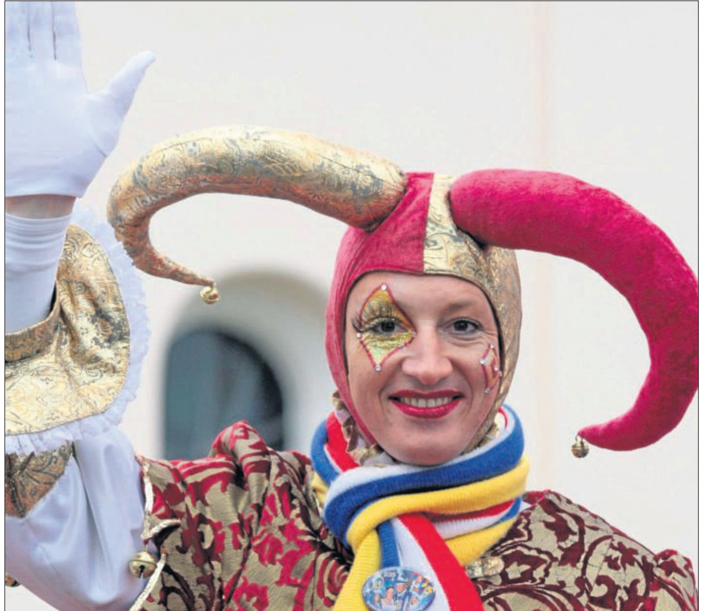
Bald kann's wieder losgehen mit den närrischen Zeiten. Am kommenden Mittwoch ist der Elfte Elfte, bis dahin müssen die Wunschformulare für die Karten zur Galasitzung des Heimatbundes vorliegen und Till rüstet sich schon mal für die Verabschiedung des Prinzenpaares am Mittwoch ab 19.31 Uhr in der Heimatbundhalle.

Tanzgruppen zu bestaunen sein, aber auch das eigene Tanzbein darf gerne geschwungen werden. Kostümierung erwünscht und für Essen und Getränke ist gesorgt.