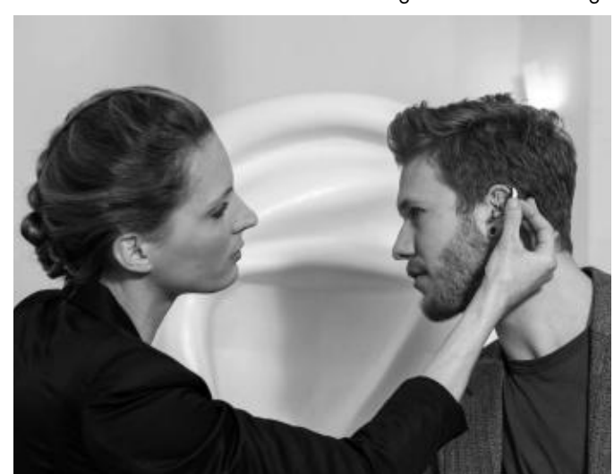
Moderne Hörsysteme vom Hörakustiker: Immer mehr zufriedene Hörgeräteträger hören und verstehen im beruflichen und privaten Alltag wieder besser und nehmen uneingeschränkt am Leben teil.