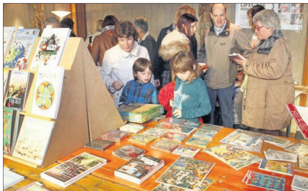
Buchausstellung mit Bücherflohmarkt war nun in St. Marien Seligenstadt in der Unterkirche und auch an diesem Sonntag ist die Ausstellung von 9 bis 13 und von 14 bis 18 Uhr nochmal geöffnet. Dann auch mit Flohmarktcafé und Vorlesestunde für Kinder ab 15 Uhr.

www.adticket.de sowie www.peter-moreno.de oder telefonisch unter 0173 9621463 zum Preis von 20 Euro zuzüglich Gebühren.