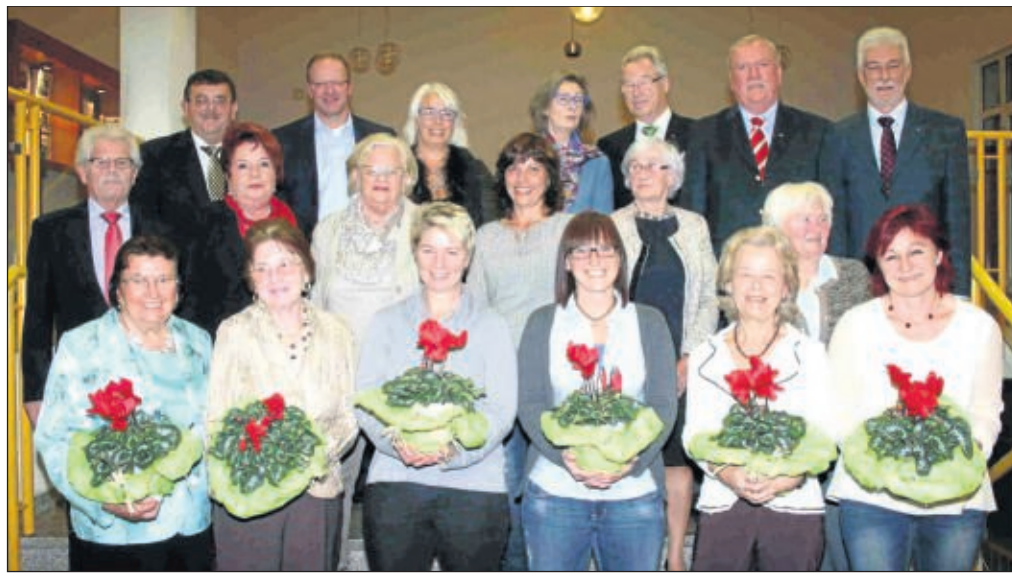
Die Gewinner des Blumenwettbewerbs in Klein-Welzheim erhielten nun kleine Geschenke im Beisein lokaler Prominenz.

Gewinner des Wettbewerbs in Klein-Welzheim ausgezeichnet