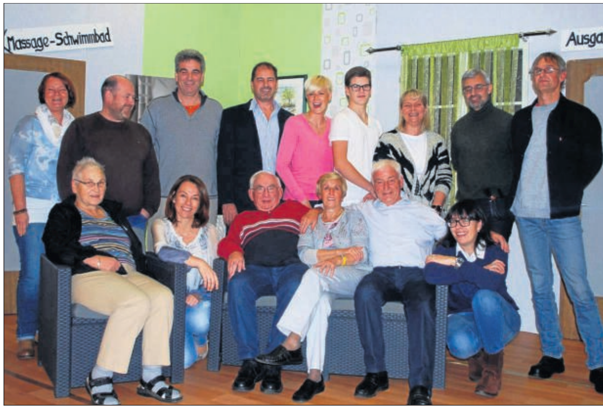
Zur Theateraufführung des Stückes „Grand Malheur“ lädt die Theatergruppe des Mainflinger Sängerbundes für dieses Wochenende ins Bürgerhaus ein.

Karten sind in Mainflingen bei „Medizinische Fußpflege Karin Rosin“ (Haagstraße 2), bei Reinhold Schuck (Brüder-Grimm-Strae 24), „Das Lächsche“ (Ginkgoring 79), „Blumenhaus Junker“ (Hauptstraße 33) sowie in Seligenstadt bei „geschichten*reich“ (ehemals „Bücherwurm“, Aschaffener Straße 27). Der Eintrittspreis kostet im Vorverkauf zehn Euro und an der Abendkasse: zwölf Euro. Kinder bis 14 Jahre bezahlen fünf Euro.