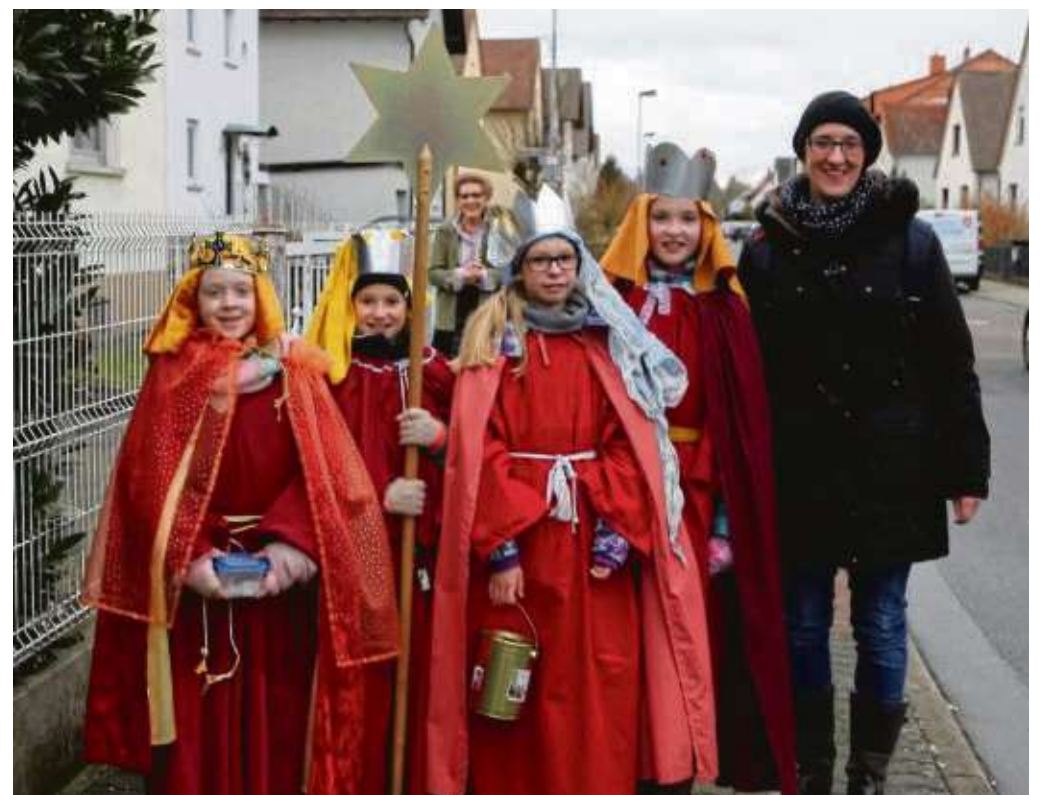
Zahlreiche Kinder und Jugendliche waren dieser Tage als Sternsinger unterwegs beim Dreikönigssingen und sammelte auch für Kinder in Peru.

Doch nicht nur Kinder im Beispielland Peru werden auch zukünftig durch den Einsatz der kleinen und großen Könige in Deutschland unterstützt. Straßenkinder, Flüchtlingskinder, Aids-Waisen, Kindersoldaten, Mädchen und Jungen, die nicht zur Schule gehen können, denen Wasser und Nahrung fehlen - Kinder in mehr als 100 Ländern der Welt werden jedes Jahr in Projekten betreut, die mit Mitteln der Aktion unterstützt >> Über die Aktionen in den Gemeinden berichten wir dann noch im nächsten Heimatblatt.