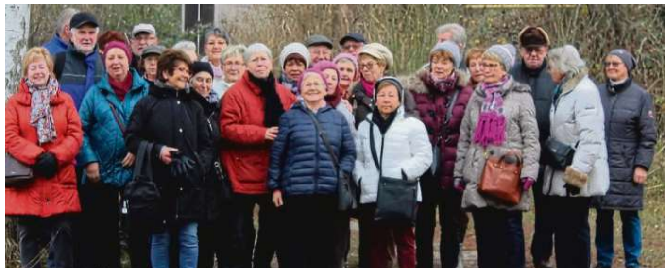
Vorbei an sieben Seen führte die Winterwanderung der Senioreninitiative „Hilfe füreinander“ zum Abschluss des Jahresprogrammes. Bei nebligem, aber trockenem Wetter starteten die Senioren rund um Seligenstadt. Den Abschluss bildete ein gemeinsames Essen in der Gaststätte der TGS.