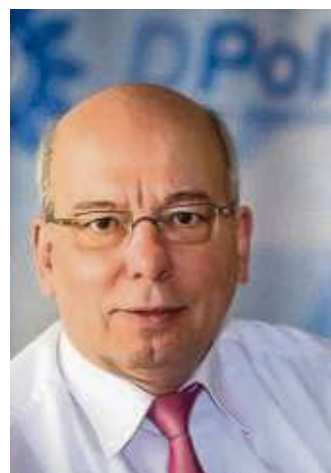
Der Bundesvorsitzende der Deutschen Polizeigewerkschaft (DPoG) Rainer Wendt ist zu Gast in Froschhausen und kommt am 20. Januar auch zum Gewerbeverein Hainburg. Foto: Tomas Moll/privat

Die Weihnachtsbäume werden dieser Tage wieder abgeholt. Die Aktion ist für die Bezirke 1 und 2 am morgigen Donnerstag, 10. Januar, Bezirke 3, 4 und 5 am Freitag, 11. Januar geplant. Um sechs Uhr wird mit dem Einsammeln begonnen. Um unnötige Verzögerungen auszuschließen, sollten die ausgedienten Weihnachtsbäume schon am Vorabend auf dem Bürgersteig bereitgestellt werden. Verspätet herausgestellte Bäume werden nicht mehr berücksichtigt. Text/Foto: znd