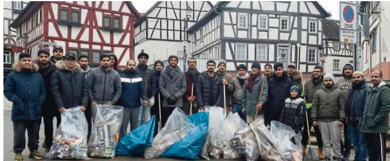
Eine jahrelange Tradition wird fortgesetzt: Wie zu Beginn eines jeden Jahres, trafen sich die Mitglieder der Ahmadiyya Muslim Gemeinde Seligenstadt auch dieses Jahr am 1. Januar zusammen, um als Zeichen der Dankbarkeit und Hilfsbereitschaft den entstandenen Müll der Silvesternacht zu entsorgen. Da sich Müll im Industriegebiet, in der sich die Moschee befindet- in Grenzen hält, ist mit der Stadt eine Fläche am Mainufer abgesprochen, auf welcher man den Reinigungskräften der Stadt unter die Arme greift.