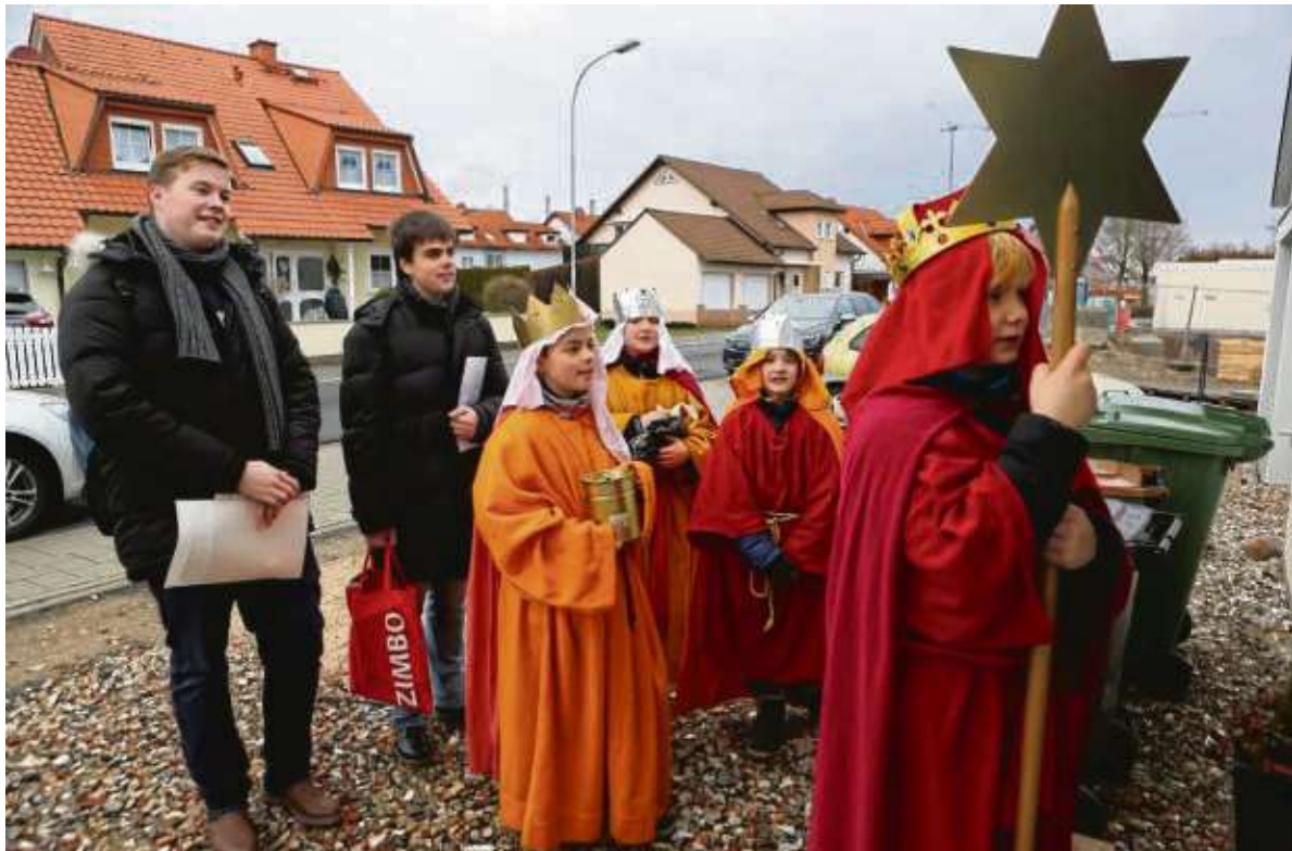
„Wir kommen daher aus dem Morgenland“ sangen die Sternsinger in St. Nikolaus Klein-Krotzenburg und brachten den Neujahrsegen in die Häuser.