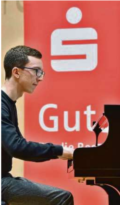
Jona Ditterich der Ludwig van Beethovens „Sonate op. 90 1. Satz“ darbot.