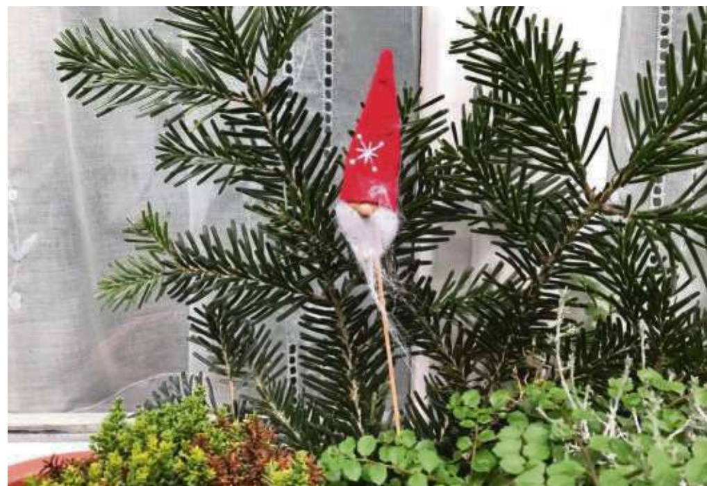
Der letzte Nikolaus kämpft in der Wildnis um das nackte Überleben. Denn schon bald wird man ihn vergessen haben und er verschwindet für eine lange Zeit von der Bildfläche. Stattdessen werden die Straßen bald von Elfen, Einhörnern, Superhelden und anderen Wesen erobert. Text/Foto: znd

cherheitslage und über die deutsche Innenpolitik berichten“, freut sich Lortz. Auch die Mandatsträger der CDU Froschhausen in Stadtverordnetenversammlung und Kreistag stehen an diesem Tag für Fragen und Anregungen zur Verfügung. Auch ein Rahmenprogramm ist wieder vorgesehen.