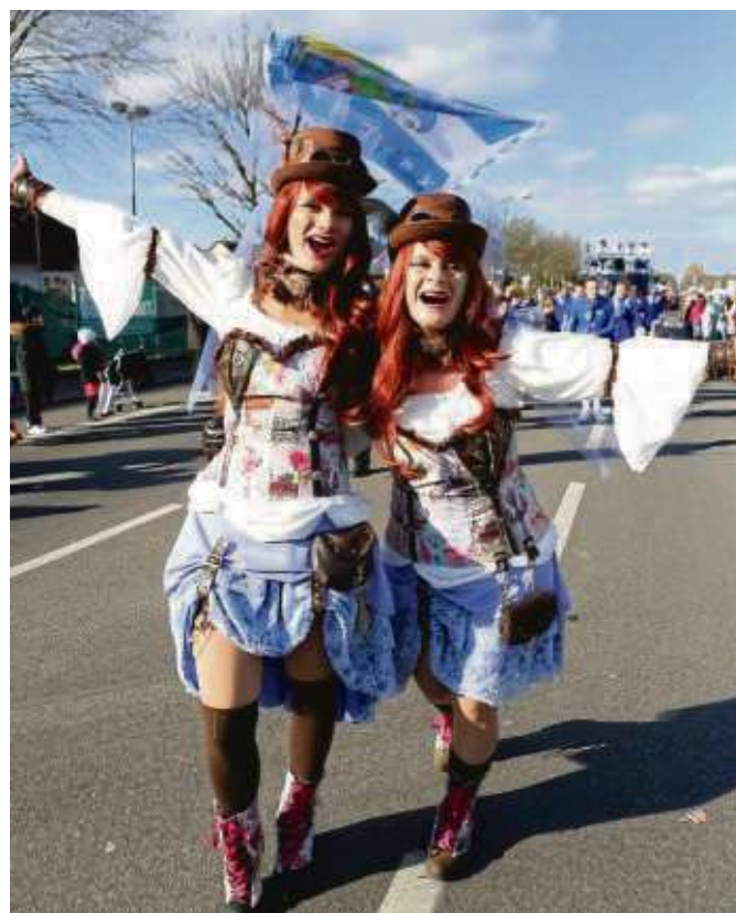
Helau, ihr Narren. Sozusagen schon mal die Vorhut für die Fastnächter, gesehen beim Zug 2018 in Zellhausen.

Ostkreis (beko) - Mit dem Vorstellen des Seligenstädter Prinzenpaares am Freitag, 18. Januar, bei der ersten Galasitzung des Heimatbundes startet nun bald wieder die fünfte Jahreszeit über einen längeren Zeitraum als vergangenes Jahr mit dem abschließenden Seligenstädter Nationalfeiertag Rosenmontag, der am 4. März dann so langsam, aber sicher, in die Fastenzeit überleitet. Doch vor die Straßenfastnacht haben die Götter die Sitzungs-Fastnacht gesetzt und da erwarten die Narren in den Sälen wieder traditionelle Büttreden, Musik und viele Gardetänze bei jeder Menge Humor.