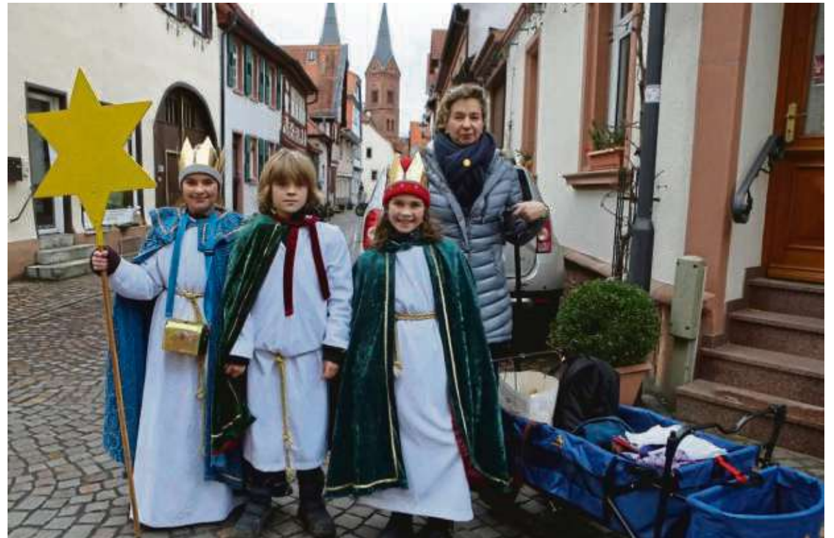
Das Projekt der Sternsinger „Segen bringen- Segen sein: Wir gehören zusammen in Peru und weltweit“ wurde auch in diesem Jahr wieder von der Gemeinde Marcellinus und Petrus Seligenstadt unterstützt.

Große und kleine Könige unterstützen diesmal auch das Beispielland Peru