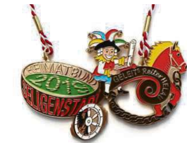
Das ist er, der neue Orden des Heimatbundes für den Rosenmontagszug.

Mehr Informationen zur Fastnacht in Seligenstadt finden Sie unter www.heimatbund-seligenstadt.de oder in Facebook.