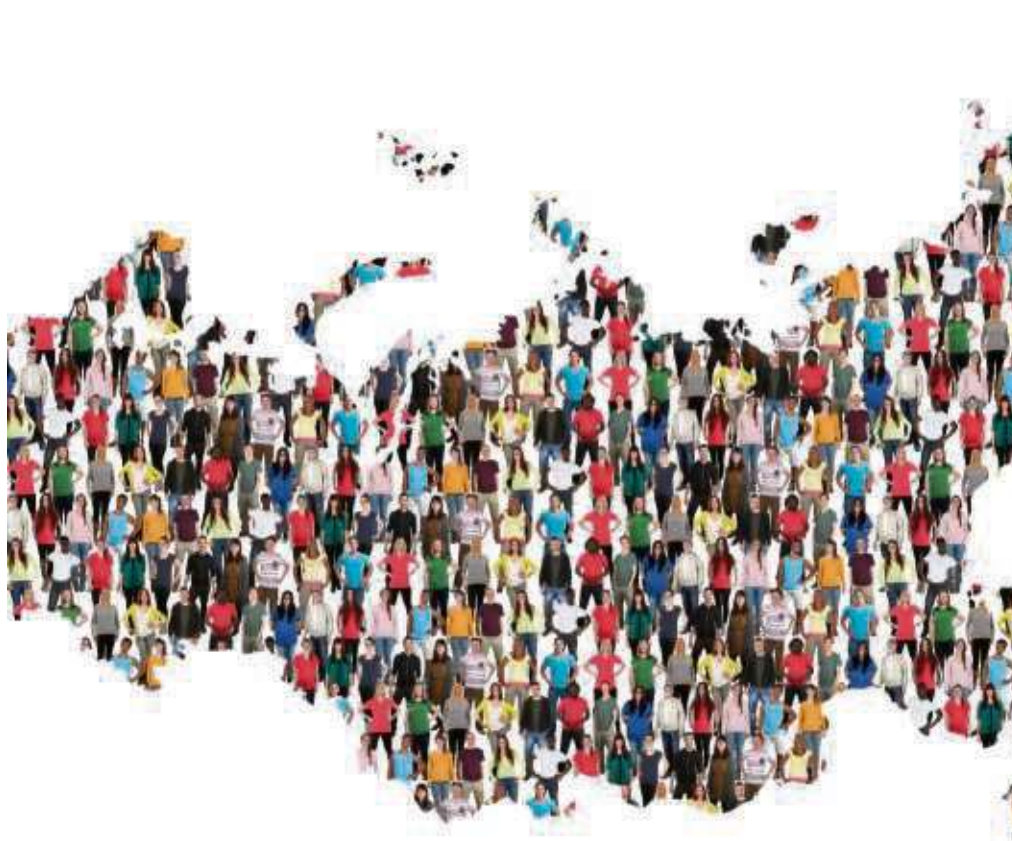
In nahezu allen Ländern der Welt wird die Gesellschaft von einer enormen Sprachenvielfalt geprägt. Die Globalisierung macht sich bemerkbar.

>> Mit der neuen Rubrik „Worte, die verbinden“ will die Redaktion wöchentlich Leser aller Nationalitäten ansprechen und aufzeigen, dass wir trotz aller Unterschiede doch alle gleich sind.