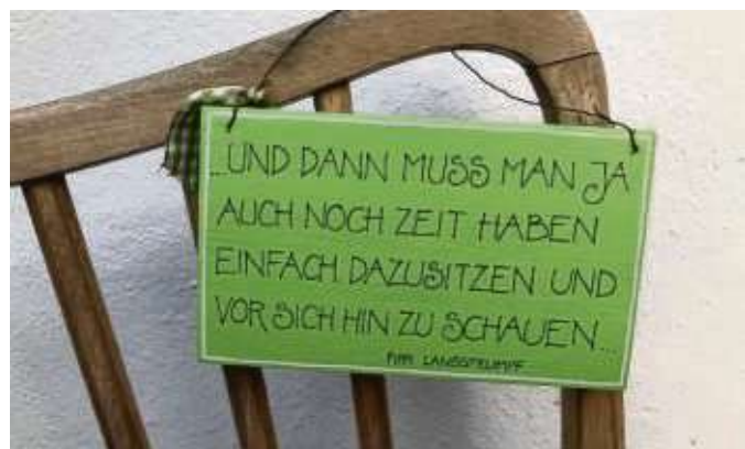
Wer kennt das nicht? Man hat zwar viel zu tun, doch am Ende des Tages bleibt doch vieles liegen...

ca). So war sein Walzer As-Dur op. 39 ein passendes Silvesterstück. Sakralfeierlich getragenen dagegen das „Prayer of Saint Gregory“ für Orgel und Trompete des amerikanischen Komponisten armenisch-schottischer Abkunft Alan Hovhaness (1911-2000). Und was wäre ein solcher Abend ohne Georg Friedrich Händel. Das berühmte „Largo“ aus der Oper „Xerxes prägte ein vielfältiges Programm mit Großer Beifall für eine Darbietung, die sich würdig in die Reihe der Silvester-Klosterkonzerte einreicht hat.