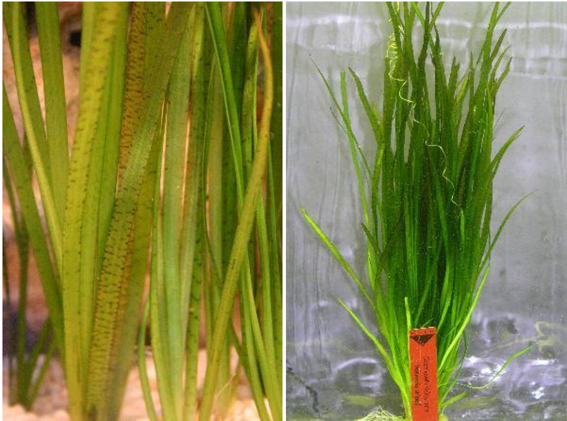
Vallisneria nana „Striped“ von Gula

Informationen und Angebote aus dem heimbiotop-onlineshop