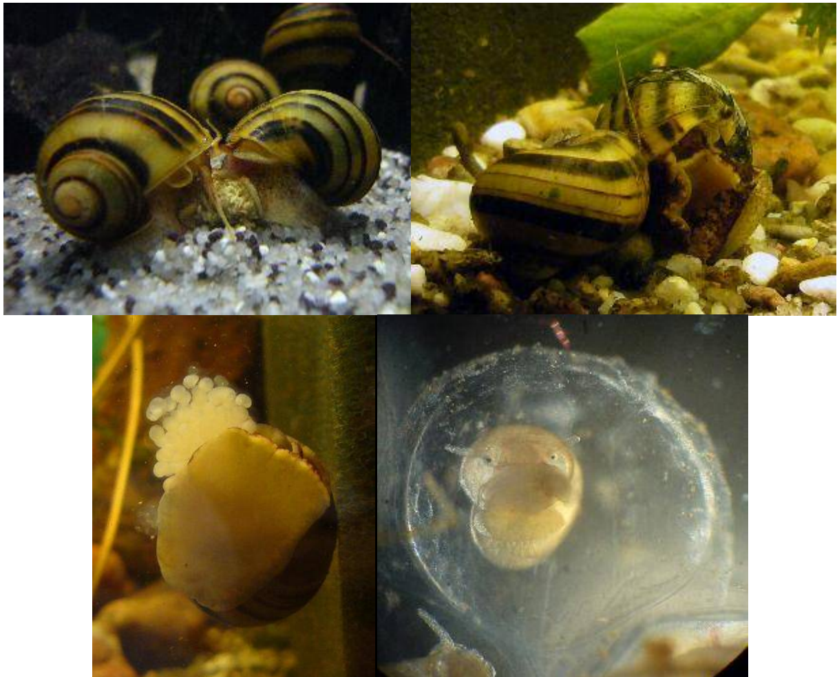
Asolene spixi beim Fressen, eine Paarung, ein Weibchen bei der Eiablage und ein Jungtier im Ei.

Die Zebra-Apfelschnecke ist bereits seit vielen Jahren immer wieder mal in Aquarien zu finden. Da sich die Tiere aber nicht so rasant vermehren wie die weit bekannteren Pomacea -Arten, sind sie immer selten gewesen und nicht so weit verbreitet.