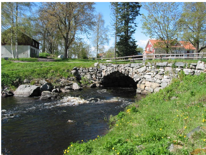
Grängshytteforsarna ligger i gammal bergsmansbygd.

Grängshytteforsarna har, näst efter Järleån, länets längsta forssträckor. Här tar Rastälven fart och bildar en tre kilometer lång forssträcka innan den åter lugnar sig.