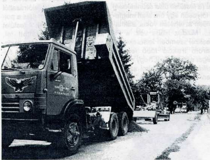
Kavicsolás az Akácfa utcában