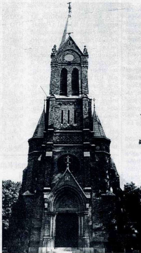
A mátyásföldi Római Katolikus Templom a Pilóta utca és a Prodám utca találkozásánál