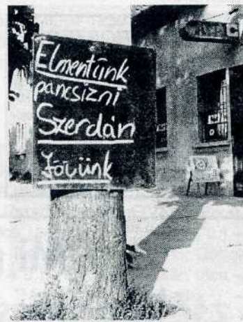
Kánikula a Rákosi úton

Más. Megyek a Daciával, tetején negyed tonna betonvas. Míg várakozom a piros lámpánál, a relativitás-elméleten töprengök. Ha ugyanis ezt a betonvasat egycentis darabokra vágnák, és rám lőnének vele, akkor bizonyára nagyon soknak tűnne. De ha arra gondolok, hogy mibe került és éppen elég a koszorúba, akkor szinte kevés... (F)