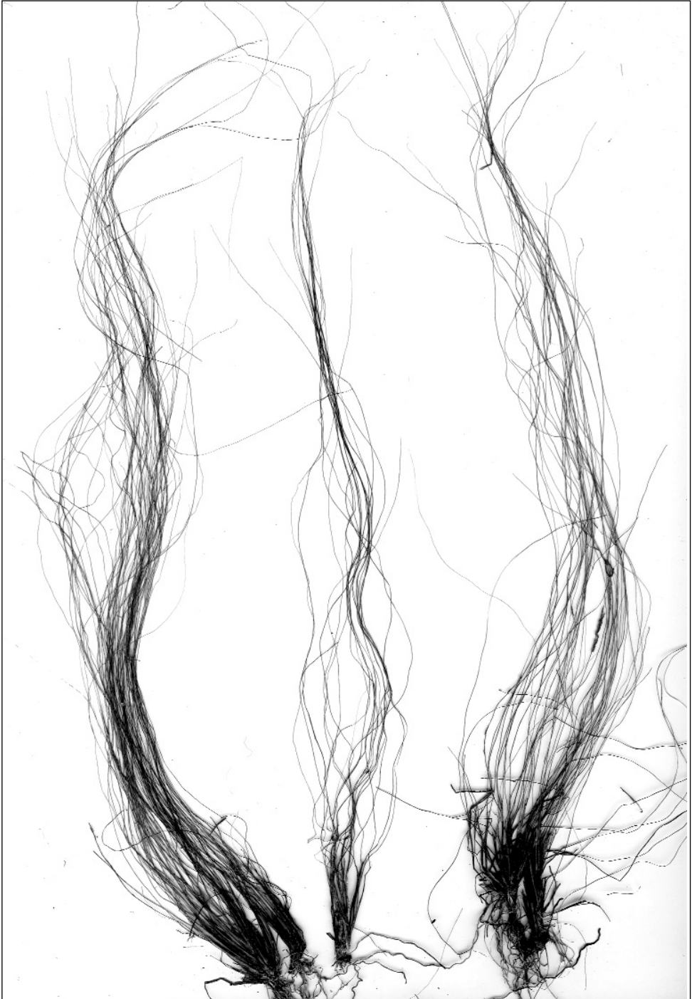
Fig. 2. Eleocharis multicaulis (Sm.) Sm., forme submergée, rio de s'Éleme.