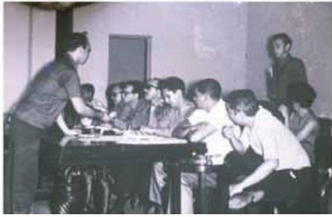
Reunión del Movimiento 14 de Junio, 1962.

La oposición del Movimiento Revolucionario 14 de Junio (1J4), y del Partido Revolucionario Dominicano (PRD), en contra del Consejo de Estado, junto a los acontecimientos del 16 de enero, generaron la continuación de los enfrentamientos violentos que devinieron en un auto golpe de Estado que llevó al poder a una Junta Cívico Militar encabezada por Huberto Bogaert. La reacción contra el auto-golpe se produjo el 18 de enero de 1962 cuando un grupo de oficiales apresó a Rafael Rodríguez Echevarría. Una