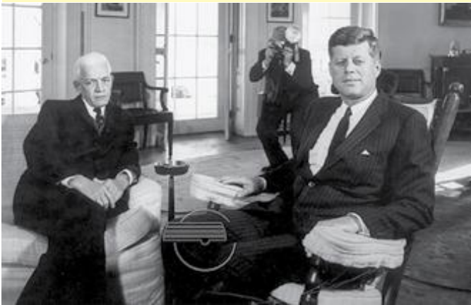
Juan Bosch (1909 - 2001) y John F. Kennedy (1917 - 1963), reunidos en 1962.

Otro elemento para tener en cuenta en la caída de Bosch fue la crisis con el Gobierno haitiano. En esta influyeron las operaciones militares encubiertas del personal de la Embajada Estados Unidos en el país (MAAG), para deponer la dictadura de Francois Duvalier. Dichas acciones eran desconocidas por el presidente Bosch y contaban con la anuencia de la administración Kennedy.