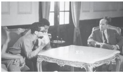
Héctor García Godoy (1921 - 1970).

Los esfuerzos para buscar una salida negociada al conflicto se intensificaron a partir del mes de junio, y se inició un largo e intenso proceso de negociación entre una misión de la OEA, encabezada por el embajador estadounidense Ellsworth Bunker y el Gobierno Constitucionalista. La propuesta fundamental consistía en la designación de un gobierno provisional, cuya misión sería crear las condiciones favorables para preparar las elecciones de junio de 1966.