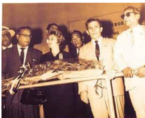
Comisión del PRD que recibió a Juan Bosch luego de la muerte de Rafael L. Trujillo en 1961. Tomado de internet.