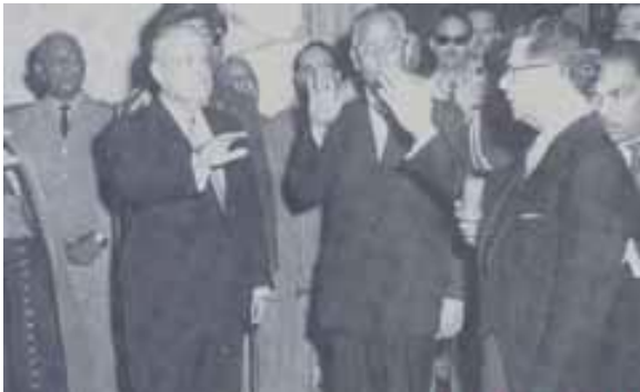
Juramentación del Consejo de Estado, 1962.

El 30 de diciembre de 1961, previa modificación de la constitución, se constituyó un gobierno denominado Consejo de Estado bajo los auspicios de la administración del presidente John F. Kennedy. El presidente Joaquín Balaguer designó los demás integrantes del gobierno colegiado conformado por Rafael F. Bonnelly, vicepresidente, Eduardo Read Barreras, Nicolás Pichardo, Monseñor Eliseo Pérez Sánchez, Luis Amiama Tió y Antonio Imbert Barreras. El origen social de los