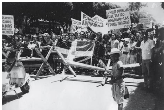
Mujeres manifestándose en contra de la segunda ocupación militar estadounidense en 1965.

Una recomposición del cuadro político y militar fue impuesta en lo inmediato por la fuerza de ocupación. Se dividió la ciudad de Santo Domingo en dos partes, con la excusa de un cordón de seguridad. El objetivo era de confinar y aislar a los rebeldes constitucionalistas en Ciudad Nueva y la Zona Colonial en un reducido espacio de 14 cuadras. De esta manera se trataba de evitar la extensión o generalización de las acciones militares a otros espacios del territorio nacional.