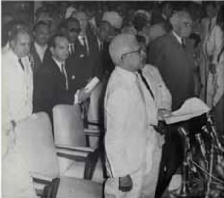
Discurso de toma de posesión de Juan Bosch, 1963.

Juan Bosch asumió la presidencia el 27 de febrero de 1963 y a su juramentación asistieron connotadas personalidades de relieve continental, incluyendo el vicepresidente de Estados Unidos Lyndon B. Johnson.