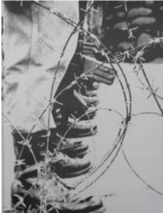
Botas de Marines estadounidenses, 1965.

de la propia OEA. Con las honrosas excepciones de México, Perú, Venezuela, Ecuador y Uruguay que se opusieron a que sus tropas participaran en la violación de la soberanía dominicana, los demás países aceptaron formar parte de la FIP. Se organizó un gobierno bajo la protección de esta fuerza que se llamó de Reconstrucción Nacional y estaba presidido por Antonio Imbert Barrera.