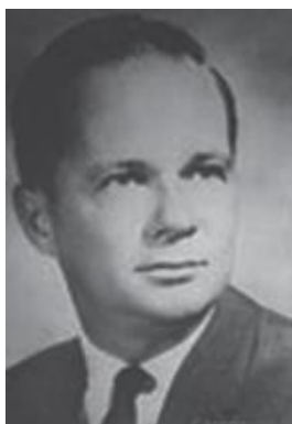
Donald Reid Cabral (1923-2006).

La renuncia de Emilio de los Santos permitió la entrada de Donald Reid Cabral. Para los primeros meses de 1964 el Triunvirato como tal, se había diluido, pues Emilio de los Santos había renunciado y las intenciones y acciones de Reid Cabral de fortalecerse y permanecer en el cargo forzó la renuncia de los otros dos miembros, Ramón Tapia Espinal y Manuel Tavares Espaillat. Al final del período, el Triunvirato quedó solamente con dos miembros, Donald Reid Cabral y Ramón Cáceres Troncoso.