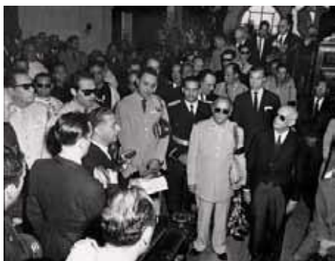
Joaquín Balaguer leyendo el panegírico de Rafael L. Trujillo.

Desaparecido físicamente el tirano Trujillo, se configuró un escenario político caracterizado por el activismo de diversas fuerzas políticas procurando asumir el control del proceso de transición o apertura democrática en la República Dominicana. El propósito común de estas diversas fuerzas, las hizo actuar de manera conjunta contra los remanentes del trujillismo en principio, pero su carácter heterogéneo y policlasista generó divergencias y fisuras en el movimiento social que emergió de la necesidad de destrujillización de la sociedad dominicana en 1961.