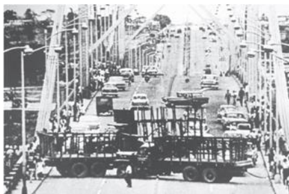
Batalla del puente Duarte del 25 de abril de 1965.

La oposición a los aprestos de los constitucionalistas vendría del clan militar de San Isidro y su líder Elías Wessin y Wessin, grupo que controlaba la Fuerza Área Dominicana (FAD) y el Centro de Enseñanza de las Fuerzas Armadas (CEFA). La Marina de Guerra mantuvo una posición neutral, pero luego apoyó al clan militar de San Isidro. Sin embargo, la unidad élite de los Hombres Rana apoyó a los constitucionalistas. La Policía Nacional se suscribió al sector conservador opuesto al retorno de Bosch.