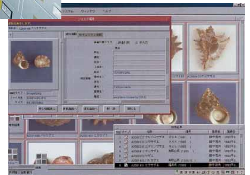
データベース検索画面