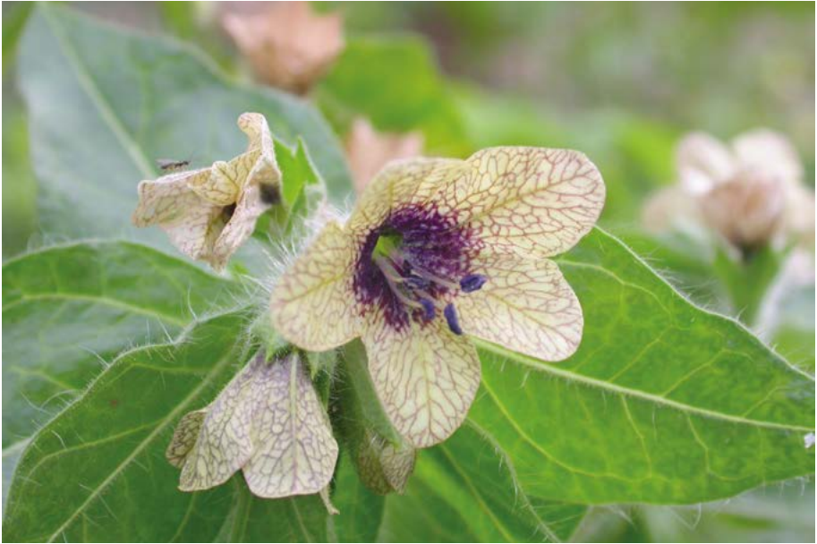
Abb. 26: Das Schwarze Bilsenkraut ( Hyoscyamus niger ) tritt gelegentlich auf Baustellen nach Erdarbeiten auf, z. B. am Rebstockgelände in Frankfurt.

Hyoscyamus niger : In der Region Südost sind Funde nur aus dem 19. Jahrhundert bekannt. Die Pflanze verfügt über eine langjährige Samenbank. In der Region Südwest stehen Neufunde in der Regel im Zusammenhang mit Erdarbeiten (Abb. 26).