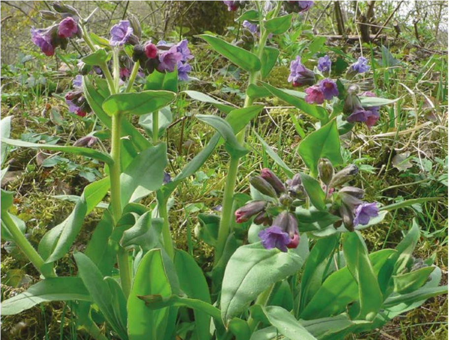
Abb. 31: Weiches Lungenkraut ( Pulmonaria mollis ) im oberen Orbtal südöstlich von Bad Orb.

Pulmonaria mollis : Die Pflanze wächst in dem Garten bei Bad Orb, in den sie nach dem Krieg aus einer nahe gelegenen Hecke geholt wurde, gleichsam wild (Gregor 1998). 2015 wurden von dort durch H. Zeh und K. Hemm fünf Pflanzen ausgegraben und auf einer 250 m entfernten städtischen Fläche eingesetzt. Vorher wurde bereits eine Vermehrungskultur im Botanischen Garten Frankfurt angelegt. Aus dieser Kultur haben H. Zeh und K. Hemm 2015 nochmal sechs Pflanzen auf der Wiederansiedlungsfläche ausgebracht (Abb. 31).