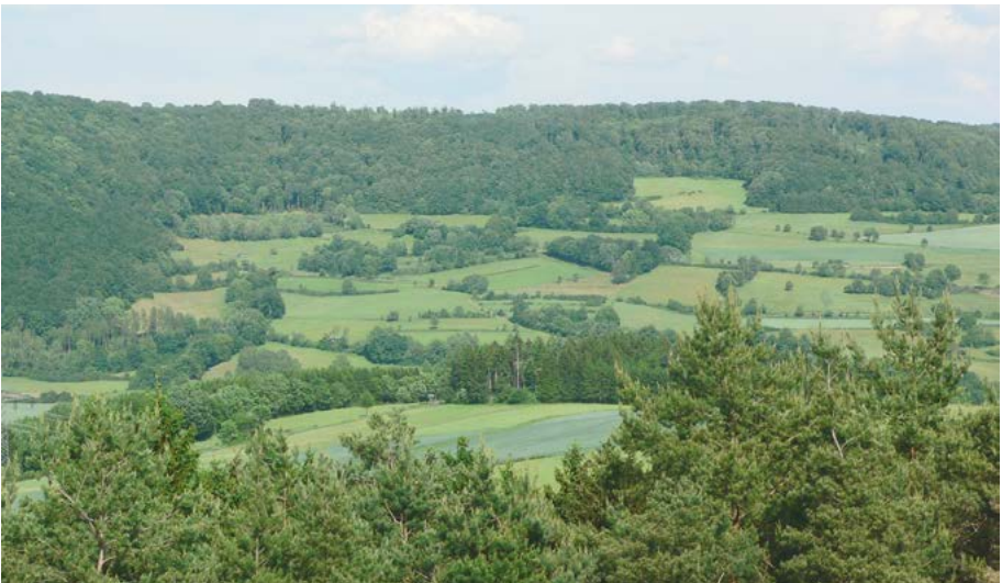
Abb. 6: Vielfältiges Hessen: Reich gegliederte Kulturlandschaft vor bewaldetem Bergrücken im Sinngrund, Region Südost.