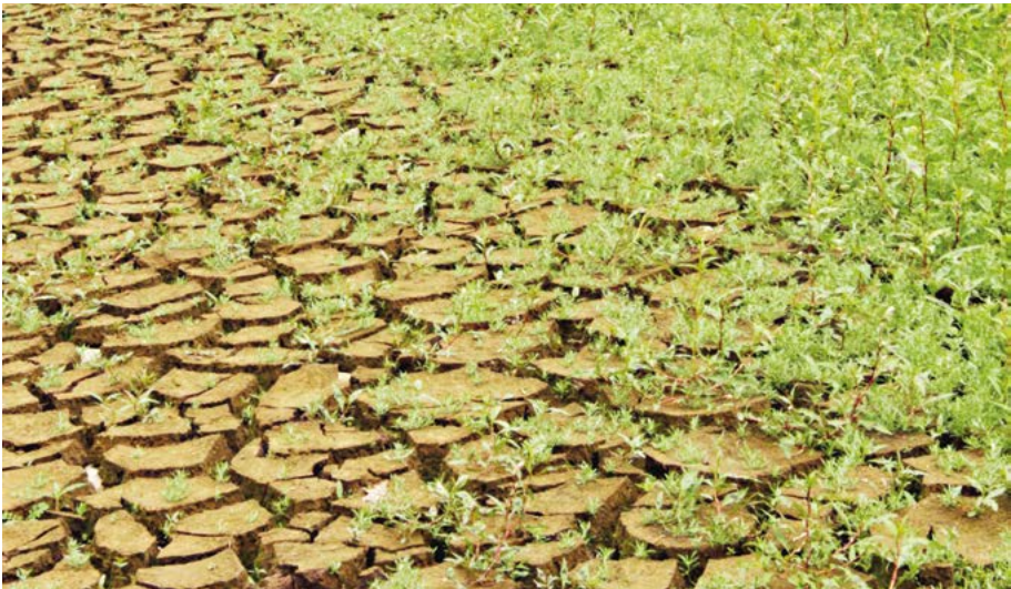
Abb. 4: Vielfältiges Hessen: An Hessens größtem Stausee, dem Edersee in der Region Nordwest, entwickeln sich in trockenen Jahren ausgedehnte Schlammlfluren.