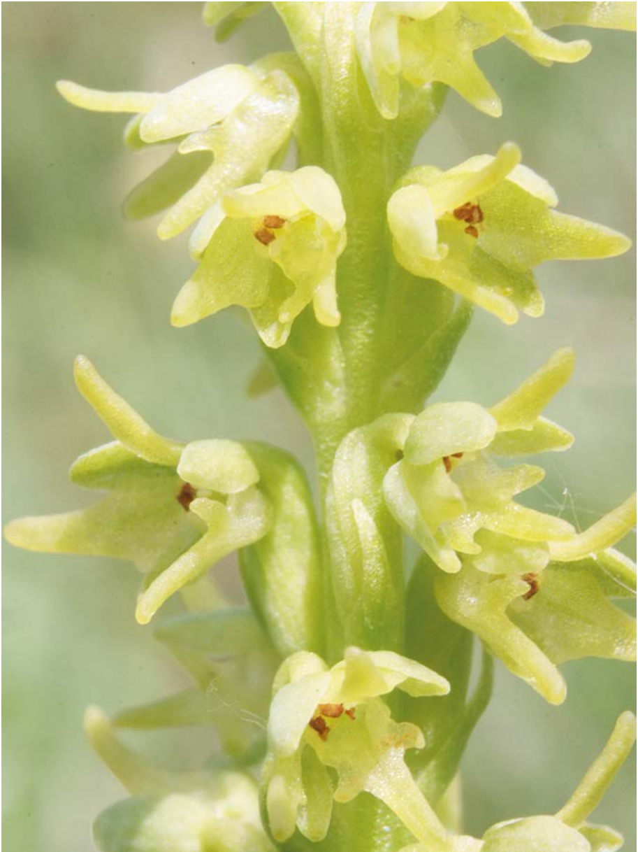
Abb. 25: Die Einknollige Honigorchis ( Herminium monorchis ) gehört zu Hessens seltensten Orchideen.