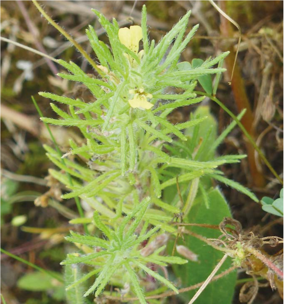
Abb. 17: Der Gelbe Günsel ( Ajuga chamaepitys ) kommt in der Region Südwest auch auf Ruderalstandorten vor.

Ajuga chamaepitys : In der Region Südwest auch ruderal auf Steingrus, Sand etc. (Abb. 17), seit Kurzem besteht in Darmstadt-Eberstadt in einem Garten ein Massenbestand.