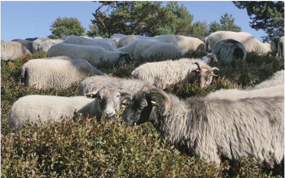
Abb. 38: Im 19. und insbesondere im Laufe des 20. Jahrhunderts wurden traditionelle Formen der Bewirtschaftung großflächig aufgegeben. Die Beweidung einer Bergheide mit Schafen bei Usseln stellt heutzutage eine Ausnahme dar. © R. Kubosch, 2018

Die Gründe für das Aussterben und die Gefährdung von Arten in Hessen wurden in den letzten Jahren sowohl im städtischen (Gregor & al. 2012) als auch im ländlichen Raum (Gregor & al. 2016) intensiv untersucht. Sie kommen übereinstimmend zu dem Ergebnis, dass der Landnutzungswandel ursächlich für diese Veränderungen ist (Abb. 38–39). Auch eine Modellierung der Verbreitung von 65 gefährdeten hessischen Pflanzenarten unter verschiedenen Klimawandel-szenarien bezeugt, dass die Landnutzung das wichtigste Kriterium für die Verbreitung von Pflanzenarten ist (Müller & al. 2014). Besonders massiv haben sich die Veränderungen in der Landwirtschaft ausgewirkt: Die Aufgabe von Grenzertragsstandorten, die verbesserte Saatgutreinigung, der Einsatz synthetischer Düngemittel und Herbizide, die engeren Reihen, die Aufgabe des Anbaus bestimmter Feldfrüchte wie Lein und weitere Veränderungen in der Fruchtfolge und Bewirtschaftung hatten weitreichende Folgen für die Ackerbegleitflora (Abb. 40–41). Auch die Aufgabe der Waldweide, die Melioration oder Aufgabe der Feuchtwiesen und die veränderte Grünlandbewirtschaftung insgesamt