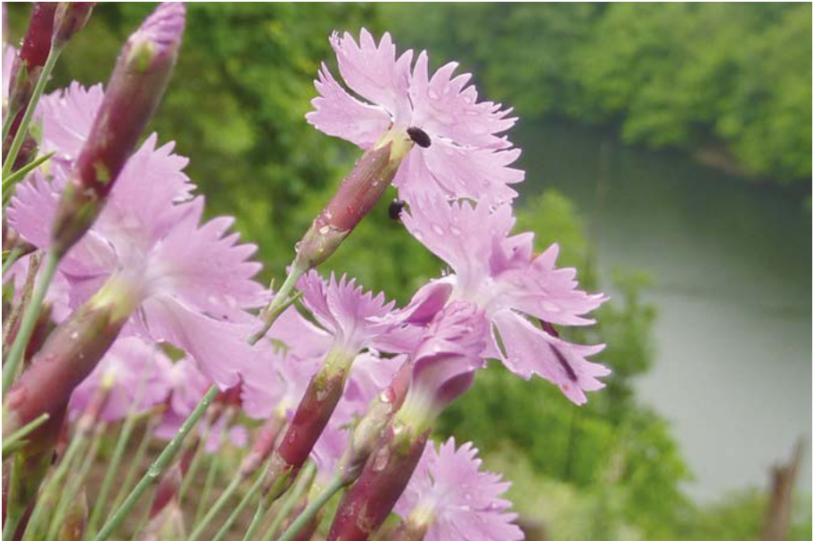
Abb. 14: Für die Pfingst-Nelke ( Dianthus gratianopolitanus ) trägt Deutschland eine besonders hohe Verantwortung, denn das Aussterben in Deutschland hätte gravierende Folgen für die Gesamtpopulation.