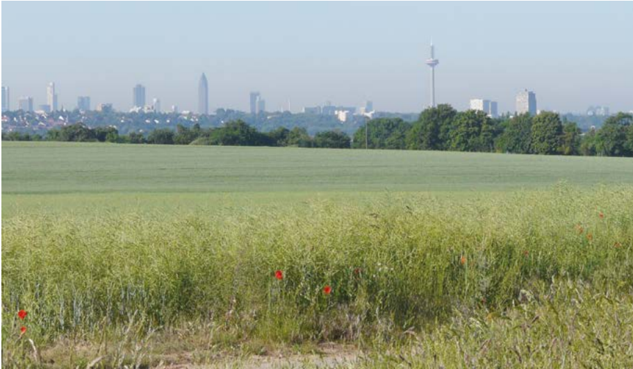
Abb. 3: Vielfältiges Hessen: Die Region Südwest ist geprägt durch die Metropolregion Frankfurt-Rhein-Main. Hier wird das Landschaftsbild zumeist von Siedlungsflächen und landwirtschaftlichen Nutzflächen geprägt, wie hier in Frankfurt am Main.