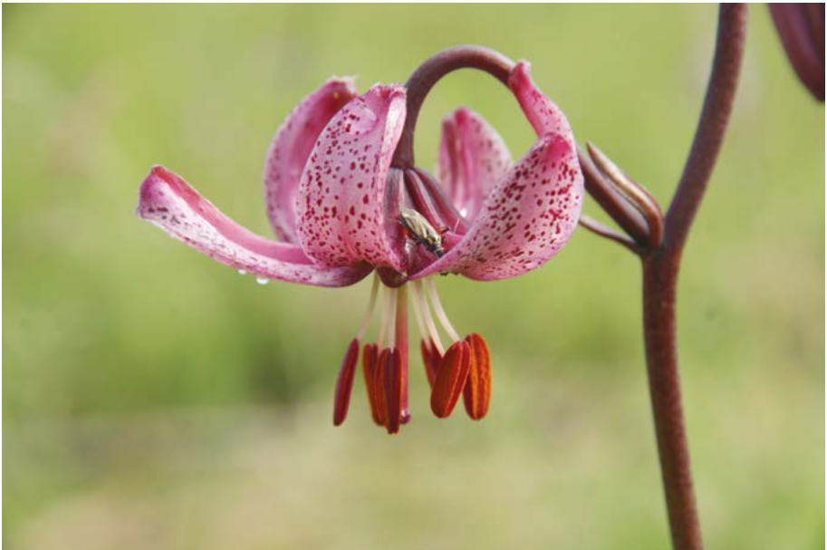
Abb. 49: Die Türkenbund-Lilie ( Lilium martagon ) gilt zwar hessenweit als ungefährdet, in einigen Regionen ist die Pflanze aber selten und rückläufig. © K. Böger, 2012