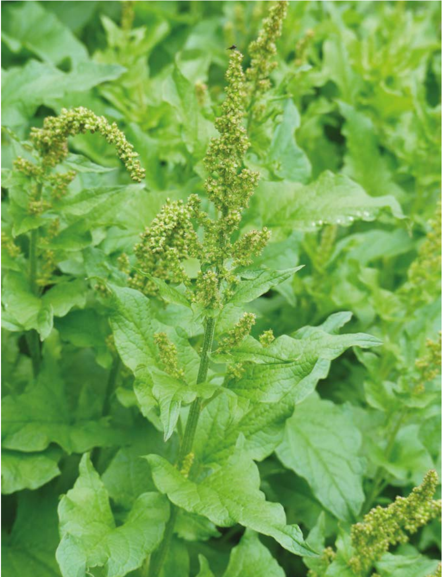
Abb. 42: Der Gute Heinrich ( Chenopodium bonus-henricus ) gehört zu den traditionellen Dorfpflanzen, die in den Dörfern des 21. Jahrhunderts kaum noch Vorkommensmöglichkeiten finden.