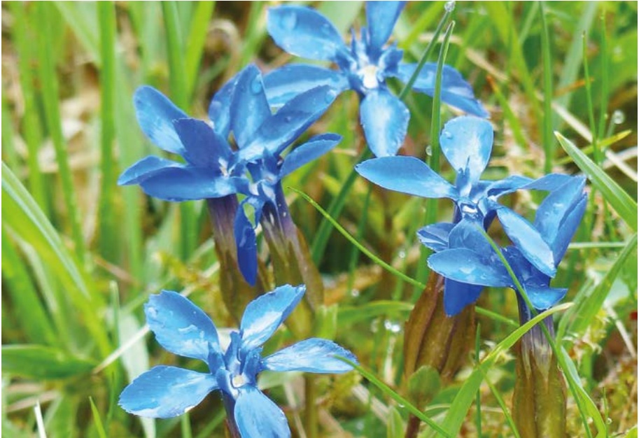
Abb. 24: In Hessen besteht kein Vorkommen des Frühlings-Enzians ( Gentiana verna ) mehr. Die attraktive Pflanze wächst jedoch noch im benachbarten Thüringen, z. B. im NSG „Röthengrund“.

Geranium aequale : Die Verbreitung in Hessen ist nicht bekannt. Es liegt ein Fund aus Frankfurt vor (Gregor 2008).