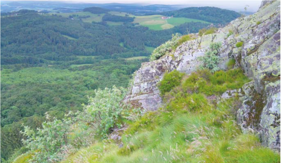
Abb. 5: Vielfältiges Hessen: In der Region Nordost sind auf der Milseburg, einem über 835 m hohen Berg der hessischen Rhön, noch natürliche Felsheide-Felsbusch-Komplexe zu finden.