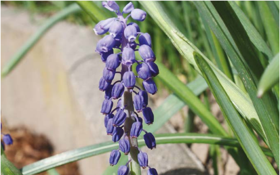
Abb. 50: Die Kleine Traubenhyazinthe ( Muscari botryoides ) gilt in Hessen als Neophyt, ist aber dennoch gemäß gesetzlicher Verordnungen besonders geschützt. Hessische Vorkommen stehen in der Regel in Zusammenhang mit Gärten, wo sich die Art sogar in Grabeland halten kann.

Andererseits sind 30 eingebürgerte oder in Einbürgerung begriffene Neophyten durch die Bundesartenschutzverordnung geschützt (Abb. 50, Dianthus giganteus gehört zu beiden Gruppen). Weitere 8 Arten, die in Hessen als Neophyten bewertet werden, gelten als deutsche Verantwortungsarten, bei einer Art handelt es sich um eine Hessen-Art.