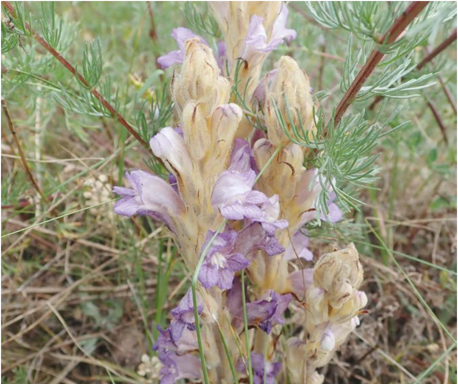
Abb. 47: Die Sand-Sommerwurz ( Orobanche arenaria ), hier von der Griesheimer Düne, konnte von der Roten-Liste-Kategorie 2 in die Kategorie 3 überführt werden.

138 Sippen gelten hessenweit als stark gefährdet. Aufgrund der unter Kategorie 1 beschriebenen Beobachtung, dass Sippen „rechnerisch“ früher in Kategorie 1 eingestuft werden als nach Experteneinschätzung, war zu erwarten, dass es zu einem deutlichen Rückgang in der Gefährdungskategorie 2 kommen würde. 24 Sippen müssten der Kategorie 2 fehlen, wenn es sich um ein rein methodisches Phänomen handeln würde, also Arten aus methodischen Gründen von 2 nach 1 hoch gestuft worden wären. Tatsächlich wurden in der letzten Auflage 153, abzüglich eingestufte Neophyten 151 Sippen für Kategorie 2 angegeben.