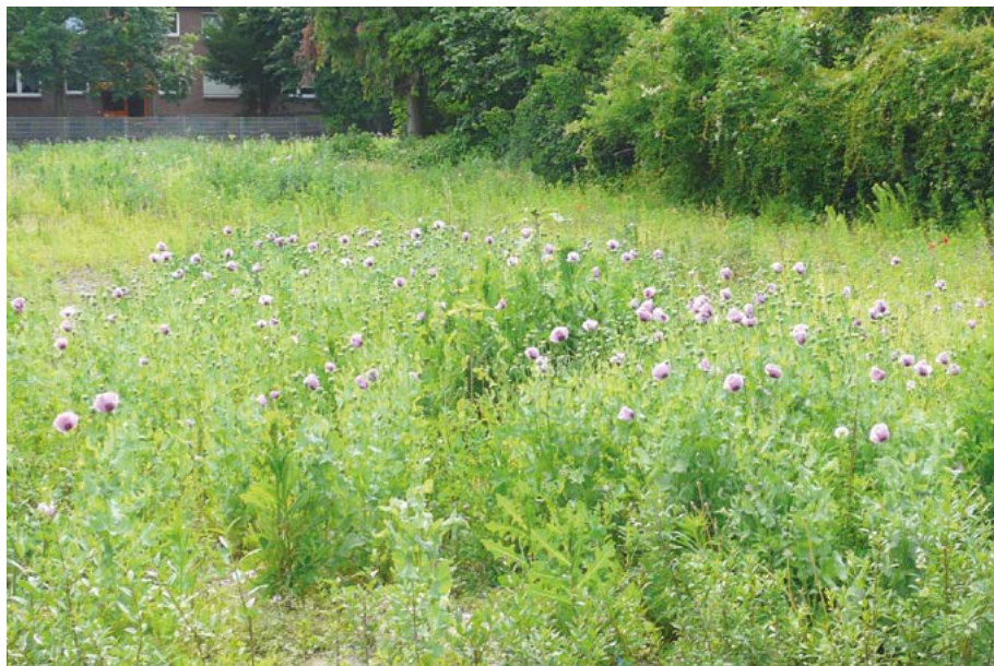
Abb. 29: Nach Abriss eines Hauses in Frankfurt-Untertliederbach blühte reichlich Schlaf-Mohn ( Papaver somniferum ) auf der Fläche.

Papaver somniferum : Die Art ist für ihre extrem lange Keimfähigkeit bekannt. So kann es nach dem Abriss von Gebäuden oder anderen Bauarbeiten zu kurzfristigem Massenaufreten der Art kommen (Abb. 29). Obwohl der Anbau offiziell genehmigungspflichtig ist, wird die Art als Zierpflanze in vielen Gärten kultiviert.