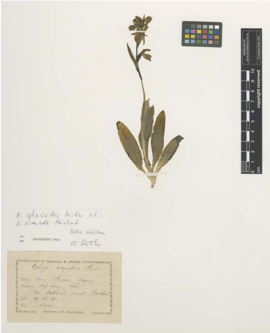
Abb. 8: Herbarbelege sind die wichtigste Quelle um die langfristige Bestandsentwicklung zu untersuchen. Die Bestimmung kann darauf heute noch überprüft und gegebenenfalls revidiert werden. Sie können zudem das ehemalige Vorkommen heute ausgestorbener Arten wie der Kleinen Spinnen-Ragwurz ( Ophrys araneola ) dokumentieren. M. Dürer, 1885 bei (Frankfurt-)Seckbach.