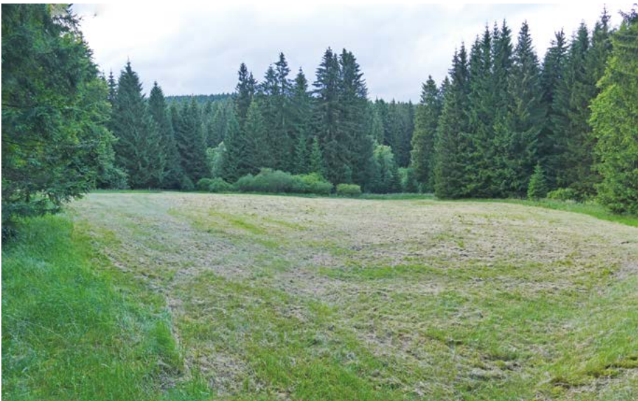
Abb. 39: Mulchmähd wird heute häufig als kostengünstige Alternative zu Beweidung durchgeführt, z. B. im NSG und FFH-Gebiet „Alter Hagen“. Dies hat jedoch große Auswirkungen auf die Zusammensetzung der Vegetation.

wirken sich gravierend auf die hessische Flora aus. Die Begradigung und Befestigung der Flussufer, lokal auch die Absenkung des Grundwasserspiegels und der Ausbau der Dörfer mit befestigten Straßen (Abb. 42) und nahezu ohne freilaufendes Vieh sind weitere Gründe, die zum Verlust oder Rückgang von Arten führten. Ein Großteil des Rückgangs erfolgte bereits im Verlauf des 20. Jahrhunderts als sich die veränderte Landnutzung großflächig durchsetzte. Die Zahl der als hessenweit ausgestorben oder verschollen geltenden Sippen war zum Ende des 20. Jahrhunderts (Buttler & al. 1997) bereits auf demselben Niveau wie heute. Im letzten Jahrzehnt wurde von den Bearbeitern insbesondere eine Verschlechterung der Bedingungen für Arten des Grünlandes beobachtet. Viele dieser Arten gelten immer noch als häufig oder mäßig häufig und erreichen nach formalen Gesichtspunkten oft noch keine Gefährdungskategorie. Dennoch sind sie seltener geworden. Damit sie nicht die Rote-Liste-Arten von morgen werden, sollte der Grünlandbewirtschaftung in den nächsten Jahren besondere Aufmerksamkeit geschenkt werden.