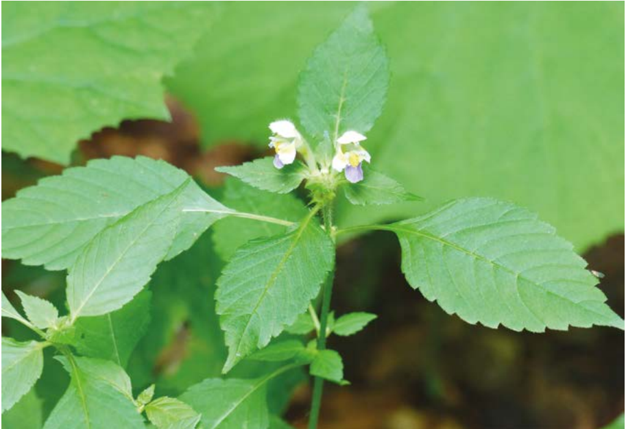
Abb. 23: Das Vorkommen des Bunten Hohlzahns ( Galeopsis speciosa ) in der Region Südwest wird nur als unbeständig bewertet. © D. Bönsel, 2014

Galium parisiense : Im 19. Jahrhundert aus den Regionen Südwest und Südost gut dokumentiert, jedoch bis zum Ende des Jahrhunderts erloschen. In den anderen Landesteilen vermutlich stets nur unbeständig. Jüngere Funde von Bönsel (2002 & 2012) im Bereich des Frankfurter Kreuzes sowie südlich davon an einem Forstweg entlang der ICE-Strecke wurden als Neueinschleppungen eingestuft und nicht bewertet.