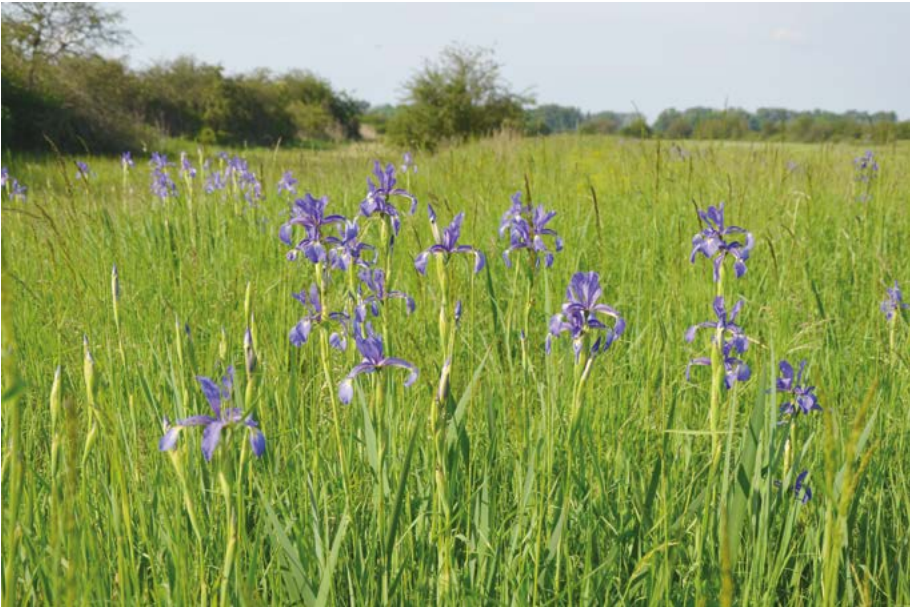
Abb. 11: Die Wiesen-Schwertlilie ( Iris spuria ) hat ein sehr begrenztes hessisches Areal in der Oberrheinebene um Trebur.

Zu der Kategorie werden Arten gerechnet, deren hessische Vorkommen einen wichtigen Anteil des deutschen Gesamtbestandes ausmachen und die in Deutschland als gefährdet angesehen werden (siehe Buttler & al. 1997 mit näheren Erläuterungen). Bis auf Iris spuria („vulnerable“ in Europa 1 , Abb. 11) gelten alle nachfolgend genannten Arten in Bezug auf ihr Gesamtareal als ungefährdet.