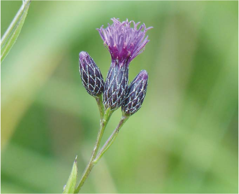
Abb. 13: Die Färber-Scharte ( Serratula tinctoria ) ist eine „Hessen-Art“. Für sie besteht nach dem Bundesnaturschutzgesetz kein besonderer Schutz, aber es wird besonderer Handlungsbedarf für den Erhalt dieser Art gesehen.