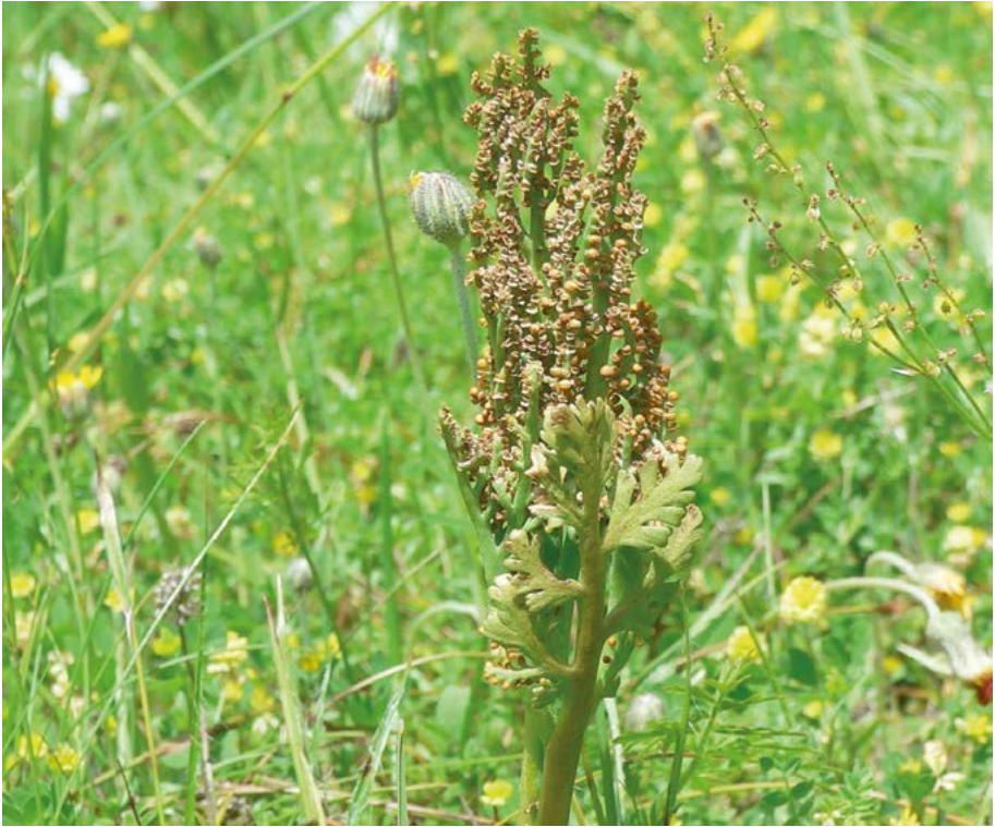
Abb. 19: Der vom Aussterben bedrohte Ästige Rautenfarn ( Botrychium matricariifolium ) hat auf dem Stacken-Berg bei Mernes (Spessart) seinen letzten hessischen Fundort.

Bromus racemosus : Um Gießen und auch im Kinzigtal viele Vorkommen (A. Händler bzw. M. Uebeler).