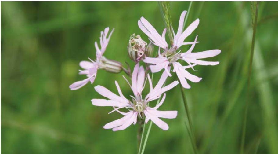
Abb. 10: Noch gilt die Kuckucks-Lichtnelke ( Lychnis flos-cuculi ) als häufige, weit verbreitete Art. Wie andere Arten des Grünlands ist sie von einem Bestandsrückgang betroffen, der bislang jedoch noch nicht zur Einstufung in eine Rote-Liste-Kategorie geführt hat.

Weiterhin ist festzuhalten, dass die Zahl der Personen, die zur Erstellung der Roten Liste substantiell beitragen kann, deutlich abgenommen hat. Damit folgt Hessen leider einem deutschlandweiten Trend, der auch die Kenner anderer Organismengruppen betrifft. Wenn dem Rückgang der Artenkenner nicht mit intensiver Förderung entgegen gewirkt wird, wird das Erstellen Roter Listen auf der Basis eines landesweiten Expertennetzwerkes von Freiwilligen bald nicht mehr möglich sein.