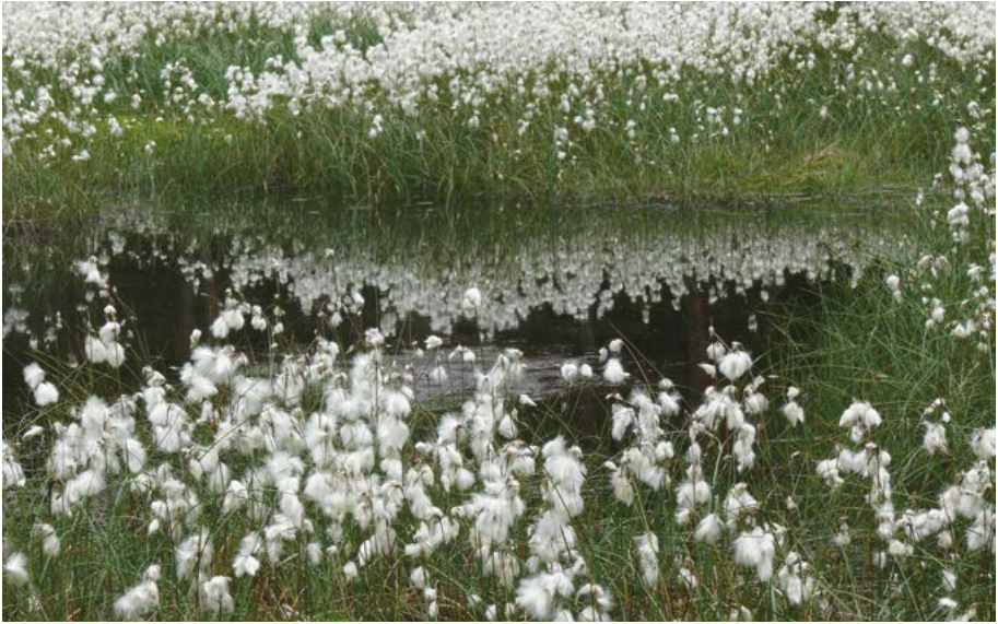
Abb. 43: Bislang fand das Schmalblättrige Wollgras ( Eriophorum angustifolium ) im NSG „Christenberger Talgrund“ gute Vorkommensmöglichkeiten. Dies könnte sich zukünftig durch den Klimawandel ändern.