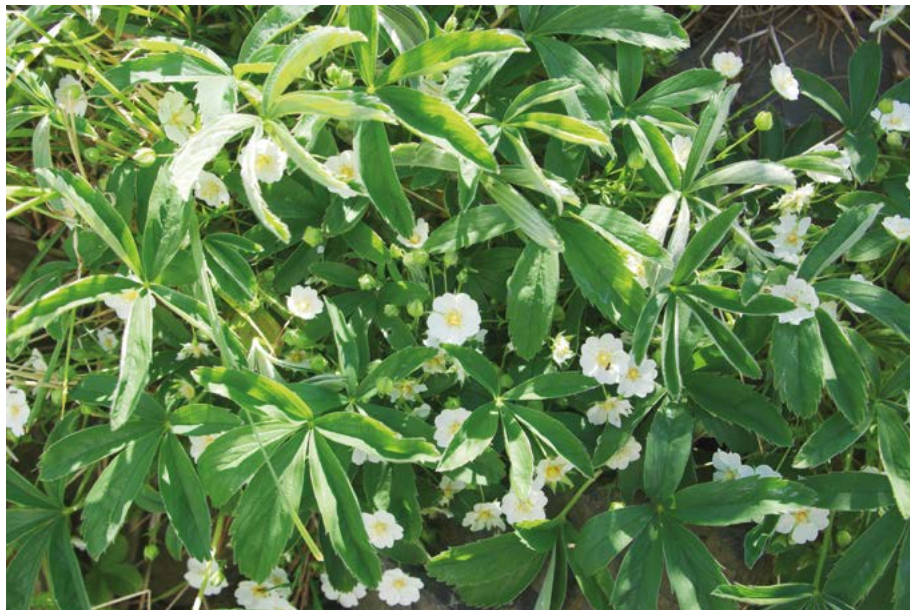
Abb. 9: Das Weiße Fingerkraut ( Potentilla alba ) gilt als extrem selten. Die Art kommt nur noch in der Region Südwest vor und hat dort nur wenige Vorkommen. Das Vorkommen an der Hinkelstein-Schneise im Frankfurter Stadtwald ist ein Relikt der früheren Waldweide.

So wurde im Vorfeld der vorliegenden Roten Liste festgelegt, dass eine Pflanzenart dann als extrem selten eingestuft wird, wenn sie in der Region Nordost nicht mehr als 6, in den Regionen Nordwest und Südwest jeweils nicht mehr als 4, in der Region Südost nicht mehr als 3 und landesweit höchstens 17 Vorkommen aufweist (Abb. 9). Bei den höheren Häufigkeitsklassen wurde den Schwellenwerten nicht eine absolute Zahl an Fundorten, sondern eine prozentuale Rasterfrequenz (Rasterfelder der Topographischen Karte 1 : 25 000) zugrunde gelegt. So wurde festgelegt, dass eine Art als selten eingestuft wird, wenn sie in maximal 15 % der TK-Rasterfelder der betroffenen Region oder des Landes vorkommt.