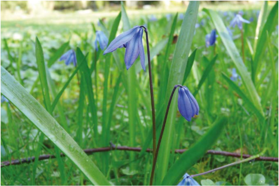
Abb. 36: Der Sibirische Blaustern ( Scilla siberica ) kann wie viele andere Stinsenpflanzen große Herden bilden, ist aber nicht zu effektiver Fernausbreitung in der Lage.

Scilla luciliae : Diese Zierpflanze aus der Türkei verwildert leichter als die ähnliche S. siehei . Wie alle Stinsenpflanzen verfügt sie nicht über effektive Mechanismen zur Fernausbreitung, ist aber in der Lage individuenreiche Bestände auszubilden.