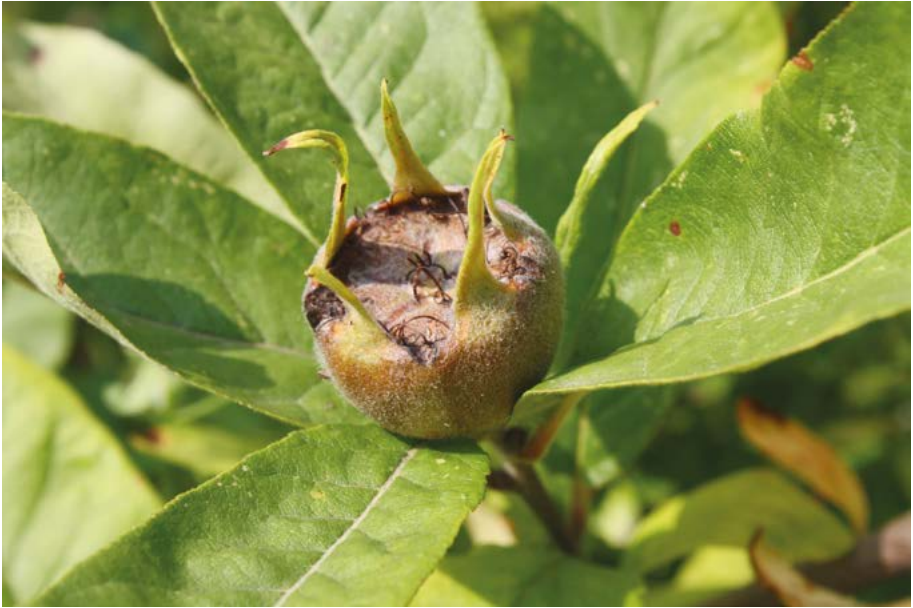
Abb. 28: Die Mispel ( Mespilus germanica ) war jahrhundertlang ein geschätztes und häufig angebautes Obst, das auch verwilderte. Seit die Früchte aus der Mode gekommen sind und der Anbau vielerorts aufgegeben wurde, ist die Art fast vollständig verschwunden.

Melittis melissophyllum : Ein Fund von O. Geheeb bei Bad König (6220/3), Region Südost, der vermutlich aus dem Jahr 1887 stammt, wird als Gartenpflanze oder Schedenverwechslung angesehen. Der letzte Fund aus dem Taunus stammt von Sandberger (1859) aus Eppstein (5816/1).