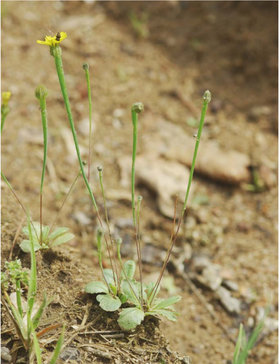
Abb. 41: Arten der Acker-Begleitflora wie der Lämmersalat ( Arnosotis minima ) gehören infolge der Veränderungen in der Landwirtschaft heute zu den am stärksten bedrohten Arten.