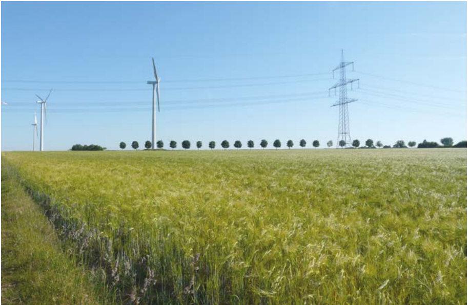
Abb. 40: Die veränderte Landnutzung lässt heute vielerorts keinen Raum mehr für eine artenreiche Flora und Fauna.

Die meisten Pflanzen haben eine relativ breite Amplitude hinsichtlich klimatischer Bedingungen. Die Kälte liebenden Arten allerdings konnten den Höhepunkt ihrer Verbreitung während der sogenannten „kleinen Eiszeit“ vom späten Mittelalter bis zum Beginn des 19. Jahrhunderts erreichen. In dieser Zeit kamen Arten im Tiefland vor, die heute nur noch aus den höheren Lagen der Mittelgebirge bekannt oder die inzwischen in Hessen gänzlich verschollen sind. Der Klimawandel bewirkt weitere Arealveränderungen. Problematisch ist dabei, dass viele seltene Arten in ihrem Vorkommen heute weitgehend an Naturschutzgebiete gebunden sind. Somit werden Arten in Folge des Klimawandels weiter zurückgehen, weil sie in Zukunft innerhalb der Grenzen der Schutzgebiete keine passenden klimatischen Bedingungen mehr vorfinden (Müller & al. 2014), sofern diese Grenzen nicht angepasst werden können (Abb. 43).