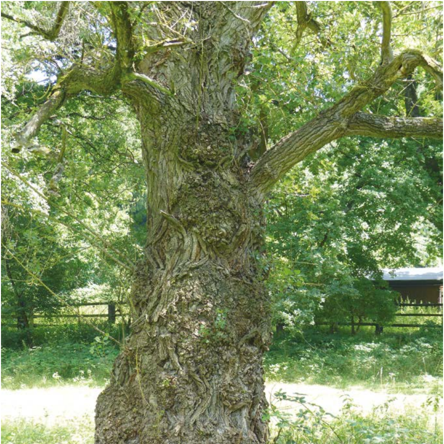
Abb. 30: Bei diesem stattlichen Baum in Frankfurt-Enkheim wurde eine genetische Überprüfung durchgeführt, die bestätigt hat, dass es sich tatsächlich um eine echte Schwarz-Pappel ( Populus nigra ) handelt.

Populus nigra : Keine sicheren Funde in der Region Südost. Das Indigenat der Vorkommen an der Eder in der Region Nordost ist unsicher. Von Höltken & Arndt (2018) dargestellte Vorkommen im Werra-Meißner-Kreis sind zweifelhaft. In der Region Nordwest am Rhein auf dem Lorcher Wert. In der Rheinaue verjüngt sich die Schwarz-Pappel momentan gut, Vorkommen bestehen auch in Hecken und auf Sukzessionsflächen (Abb. 30).