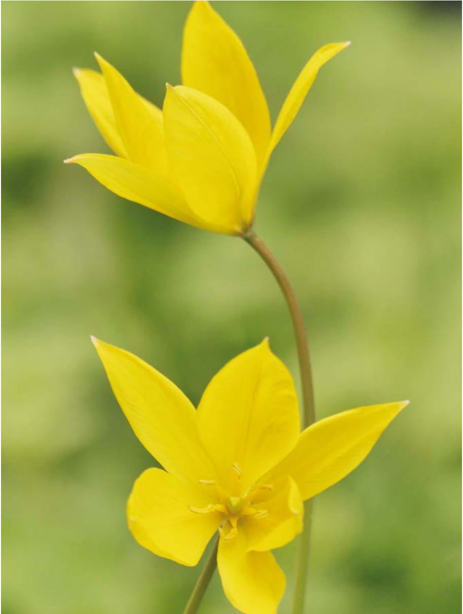
Abb. 37: Verwilderte Exemplare der Wilden Tulpe ( Tulipa sylvestris ) bleiben häufig steril und zeigen dann ihre schönen gelben Blüten nicht.