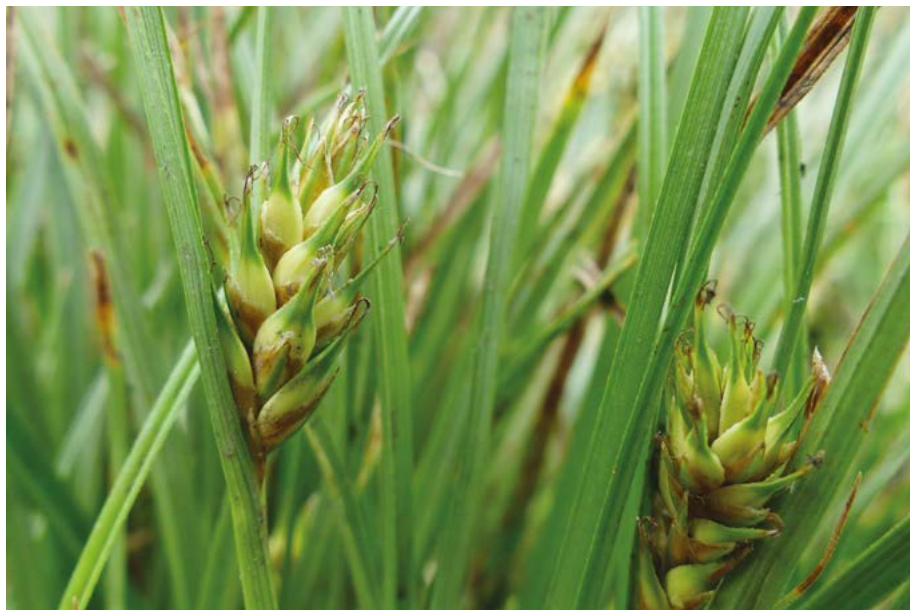
Abb. 20: Die Gersten-Segge ( Carex hordeistichos ) gilt in Hessen als vom Aussterben bedroht.

Centaurea nigra subsp. nigra : Angaben für Hessen waren irrtümlich.