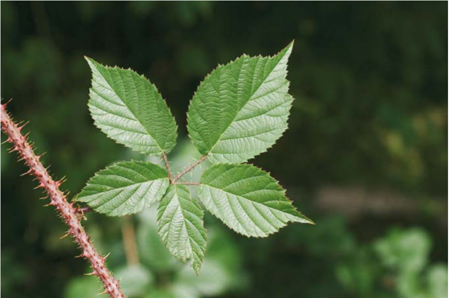
Abb. 1: Die Kenntnis über Verbreitung und Gefährdung von Brombeer-Sippen konnte in den letzten Jahren enorm verbessert werden. Die Köhler-Brombeere ( Rubus koehleri ) gehört zu den hessenweit sehr seltenen Arten.

beibehalten, um die Vergleichbarkeit mit den älteren Fassungen der Liste sicherzustellen.