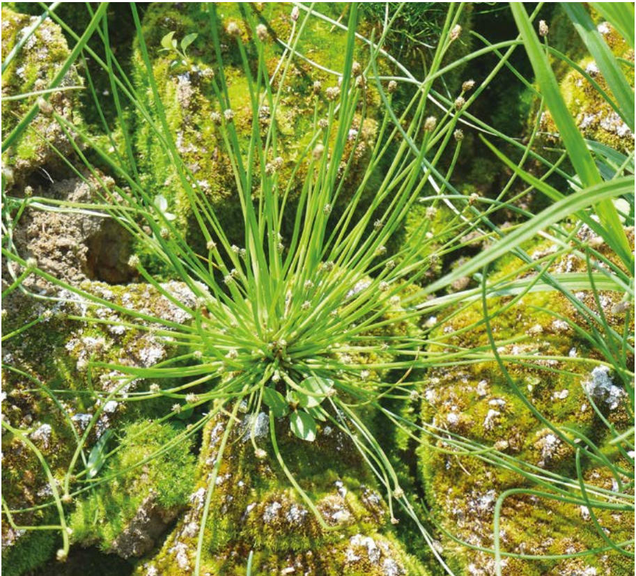
Abb. 22: Die Ei-Sumpfbirse ( Eleocharis ovata ) am Reichloser Teich.

Eleocharis ovata : Nach Bönsel (2007) im Büdinger Wald (Region Südost, Abb. 22).