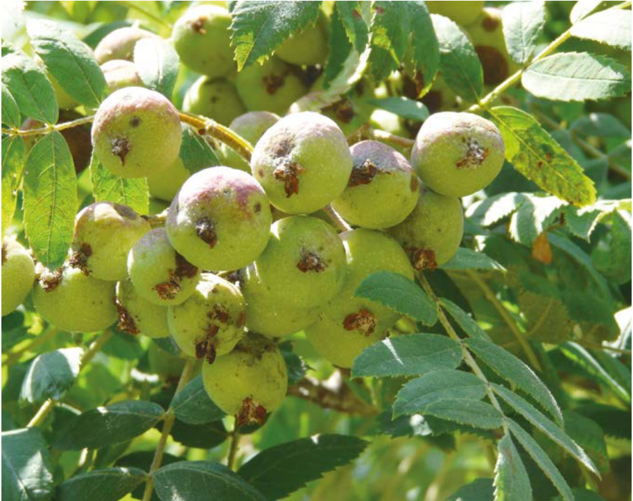
Abb. 16: Durch die lange Kultur-Geschichte in der Region ist der Status des Speierlings ( Sorbus domestica ) immer wieder umstritten. Aktuell wird er als unbeständiger Archäophyt bewertet.

Sippen, die bislang nur über unbeständige Vorkommen in Hessen verfügen und daher nicht Bestandteil der Florenliste sind, können im Internet in der Florenliste des Projektes „Beiträge zur Pflanzenwelt in Hessen“ ( http://www.botanik-hessen.de/Florenliste ), das eine wichtige Grundlage für die Erstellung der Florenlisten lieferte, recherchiert werden.