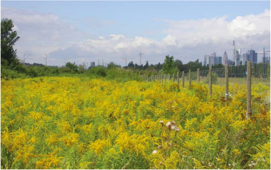
Abb. 44: Neophyten mit besonderen Stoffwechsel-Anpassungen an trocken-heißes Klima wie die Kanadische Goldrute ( Solidago canadensis ) werden durch den Klimawandel gefördert. Die wärmebegünstigte Region Südwest hat einen besonders hohen Anteil an Neophyten.

Die jüngsten Klimaveränderungen fördern andererseits die Ansiedlung von Neophyten. Bleiben im Winter starke Fröste aus, können sich Arten, die als Jungpflanzen frostempfindlich sind, etablieren, z. B. Prunus laurocerasus . Einige Neophyten profitieren zudem von höheren Bodentemperaturen für die Keimung, z. B. Amaranthus -Arten. Arten mit besonderen Stoffwechsellanpassungen wie Solidago canadensis (Abb. 44) oder Arten mit dem sogenannten C_4 -Stoffwechsel, z. B. aus der Gattung Eragrostis , haben in trocken-heißen Sommern wie in 2018 Vorteile gegenüber einheimischen Arten. Diese Auswirkungen zeigen sich besonders stark in der ohnehin wärmebegünstigten Region Südwest, die mit 20,3% den höchsten Neophyten-Anteil aller hessischen Regionen aufweist.