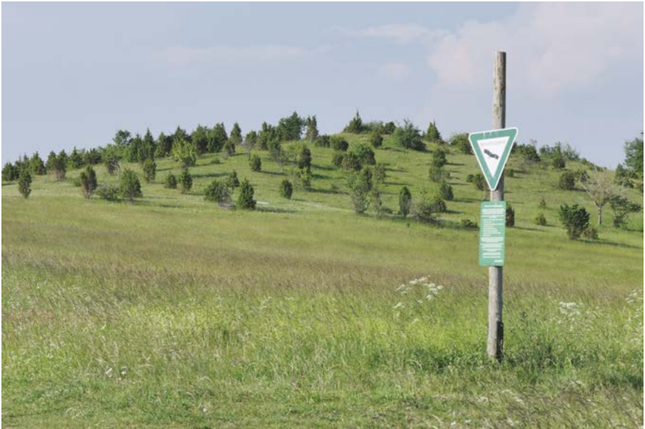
Abb. 27: Kalkmagerrasen mit Wacholder ( Juniperus communis ) im NSG „Bühlchen“ am Meißner.

Lactuca saligna : Die im 19. Jahrhundert in den Regionen Nordost und Südwest nachgewiesene Pflanze wurde zuletzt bei Vigener (1906) für die Fundorte Hochheim und Flörsheim (5916/3) genannt. Das 2009 entdeckte Vorkommen in Frankfurt (König 2010) wird als neophytisch bewertet.