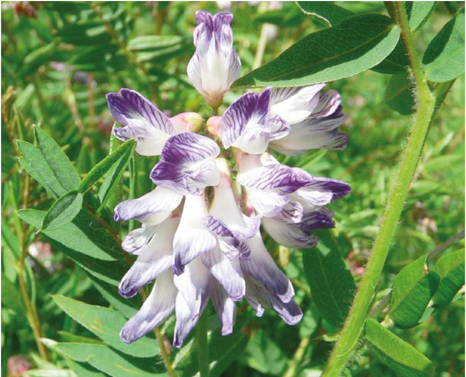
Abb. 12: Die als verschollen angenommene Heide-Wicke ( Vicia orobus ) wurde im Spessart wiedergefunden. Sie wird im Rahmen eines Förderprogramms im Botanischen Garten Frankfurt vermehrt.

Die Heide-Wicke ( Vicia orobus ) wurde im Spessart wiedergefunden (Abb. 12). Hier liegt noch kein Artenhilfsprogramm vor. Sie ist aber eine der Arten, die im Rahmen eines Förderprojektes in einem Botanischen Garten vermehrt und anschließend wieder in die Natur ausgebracht werden. In Zusammenarbeit mit den zuständigen Behörden und Vertretern der Naturschutzverbände betreiben mehrere hessische Gärten aktuell derartige Projekte.