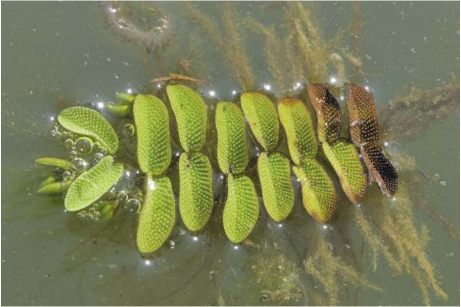
Abb. 32: Gewöhnlicher Schwimmfarn ( Salvinia natans ).

Schoenoplectus triqueter : Die jüngste Aufsammlung erfolgte 1931 in der Region Südwest durch G. Hooge am Main bei Bischofsheim.