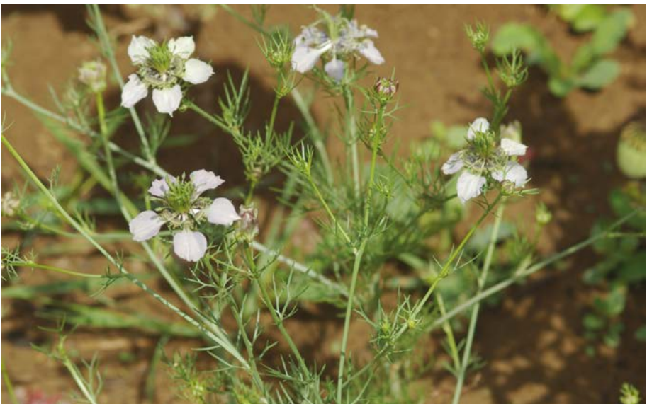
Abb. 46: Der Acker-Schwarzkümmel ( Nigella arvensis ) konnte aus der Roten-Liste-Kategorie 1 in die Kategorie 2 überführt werden.