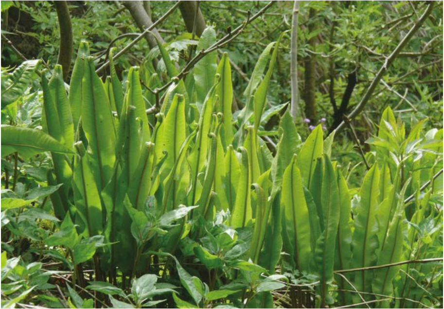
Abb. 18: Die Vorkommen der Hirschzunge ( Asplenium scolopendrium ) in den verschiedenen Regionen Hessens werden sehr unterschiedlich eingeschätzt. In der Region Nordost kommt die Art wohl nur unbeständig vor.

Asplenium scolopendrium : Vorkommen in der Region Nordost sind wohl nur unbeständig (Abb. 18).