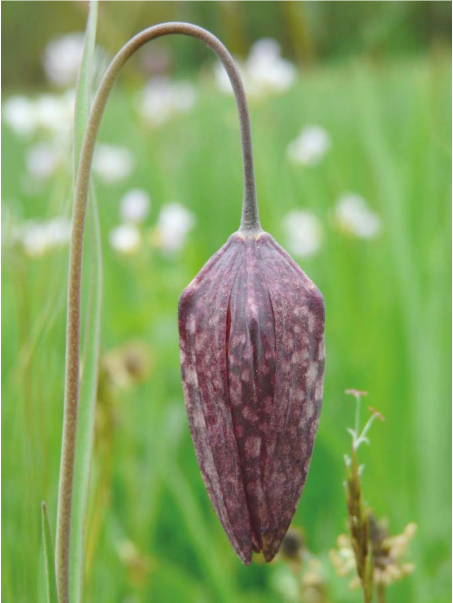
Abb. 35: Der Status des Vorkommen der Schachblume ( Fritillaria meleagris ) im Sinntal geht wahrscheinlich auf eine Verwilderung zurück.