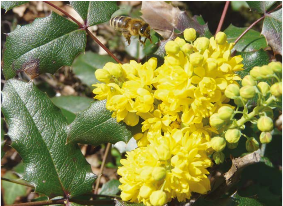
Abb. 15: Die Mahonie ( Mahonia aquifolium ) steht auf der Beobachtungsliste der Schwarzen Liste.