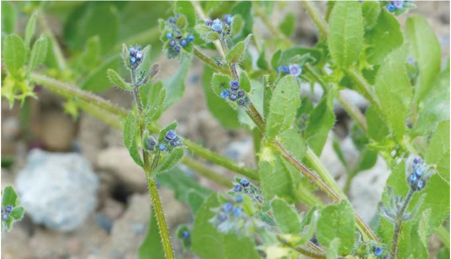
Abb. 45: Das Schlangenäuglein ( Asperugo procumbens ) galt als verschollen. Es wurde jedoch inzwischen im Raum Wiesbaden mehrfach dokumentiert.

Dagegen müssen seit Erscheinen der letzten Auflage 18 Sippen neu als ausgestorben oder verschollen angenommen werden. Die Mehrzahl dieser Arten war aber offenbar bereits beim Erscheinen der letzten Roten Liste (Hemm & al 2008) ausgestorben, lediglich für 7 der Arten liegen Nachweise nach 1980 vor: Euphorbia falcata 1991, Gratiola officinalis 1995, Hypochaeris glabra 1984, Lathyrus aphaca 1999, Pedicularis palustris 1980er Jahre, Tofieldia calyculata 1981 und Utricularia minor evtl. 1998. Bei den neu in diese Kategorie aufgenommenen Sippen handelt es sich um: