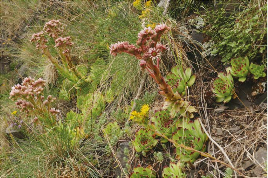
Abb. 33: Das Vorkommen der Dach-Hauswurz ( Sempervivum tectorum ) am Bilstein bei Albugen ist möglicherweise indigen.

Scorzonera purpurea : Das Vorkommen war auf die Kalksteinbrüche westlich Flörsheim (5916/3), Region Südwest, beschränkt. Der letzte Herbarbeleg stammt aus dem Jahre 1949, das Vorkommen wurde spätestens 1978 vernichtet (Poschwitz 1994).