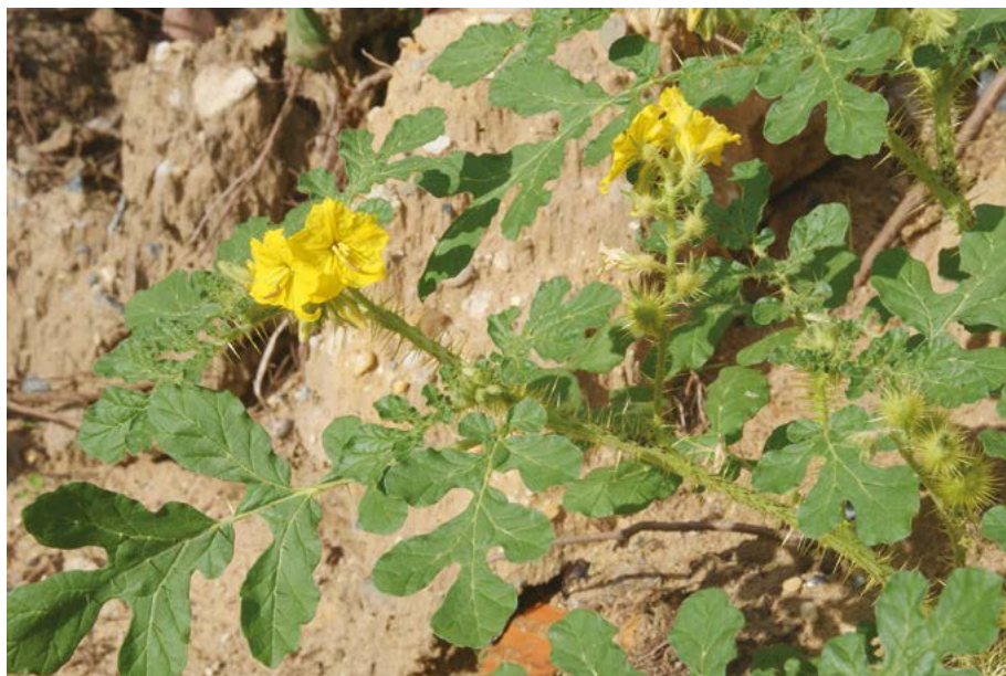
Abb. 2: Der auffällige Stachel-Nachtschatten ( Solanum rostratum ) kommt in Hessen bislang nur unbeständig vor, wie hier im Siedlungsbereich von Darmstadt-Eberstadt. Er wurde deswegen nicht in die Florenliste aufgenommen.

Da Neophyten generell nicht mehr in Roten Listen bewertet werden sollen, was in der 4. Fassung anders war, werden die eingebürgerten und in Einbürgerung begriffenen Neophyten in einer gesonderten Liste aufgeführt. Nur eingebürgerte Neophyten, die nach der Bundesartenschutzverordnung oder anderen gesetzlichen Vorgaben zu bewerten sind, erhielten eine hessenweite Einstufung. Dies betrifft 30 Sippen, von denen allerdings nur sechs als eingebürgert angesehen und bewertet werden: Cochlearia danica , Fritillaria meleagris , Muscari botryoides , Scilla siberica , Tulipa sylvestris und Galanthus nivalis . Lediglich Fritillaria meleagris erhielt mit R eine Einstufung, die für die erweiterte Rote Liste relevant ist. Die nach der Bundesartenschutzverordnung zu bewertenden Neophyten bleiben in der Statistik zu gefährdeten Arten unberücksichtigt.