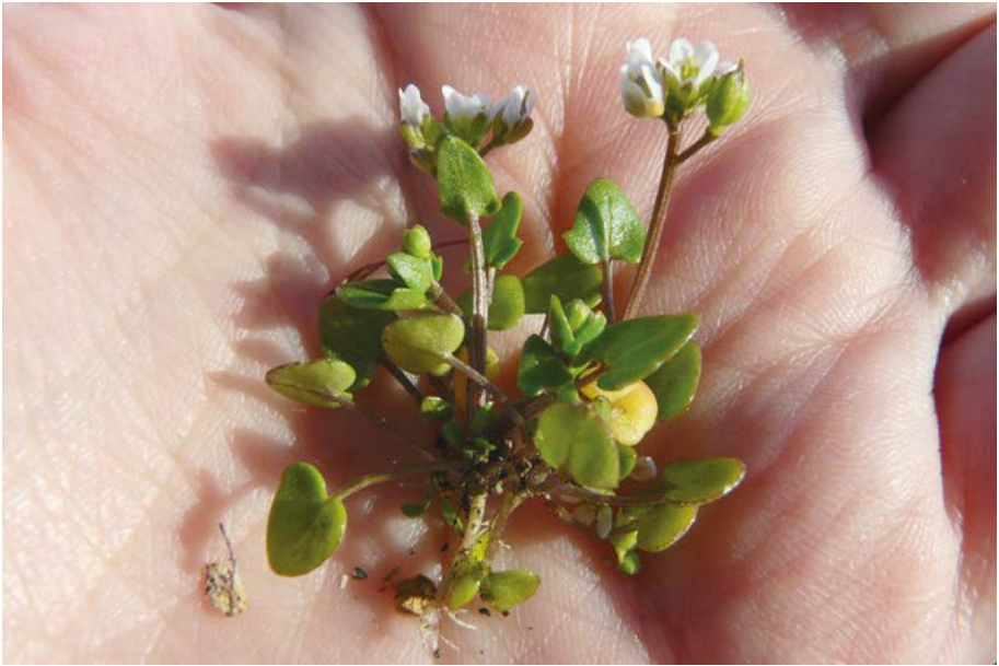
Abb. 34: Dänisches Löffelkraut ( Cochlearia danica ) vom Seitenstreifen der Autobahn 3 bei Frankfurt.

Coincya monensis subsp. cheiranthos : Wird in Hessen als Neophyt eingestuft.