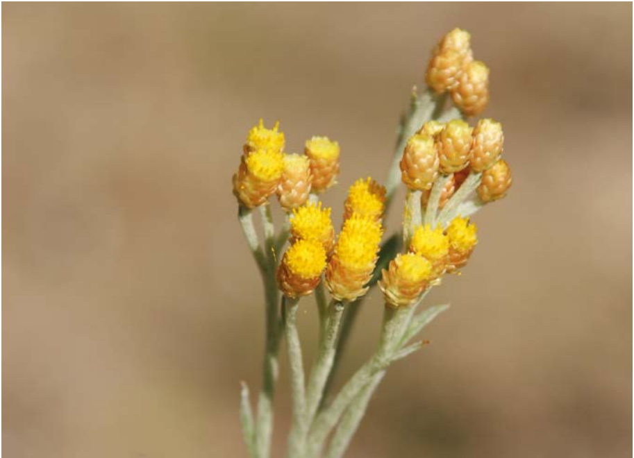
Abb. 48: Die Sand-Strohblume ( Helichrysum arenarium ) wurde in der Region Südwest und damit auch hessenweit von der Roten-Liste-Kategorie 3 auf die Vorwarnliste gesetzt.

In dieser Kategorie ist der Umbruch besonders groß. Trotz der insgesamt starken Abnahme in dieser Kategorie sind 33 Sippen neu als gefährdet eingestuft worden, dabei hat sich die Einstufung für den größeren Teil der Arten verschlechtert, für 13 Arten stellt es eine Verbesserung der Situation dar.