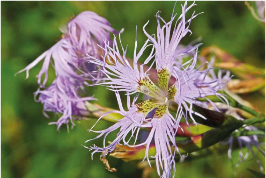
Abb. 21: Von der Pracht-Nelke ( Dianthus superbus ) gelangen aktuelle Funde vor allem in der Region Südost.

Danthonia decumbens subsp. decipiens : Sichere Angaben aus Hessen fehlen. Eine pauschale Zuordnung von Vorkommen von Danthonia decumbens auf Kalk zu dieser Sippe hat sich als irrtümlich erwiesen (Gregor & al. 2017).