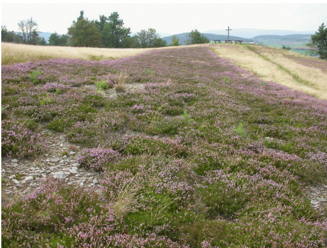
Abb. 3: In den Hochheiden im Waldecker Upland kommen mehrere Cladina -Arten vor. Flechtenreich sind vor allem die vor kurzem geplagten Bestände wie hier im Naturschutzgebiet Kahle Pön bei Usseln.