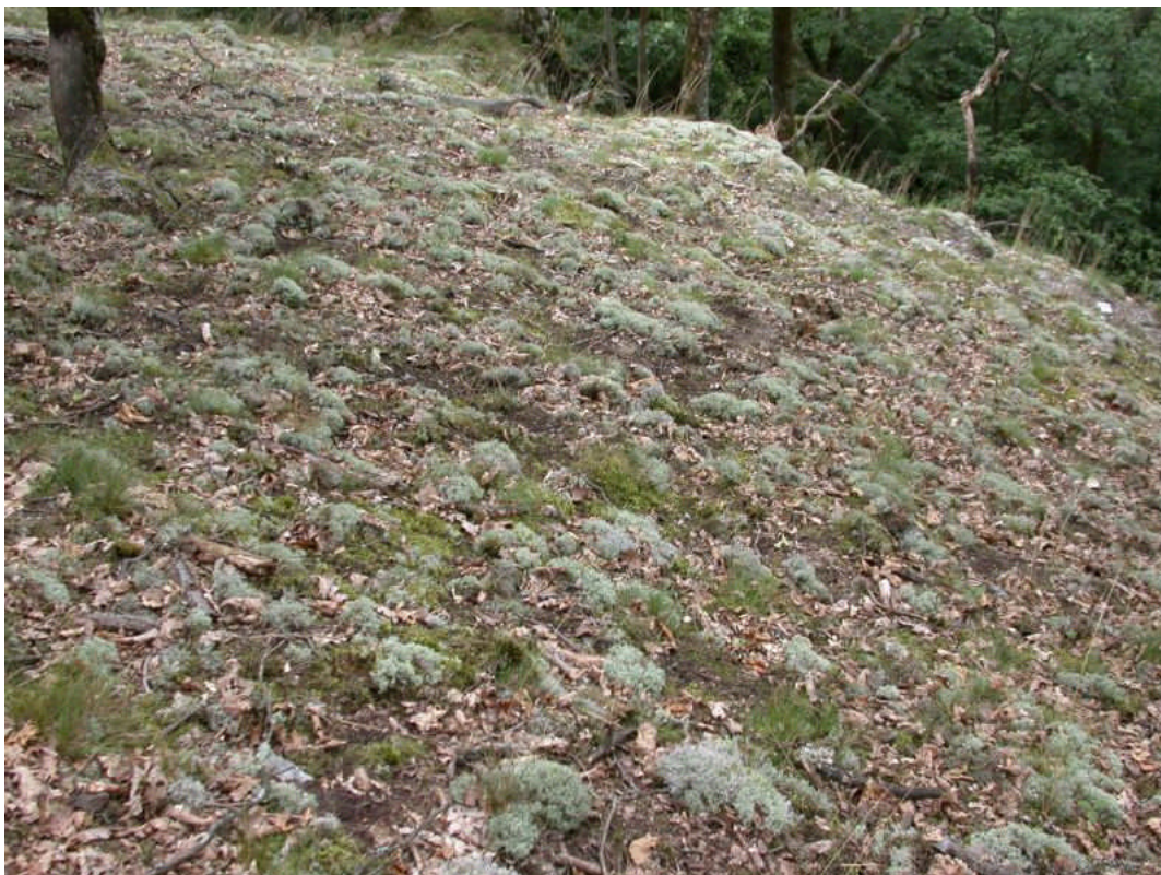
Abb. 2: Ein typischer Lebensraum von Cladonia ciliata im Rheinischen Schiefergebirge sind die lichten Eichenwälder an \pm südwestexponierten Hängen wie hier im Wispertal.