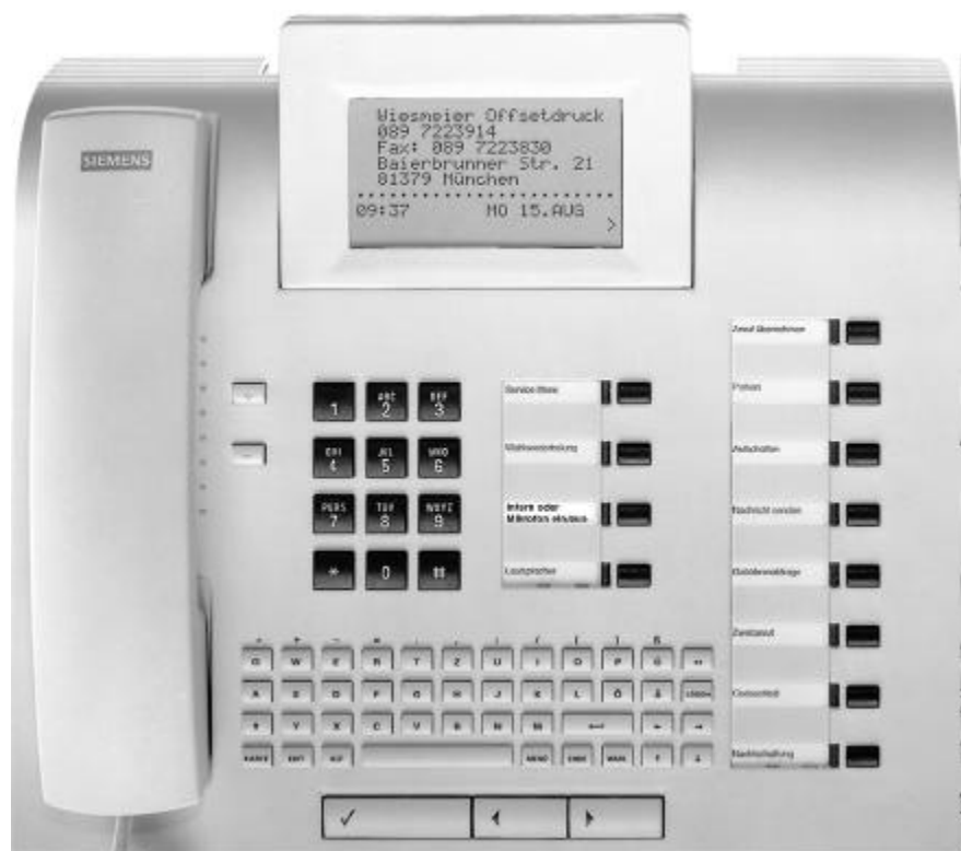
optiset E memory