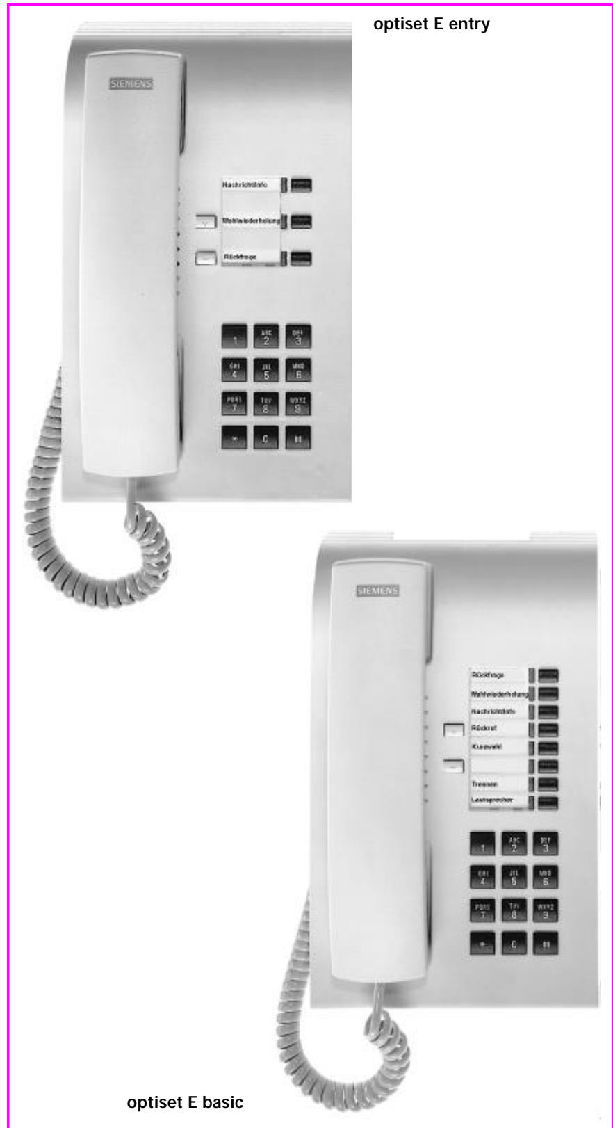
optiset E entry