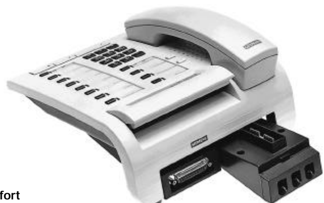
optiset E comfort