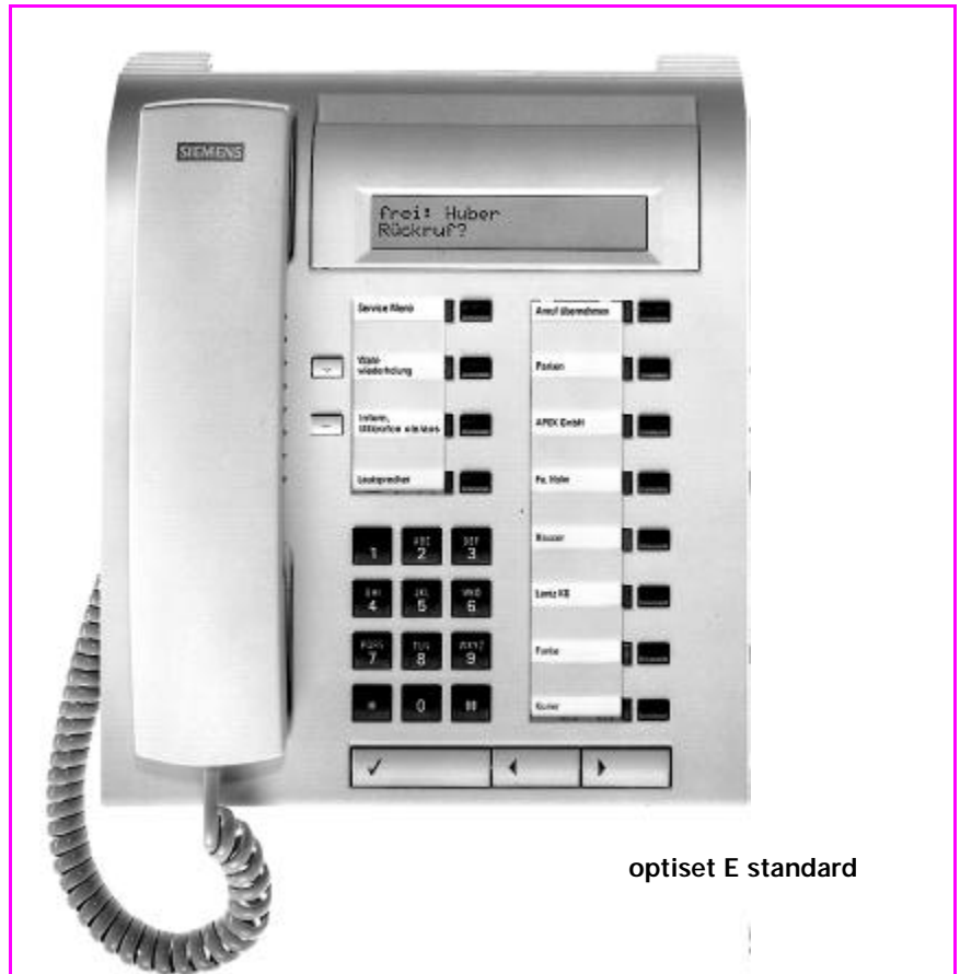
optiset E standard