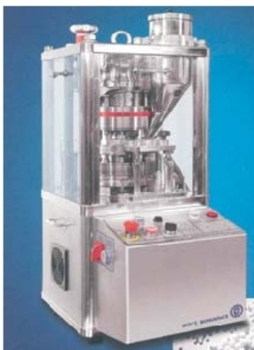
Tablettázó gép, Dott. Bonapace s.r.l.

Bemutatópartnerünk közül az IKA GmbH új szerzeményünk. Tevékenységéről e számunkban részletesen beszámolunk, a többieknek már szenteltünk egy-egy cikket régebben.