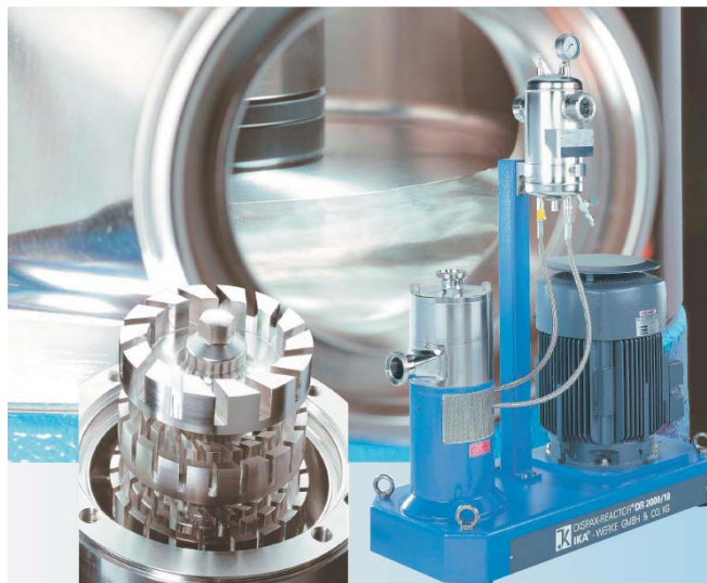
Keverőház és diszpergáló elem a berendezés lelke

Itt található a nagysebességű diszpergáló elem, mely beszívja a tölcsérbe adagolható folyékony vagy szilárd komponenseket, azokat göbösödés nélkül azonnal diszpergálja a keverék főtömegébe. Az egység fölötti tartályba nyúló keverő fűthető/hűthető, ezáltal a hőátadásra sokkal kevesebb idő elegendő. Az új design következtében a hagyományos berendezésekhez viszonyítva