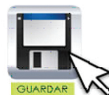
Figura 5. Ejemplo de una etiqueta ALT.

sabemos que no es aconsejable emplear el color verde para “Guardar” y el rojo para “Borrar”, ya que personas con problemas en la visualización de algunos colores no sabrían qué botón apretar. Las etiquetas llamadas en la jerga de la informática “ALT” son los cartelitos con texto explicativo que aparecen cada vez que nos posamos con el puntero del mouse sobre un botón o un link (Fig.5). Esto permite a personas que desconocen el soft , sepan cual es la función del botón en cuestión. En caso que el usuario tenga reducción de la vista, la fuente de dicho texto puede agrandarse, como toda la pantalla en si. Si