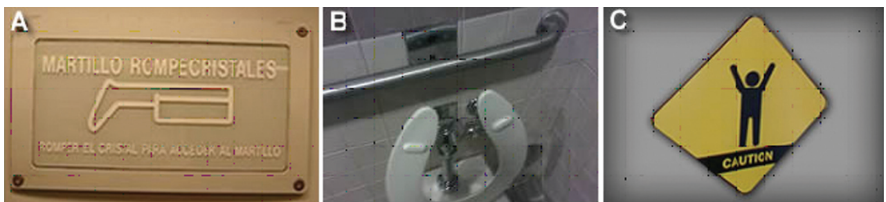
Figura 3. A. Martillo de emergencias en un salón: “Martillo rompecristales. Rompa el cristal para acceder al martillo”. ¿Quedó claro? B. Una baranda detrás de un inodoro. Para facilitar el acceso y la usabilidad a usuarios con capacidades reducidas en un baño público, pero ¿realmente facilita? C. Cartel indicador en un estadio de fútbol en México muestra una figura y la leyenda “Caution” (cuidado). Significado confuso, ¿peligro al alentar? ¿peligro al saltar o al levantar los brazos? No, significa en realidad “Peligro al hacer la ola”.