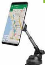
Art.Nr. 65952 Orientierbarer Arm Teleskopisch Um 360° drehbar