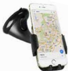
Art.Nr. 58629 Ausrichtbare Halterung Dreht um 360 Grad Einstellbare Greifer