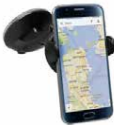
Art.Nr. 11645 Einstellbarer Bügel In der Weite verstellbar Saugnapfhalterungen