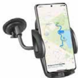
Art.Nr. 62121 Einstellbarer Bügel In der Weite verstellbar Saugnapfhalterungen