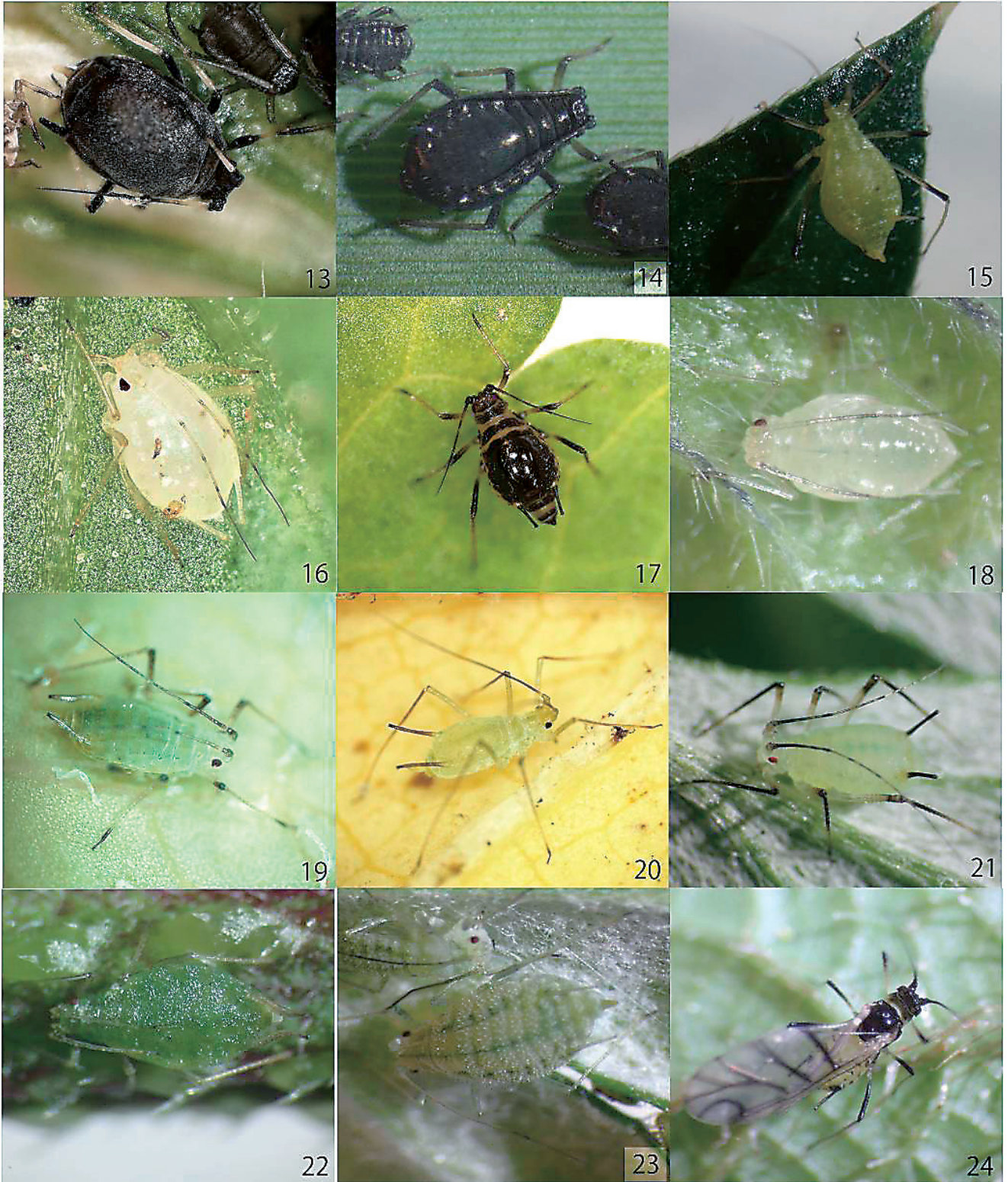
図13-24. 今回確認された四国初記録と考えられるアブラムシ. 13: オヒシバクロアブラムシ. 14: ガマノハアブラムシ. 15: ノアザミヒゲナガアブラムシ. 16: カキドウシヒゲナガアブラムシ. 17: テニンソウヒゲナガアブラムシ. 18: ホトケノザクギケアブラムシ. 19: チシャミドリアブラムシ. 20: ユリノキヒゲナガアブラムシ. 21: アシナガヒメヒゲナガアブラムシ. 22: カナムグライボアブラムシ. 23: ヨモギミドリクギケアブラムシ. 24: チダケサシヒゲナガアブラムシ.