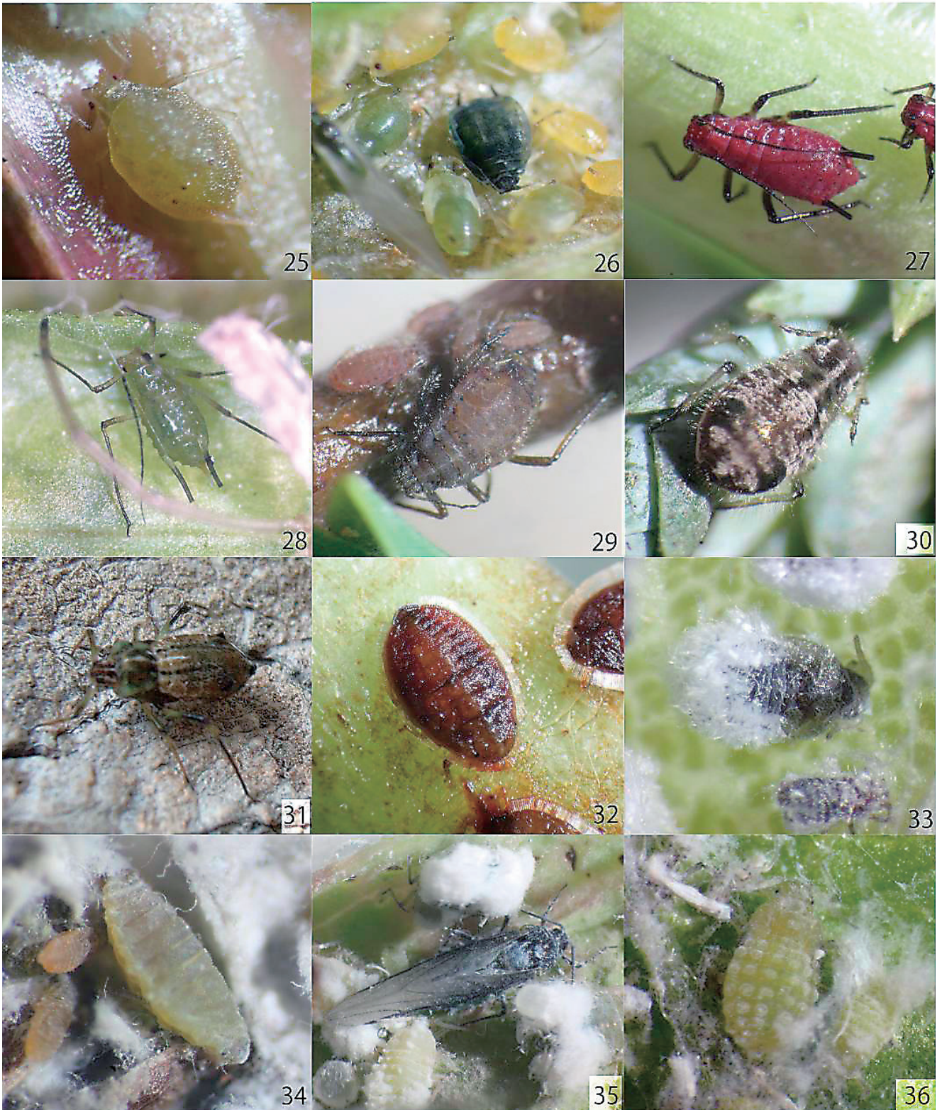
図25-36. 今回確認された四国初記録と考えられるアブラムシ. 25: タデケクダヒゲナガアブラムシ. 26: エドヒガンコブアブラムシ. 27: シャジンヒゲナガアブラムシ. 28: ヒメムカシヨモギヒゲナガアブラムシ. 29: ヤナギホソクダツボアブラムシ. 30: ネズミサシオオアブラムシ. 31: ハネナガオオアブラムシ. 32: オタカラコウコナジラミモドキ. 33: マンサクイボフシアブラムシ. 34: スゲワタムシ. 35: トウネズミモチハマキワタムシ. 36: サンザシハマキワタムシ.

Figs. 25-36. The aphid species newly recorded from Shikoku. 25: Trichosiphonaphis polygoniformosana . 26: Tuberocephalus tianmushanensis . 27: Uroleucon adenophorae . 28: Uroleucon erigeronense . 29: Pterocomma pilosum konoi . 30: Cinara juniperi . 31: Cinara longipennis . 32: Aleurodaphis ligulariae . 33: Hamamelistes kagamii . 34: Colopha kansugei . 35: Prociphilus ligustrifoliae . 36: Prociphilus crataegicola .