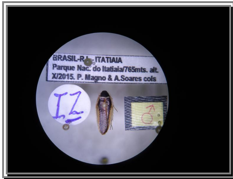
Ectobiidae Dasyblatta sp