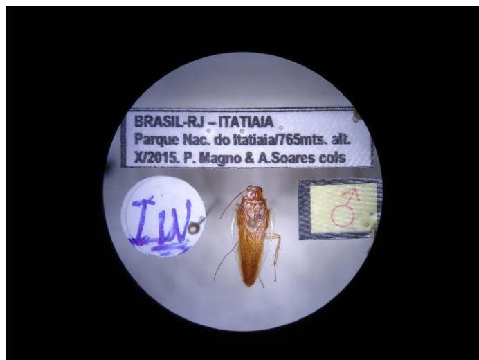
Ectobiidae Chorisonaura sp