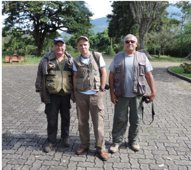
5) Fotos de alguns dos exemplares registrados