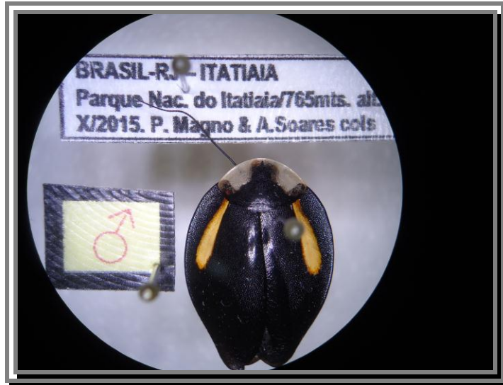
Ectobiidae – Phoraspis leucograma