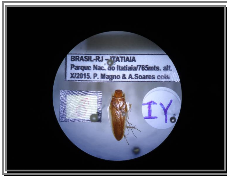
Ectobiidae Chorisonneura sp