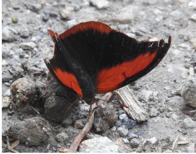
Polygrapha suprema (Schaus, 1920)