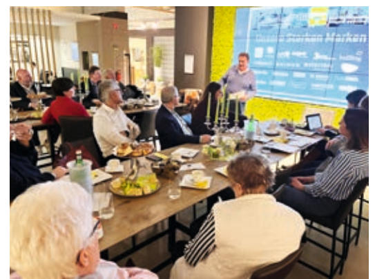
▲ Start des IHK-Wettbewerbs „Erfolgsraum Altstadt“

wird in diesem Jahr auch ein Sonderpreis für „kreative Leerstandsinszenierungen“ ausgelobt. Mehr Informationen zum Wettbewerb finden Sie online unter www.erfolgsraum-altstadt.de . Bewerbungsschluss ist der 30. April 2023. Im Anschluss an die Sitzung erkundeten die Ausschussmitglieder die Küchenwelt by Pfiff in Brüsewitz. Sowohl am Standort in Brüsewitz als auch in Gägelow sind weitere Investitionen in Verkaufs- und Lagerflächen geplant.