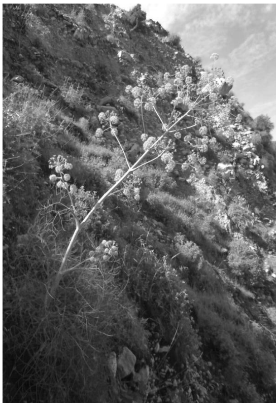
شکل ۵- عنصر رویشی Ferula stenocarpa در پناه دیواره آبراهه

تحقیقات شکل زیستی نشان داد که تروفیت‌ها با ۵۸/۹ درصد، بیشترین درصد شکل زیستی را به خود اختصاص داده‌اند که با پژوهش‌های ابراری واجاری و ویس کرمی (۱۳۸۴) و فتاحی و همکاران (۱۳۷۹) و نجفی تیره شبانکاره و همکاران (۱۳۸۴) مطابقت دارد. فراوانی تروفیت‌ها ممکن است به دلیل شرایط نامساعد رشد (دست کم ۶ ماه از سال خشک است) باشد. این گیاهان فصل نامساعد برای رشد را با سازوکار گریز از خشکی از راه خواب بذر پشت سر می‌گذارند و پس از مهیا شدن شرایط رشد، شروع به جوانه‌زنی و رشد می‌کنند. بعد از تروفیت‌ها، همی کریپتوفیت‌ها بیشترین شکل رویشی را از آن خود کرده‌اند که با نتایج نجفی تیره شبانکاره و همکاران (۱۳۸۴) مطابقت دارد، ولی با نتایج ابراری واجاری و ویس کرمی (۱۳۸۴) تطابق ندارد که ممکن است به دلیل تطابق تقریباً نزدیک آب و هوای منطقه مورد بررسی با منطقه حفاظت‌شده گنو در استان هرمزگان باشد (متوسط بارندگی حوضه تنگ بن، ۳۵۰/۰۴ میلی‌متر، متوسط بارندگی منطقه