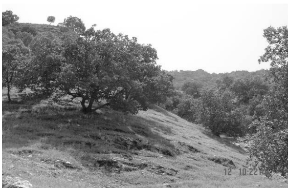
شکل ۲- نمایی از عناصر رویشی Quercus brantii به همراه زیراشکوب گیاهان یک ساله

بیشتر از عناصر رویشی مشترک ایران تورانی و اروپا سیبریایی و همچنین مدیترانه‌ای و سودانی منطقه مورد بررسی را تحت تأثیر قرار داده‌اند که دلیل آن همجواری دو منطقه ایران تورانی و سودانی است. در بخش‌هایی از حوضه تداخل عناصر سودانی با ایران تورانی آشکارا دیده می‌شود، چنانکه بعضی از عناصر اصلی سودانی مثل کنار و رملیک تا قسمت‌هایی از جنگل‌های بلوط پیشروی می‌کنند (شکل ۴).