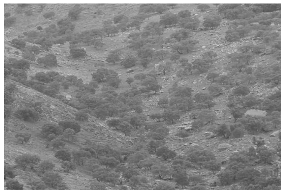
شکل ۱- نمایی از عنصر رویشی Quercus brantii بر روی سازند پابده در منطقه رویشی ایران تورانی (جنگل‌های زاگرس)

بادام کوهی ( Amygdalus scoparia )، انجیر وحشی ( Ficus johannis subsp. johannis ) و کبک ( Acer monspessulanum subsp. Cinerascens ) از دیگر عناصر رویشی درختی و درختچه‌ای ایران تورانی هستند که به صورت پراکنده گونه‌های بلوط را در جنگل‌های این حوضه همراهی می‌کنند. قسمت تراس‌های آبرفتی حوضه که ۲/۹۶ درصد از محدوده مورد بررسی را نیز به خود اختصاص داده است بخشی از منطقه رویشی سودانی است. جوامع کنار ( Ziziphus spina-christi ) (شکل ۳) به همراه گونه‌های رملیک ( Ziziphus nummularia ) از مهم‌ترین عناصر رویشی سودانی در حوضه تنگ بن به شمار می‌روند. Pergularia tomentosa ، Marsdenia erecta و Gymnocarpus decander از دیگر عناصر رویشی سودانی هستند که گونه‌های کنار را در بخش‌های مختلف حوضه در محدوده تراس‌های آبرفتی همراهی می‌کنند.