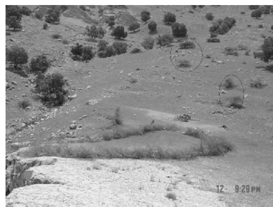
شکل ۴- نمایی از نفوذ عنصر رویشی Ziziphus nummularia به داخل منطقه ایران تورانی (جنگل‌های زاگرس) بر روی سازند پابده