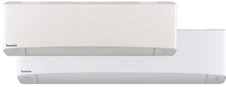
Etherea Z Wandgeräte Weiß matt