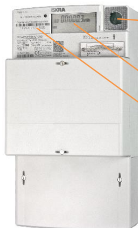
Beispielhafte Abbildung, Abweichungen und Änderungen vorbehalten

Optischer Lichtsensor für die Eingabe der PIN und zum Aufruf der Momentanleistung und historischer Verbrauchswerte