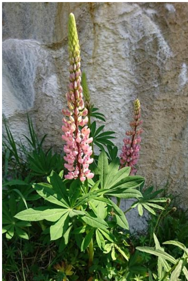
Lupinus polyphyllus