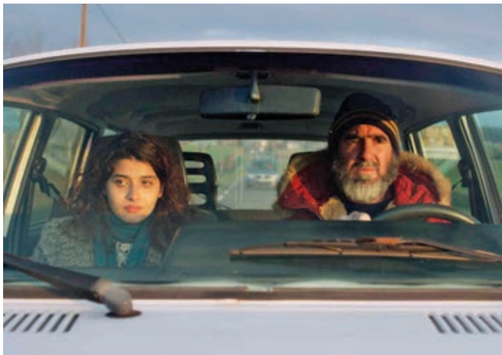
Le film « Ulysse et Mona » tourné en Pays de la Loire est sorti en salle le 30 janvier.