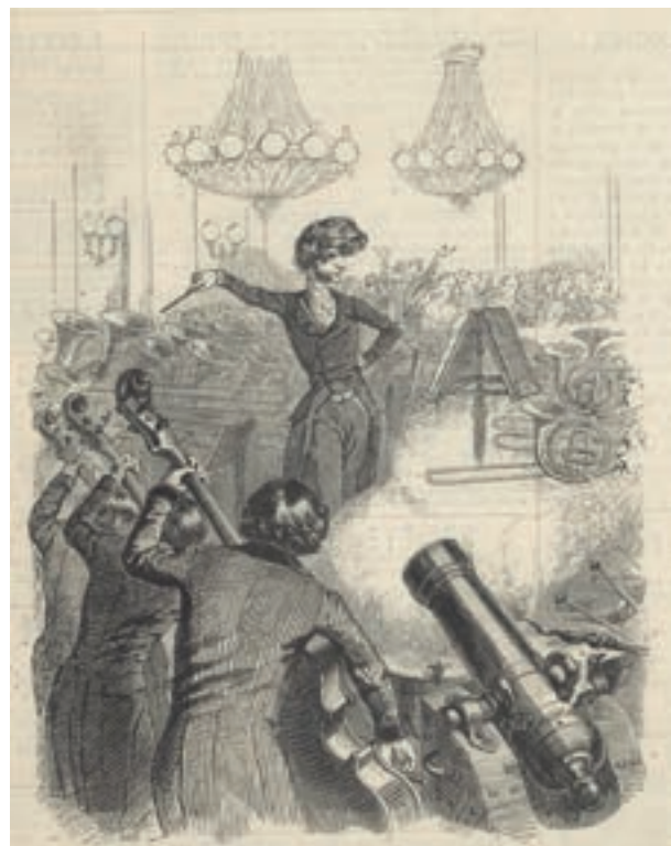
« Un concert à mitraille ». Caricature de la soirée de 1830 (concert de Berlioz à Grandville), publiée dans L'illustration (novembre 1845).