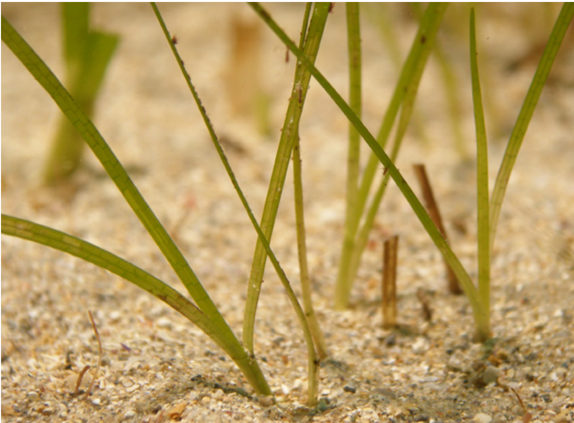
Figura 1. Fotografía de Zostera noltii .

→ Real Decreto 139/2011, de 4 de febrero, para el desarrollo de la Lista de especies silvestres en régimen de protección especial y del Catálogo español de especies amenazadas, y sus modificaciones: