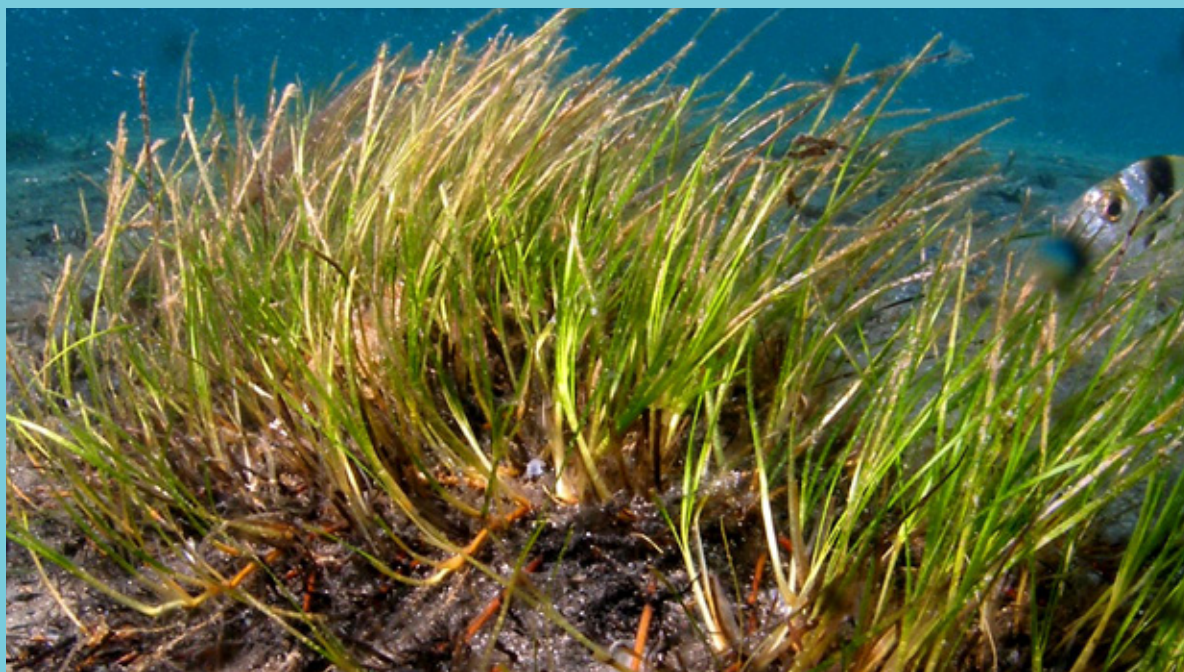
Fotografía de Zostera noltii .

Teniendo en cuenta los datos del estudio de Julià y colaboradores, el área total que ocupa esta planta en el mar Balear en forma de praderas monoespecíficas es de 0,01 km 2 ; esto representa el 0,02 % del total cartografiado y el 0,001 % del área ocupada por fanerógamas marinas. Cuando se consideran todos los hábitats donde está presente (praderas monoespecíficas y praderas mixtas, tanto con Cymodocea nodosa como con Caulerpa prolifera ), la superficie que ocupa es de 0,07 km 2 , el 0,16 % del total cartografiado y el 0,01 % de la superficie ocupada por praderas de fanerógamas marinas.