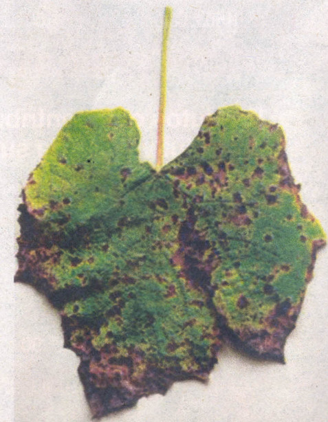
Figura 4 – Poda mista: ramo longo, também denominado de vara, à esquerda e à direita; ramo curto ao centro, também denominado de esporão.