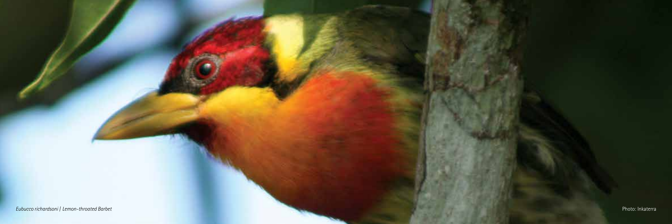
Eubucco richardsoni | Lemon-throated Barbet