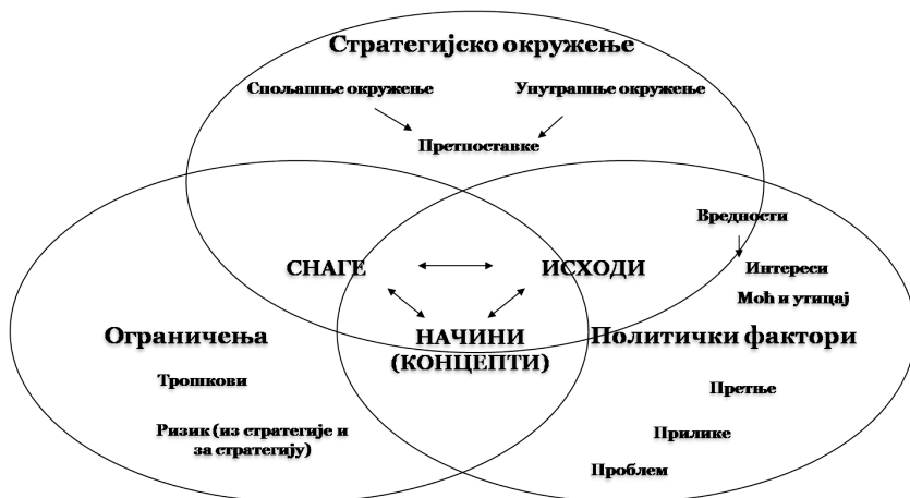
Слика 1: Логика развоја стратегије

најважнији и суштински део стратегије (слика 1). Оптимална стратегија увек се састоји од исхода, концепата и снага, а фокус је на томе како они синергијски комуницирају са стратешким окружењем да би се добили жељени ефекти (Vračar i Milkovski 2022, 52–56).