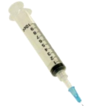
Jeringa 10 cc