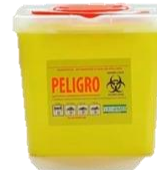
Desecho de cortopunzante