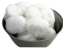
Torulero con Tómulas