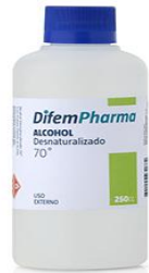
Alcohol al 70%