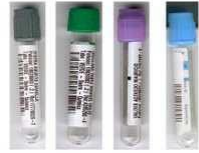
Tubos de exámenes