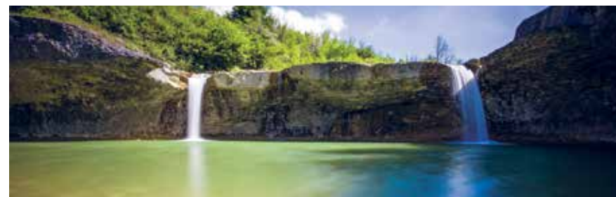
Pazin / Pisino – Zarečki krov