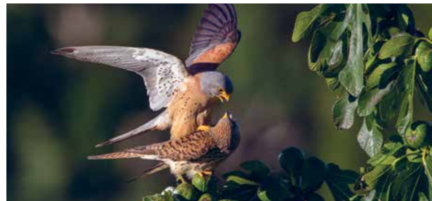
Grillaio (Falco naumanni) / Rötelfalke (Falco naumanni)

Pazinština, Pazinski potok, Budava, Grdoselski potok, Čepić Tunnel, Istrien – Oprtalj, Istrien – Čački, Istrien – Martinčići, Istrien – Čepičko polje, Piskovica špilja, Jama kod Rašpora, Jama kod Burići, Limski kanal – Meer, Plomin – Moščenička draga, Vrsarer Inseln, Meduliner Bucht, Pomer Bucht und Einmündung von Raša, die sich auf insgesamt 128.072,80 ha erstrecken.