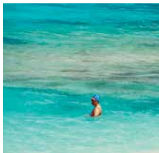
Autore / Autorin: Diana Herrera