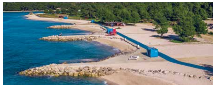
Autore / Autor: Danijel Bartolc - nunu production

Das Modell Grüner Strand wird in vier Ländern getestet: auf Zypern (drei Strände), in der Region Toskana (drei Strände), in Katalonien (drei Strände) und in Istrien. Die Flagge mit dem Zeichen Green Beach haben in Istrien folgende Strände: Stadtbadestrand in Poreč, Strand Karpinjan in Novigrad und Strand Girandella in Rabac erhalten.