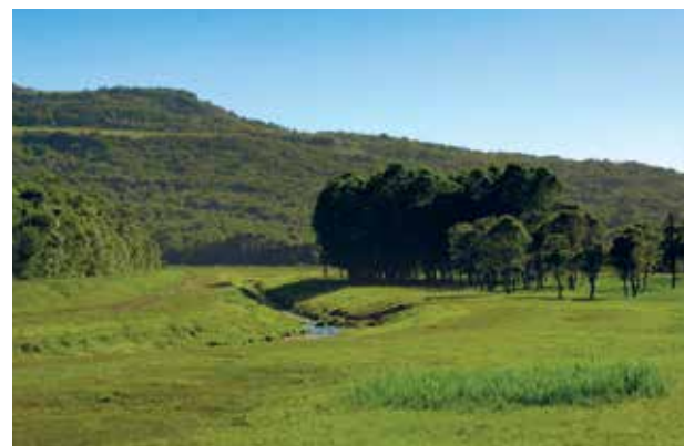
Bosco di Montona / Motovuner Wald

Steinadler ( Aquila chrysaetos ) niestet im Nordistrien (am Rand des Karstgebietes) und kann oft gesehen werden, wie er am Himmel von Nordistrien „kreuzt“. Nach der Flügelspannweite ist er der 4. größte Adler weltweit (185 – 220 cm), und einer der beweglichsten und schnellsten Flieger. Er ist Spitzenpredator und hat keine natürlichen Feinde.