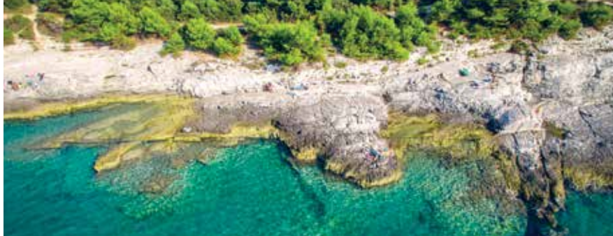
Autore / Autor: Danijel Bartolc - nunu production