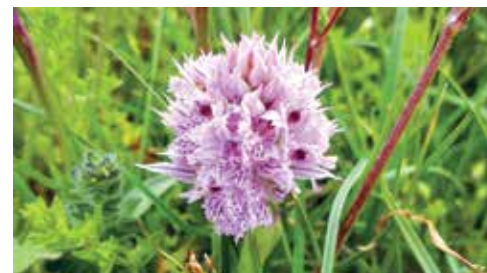
Orchidea screziata (Orchis tridentata) / Dreizähniiges Knabenkraut (Orchis tridentata)