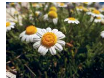
Camomilla pellegrina (Anthemis tomentosa) / Hundskamillen (Anthemis tomentosa)