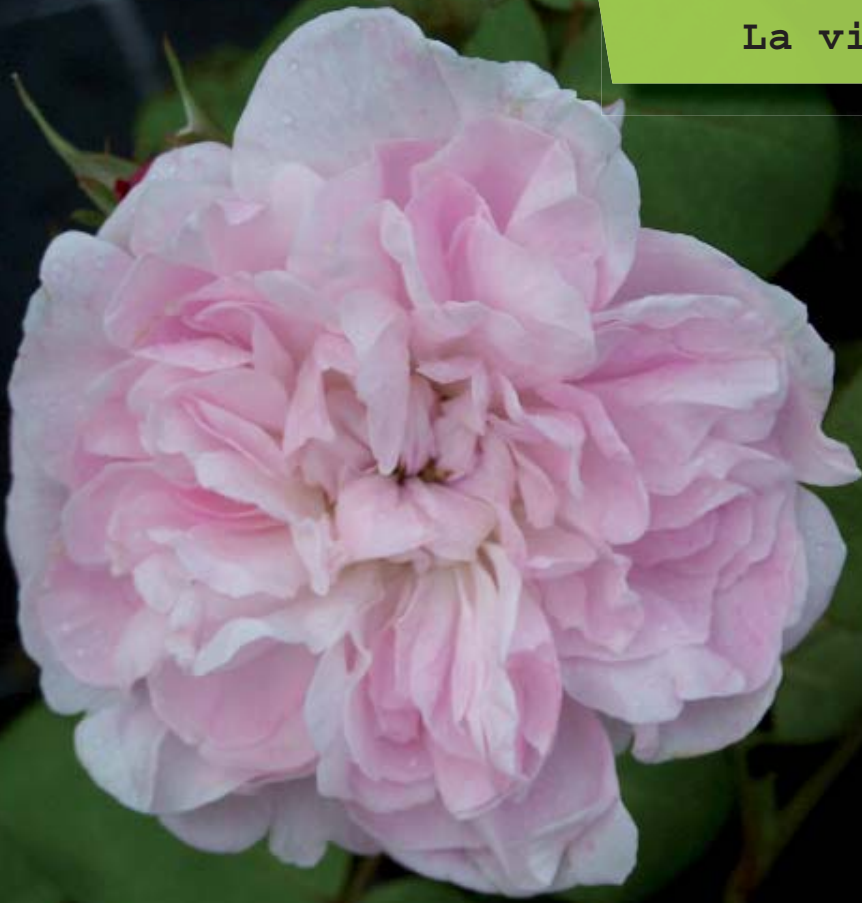
Rosa 'Fantin Latour'