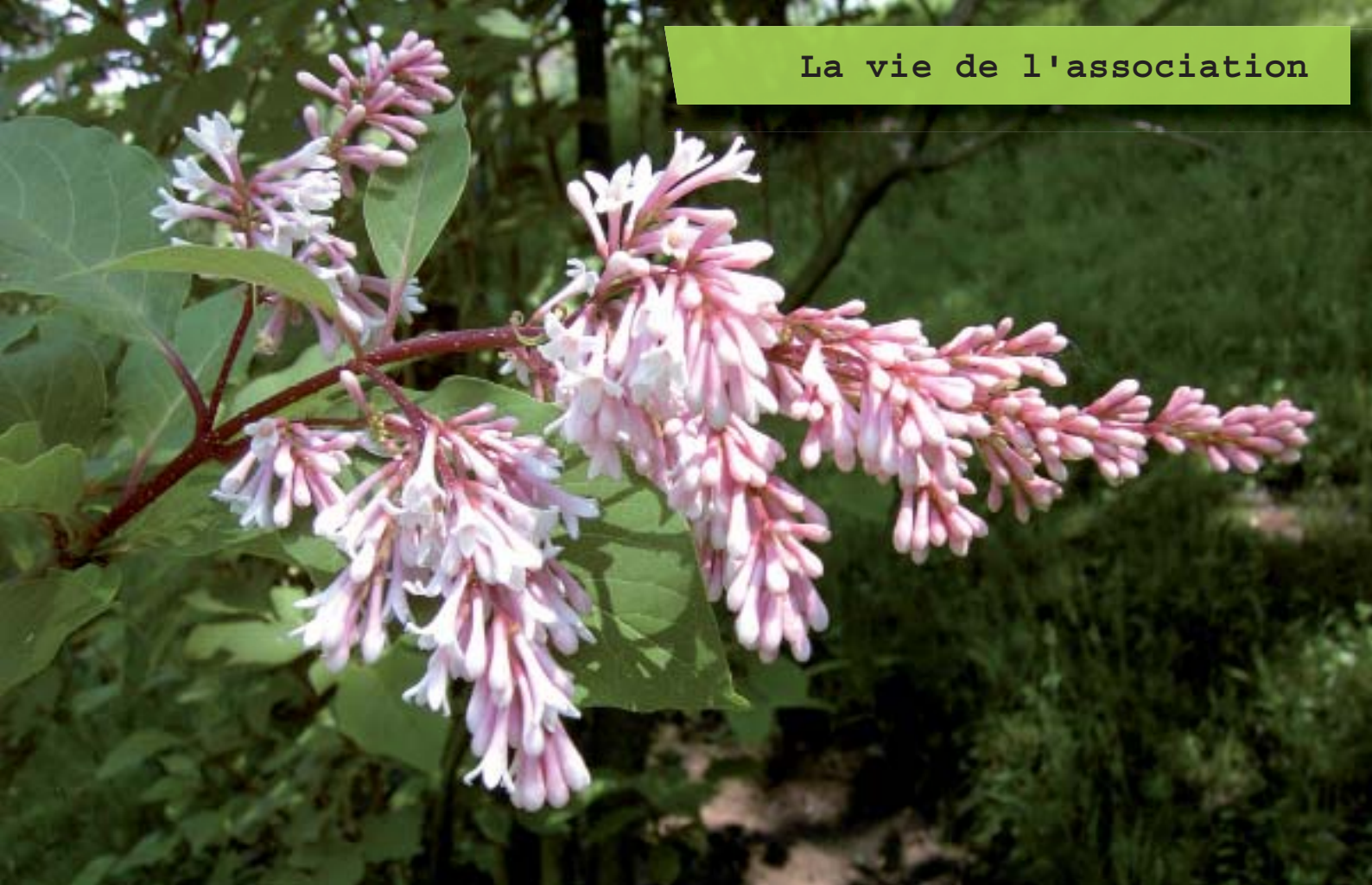
Syringa Yunnanensis 'Rosea'