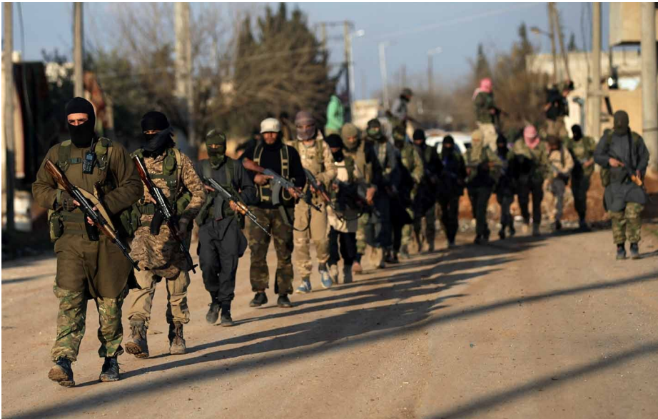
·Mendebaldeko herrialdeek babestutako "errebeldeak"

ez baitago Pastunena baino gizarte atzerakoiagorik, oraindik ere Afganistanen eta Pakistanen XVI. mendean legez bizi behar baitira. Baina sozialistak bide onetik zihoazenez, askatasunaren aldeko borrokariaren beharra zeukaten mendebaldeko herrialdeek, eta gero behin euren helburuak lortuta terroristak ziren. Orain ez dakite zer egin eurekin ezta nola erabili ere. Hala ere, nik ez dut pentsatzen Estatu Batuarrek Afganistanen porrot egin izan dutenik. Izan ere, betiko moduan euren interespean baliatuko dituzte horrelako taldeak eta gogoratu beharra dago, Taliban eta Daesh-aren arteko marra oso oso mehea dela eta ikusiko duzue zelan laster nahasten diren, Sirian gertatu zen bezala. Siriaren kasuan, siriarrak ejertzito askeko zenbatak bukatu zuten Al-Nusra eta Daesh-ean borrokan? Marrak oso finak dira, eta Afganistanek une honetan bere funtzioa beteko du, Estatu Batuarren interespean Iran eta Txinari arazoak sorraraziz, hauekiko duten gertutasuna dela eta.