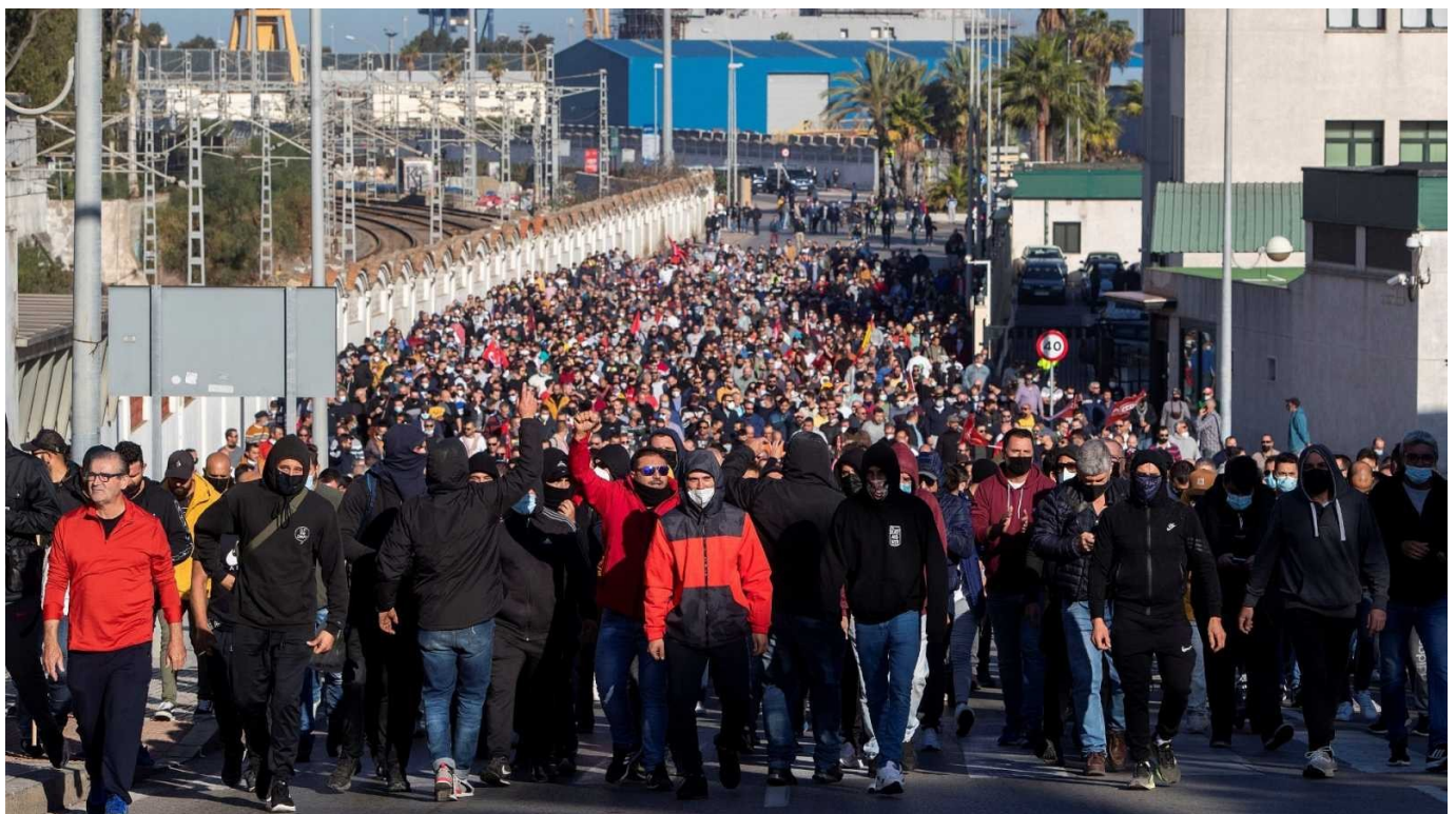
·2021eko Metaleko langileen greba, Cadiz

“Baina zapalketa baten aurrean konfrontazioa gustiz beharrezkoa da, ez dagoelako erdibideko au- kerarik etsaia deu- seztatzea ez denik.”