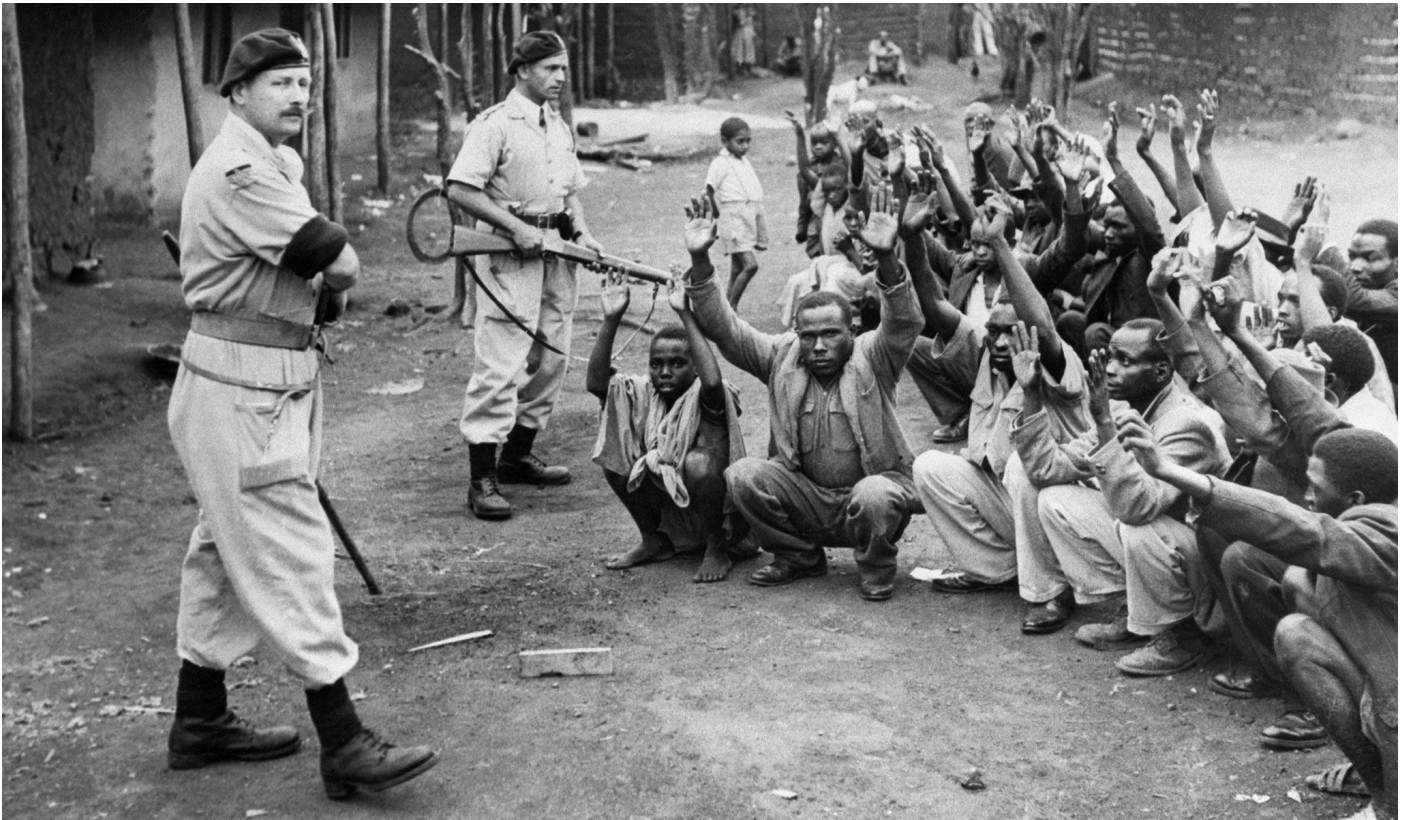
·1952-1960 bitartean iraun zuen "Mau Mau" matxinadan zehar keniatarrak gogor jazarri zituen Erresuma Batuak

E uskal Herriaren askatasunaren alde lerratzen garenon arteko eztabaida politikoetan, ugariak dira nazio auzia protagonista duten uneak eta hauetan, ohikoa da kolonialismoa edo kolonia bezalako terminoen agerpena. Baina zer da zehazki kolonia bat? Egokia al da Euskal Herria kolonia bat dela baieztatzea? Ikus dezagun.