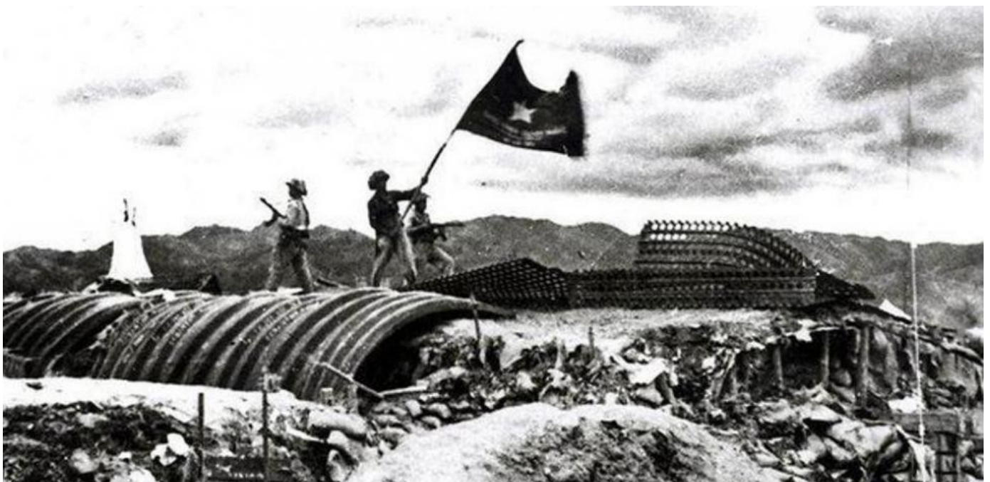
·1954ko maiatzaren 7an Viet Minh-eko soldaduak garaipena ospatzen Dien Bien Phun, Vietnam

Nazio auzia klase parametroetan ulertzeak, zapalkuntza forma honen errora jotzera garamatza halabeharrez. Euskal Herriak sufritzen duen zapalkuntza nazionalak espainiar eta frantziar burgesien interespean garatutako merkatu estatal homogeneoen eraketan du jatorria. Auzi nazionala, beraz, ekoizpen modu kapitalistaren baitan jaioa bada, zapalkuntza hori gaindi dezakeen bakarra aldi berean kapitalismoarekin bukatzeko potentzialtasuna daukan subjektu bakarra izango da, Euskal Herriko langileria, alegia. Askatasun nazionalaren alde, ekin diezaiogun bada Euskal Herri Langilearen antolakuntza indartzeari.