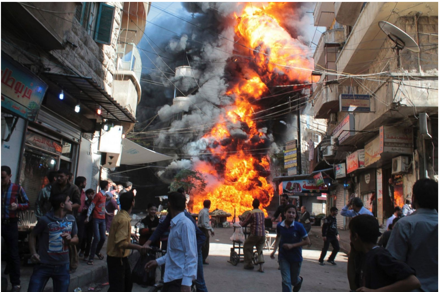
·2013ko urriak 20, Aleppo-ko Bustan Al-Qasr auzoko gasolindegri baten eztanda, Siria

Orduan, Souleimaniri esker ikusi zuten Israelen intentzioa Siriako estatua suntsitzea eta hainbat enkantetan edo eskualdetan zatitutako gunea bilakatzea zela, eta interes hauei aurre egitearren hasi zen Iranen laguntza.