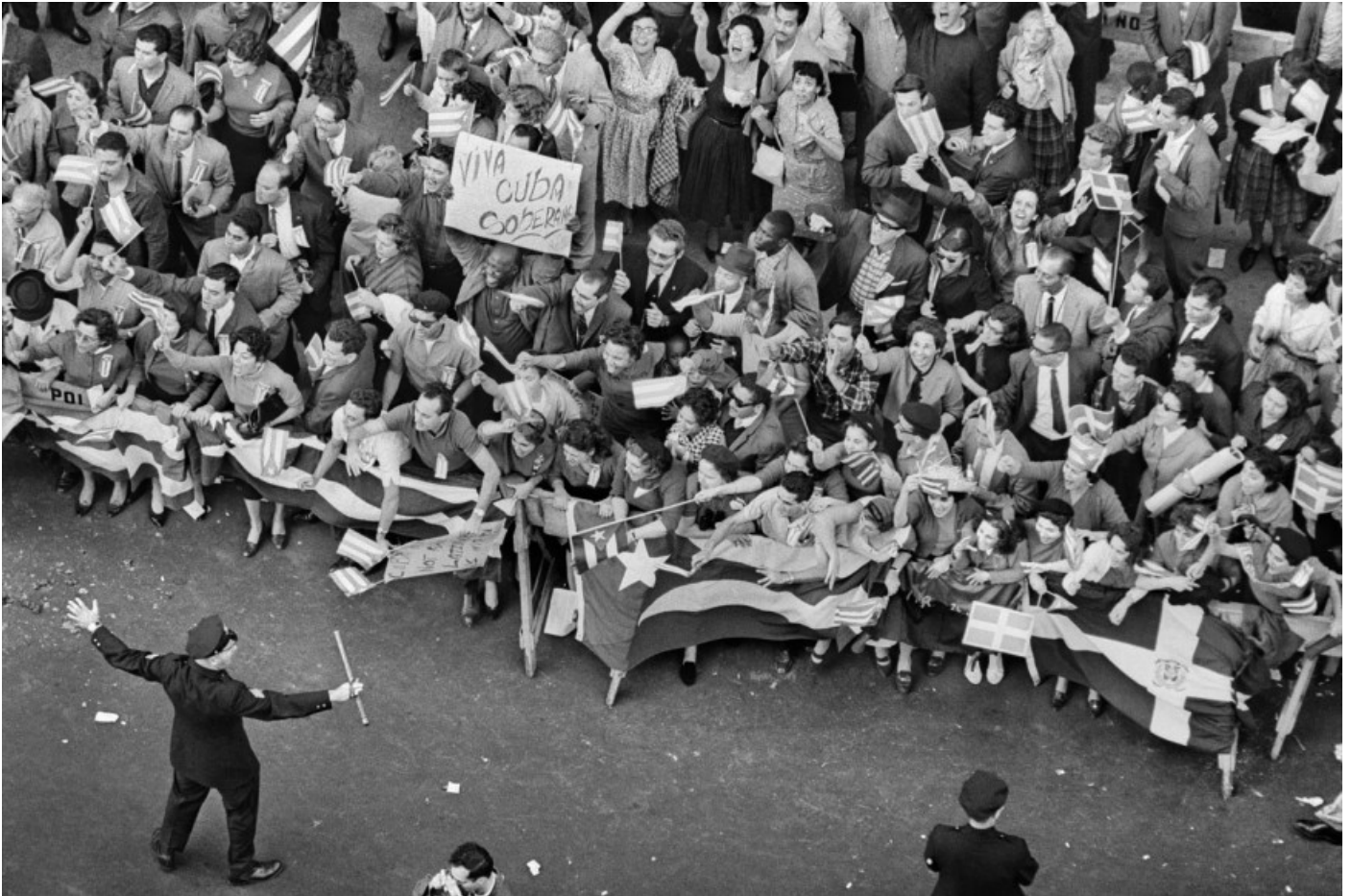
·1960ko irailaren 18an Fidel Castrori harrera egiteko jendetza, New York

I nternazionalismo proletarioa munduko langileen arteko elkartasun harremanen funtsezko oinarria da, zapalkuntza forma ororen gaindipenerako eta sozialismoa mundu mailan eraikitzea iparrorratz gisa jardun behar duena. Langileen interes komunetan oinarritutako batasun aktiboa gorpuztu behar du, klase dominatzailearen eta honek bultzatutako zapalkuntza eta esplotazio mekanismo guztien kontra bideratu behar dena.