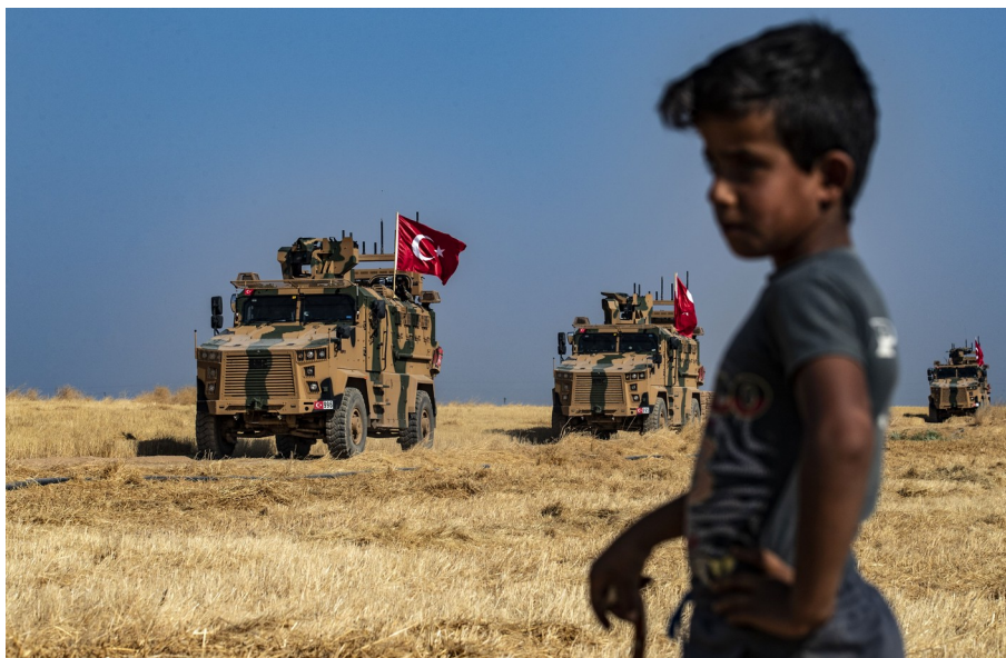
·2019 urriak 4, turkiar soldadua al-Hashisha herrixka inguruan, Siria

“etorkizunaz hitz egin ahal izateko, egonkortasuna halabeharrezko baldintza dela eta hazkunde ekonomikoa egon behar dela.”