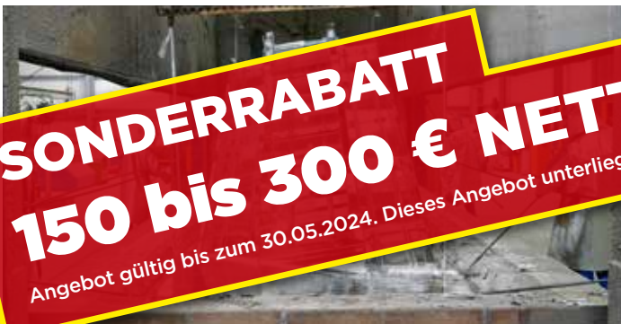
Die Expertise der Oberflächenbehandlungen (Verzinkung und Lackierung) zur Qualitätssicherung