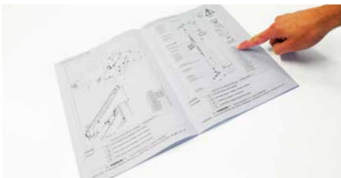
Die Kontrolle über Ersatzteile mit einem automatisch erstellten personalisierten Ersatzteilbuch mit der Fahrgestellnummer

SONDERRABATT 150 bis 300 € NETTO/Tonne Angebot gültig bis zum 30.05.2024. Dieses Angebot unterliegt unseren Geschäftsbedingungen.