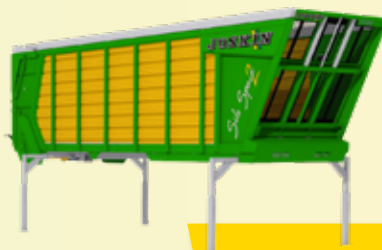
Silo-CARGO (2 Modelle)