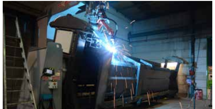
Die Expertise der automatischen Fertigung