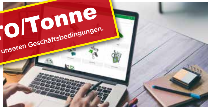
Die Expertise der Informatik für eine ständige und einfache Nachverfolgbarkeit mit unseren Händlern

SONDERRABATT 150 bis 300 € NETTO/Tonne Angebot gültig bis zum 30.05.2024. Dieses Angebot unterliegt unseren Geschäftsbedingungen.