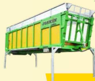
Drakkar-CARGO (4 Modelle)