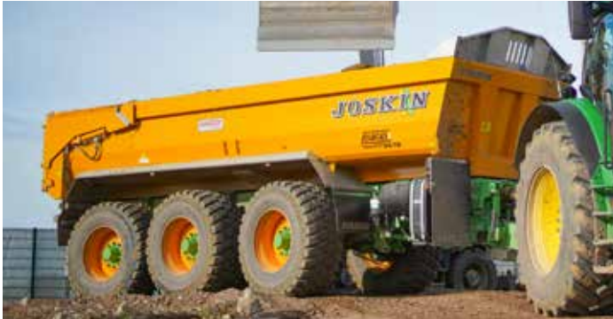
Die Expertise des landwirtschaftlichen und baugewerblichen Transports