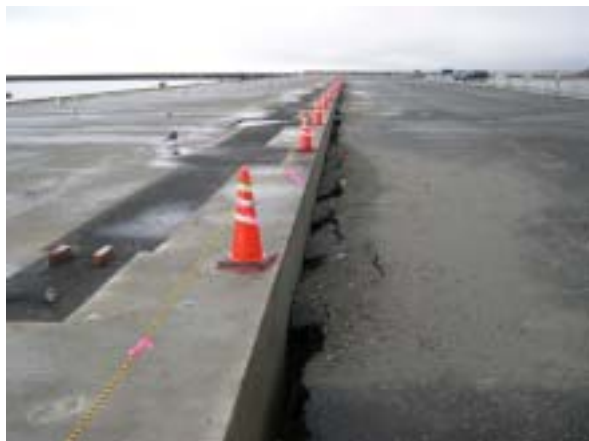
図-7 釧路港第4埠頭 段差発生

達した。当該箇所は広尾町寄りで日高累層群(粘板岩および砂岩)、襟裳岬寄りで花崗岩類が主体の地質であった。なお当該地区では、地震発生から3日後(9月29日)に連続雨量69mmの降雨にみまわれたため、本地震およびその後の降雨によってこのような斜面崩壊が誘発されたものと予想される。