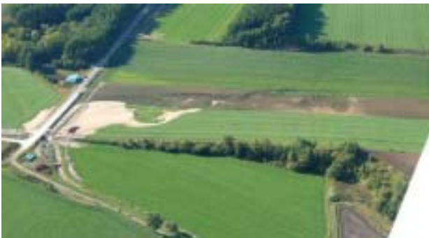
図-9 液状化による火山灰造成農地の大規模崩壊

図-9 に示した端野町協和の被災箇所(斜面傾斜 3°以下)では長さ約 190m, 幅 35～62m にわたって最大 3.4m 陥没した。液状化した火山灰は陥没域端部の複数の噴出口から約 10,000m 3 流出し、農地、道路、明渠に埋設しさらに小河川に流れ込んだ。この地点は丘陵地を刻む狭い谷底平野であり、水田として利用されていた谷底部を約 20 年前に周辺丘陵地から切土した火山灰を谷底部に盛土して畑地として造成した地盤である。なお、この地点付近では 1994 年の北海道東方沖地震でも液状化による地盤崩壊が確認されている。