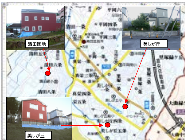
図-10 札幌市清田区の液状化と被災住宅