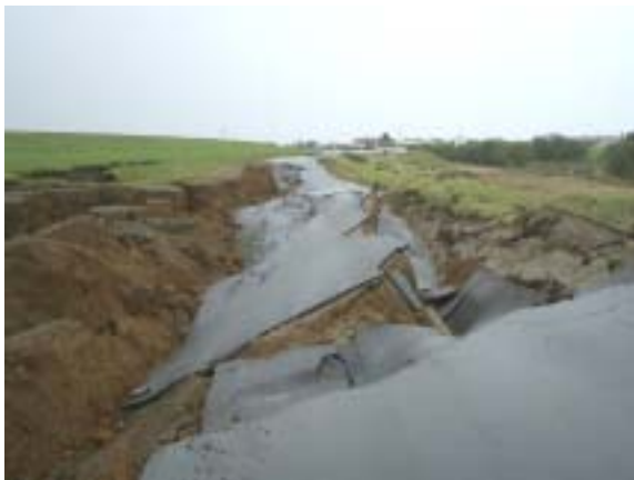
図-4 十勝川 盛土崩壊状況 大津築堤

河川堤防の関係では、石狩川水系清真布川の堤防(泥炭層上に構築)においても、天端の亀裂や沈下が発生している。