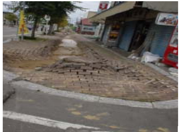
図-5 豊頃駅前歩道の液状化 歩道北側

他に橋梁構造物関係では、十勝河口橋(R336)や千代田大橋(R242)において、支承の破壊による橋桁の横ずれや橋脚の損傷、橋台盛土背面の沈下に起因する被害が生じた。