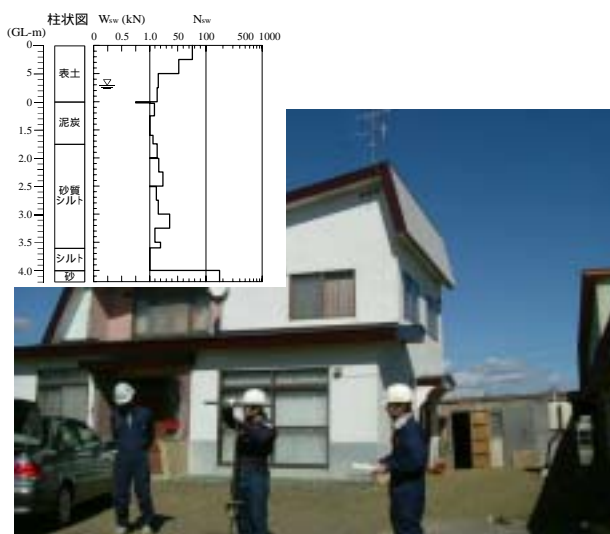
図-8 盛土上で不同沈下した家屋(豊頃町大津)

豊頃町大津では図-8に示した家屋が約1°奥の方向に不同沈下した。ここは湿地に低い盛土をして造成された所である。敷地内では噴砂も見られ、家の奥にある納屋内(盛土端に位置する)では写真に平行に地割れが発生していた。この宅地で行った図中に示すスウェーデン式サウンディング結果から、1mの厚さの盛土の下部に原地盤の泥炭層や軟弱なシルト層が堆積していた。地下水位はG.L.-0.7mと浅く、盛土の下部30cmほどは地下水位以下になっていた。従って、この飽和した部分が液状化して家屋の沈下や盛土端のすべりを発生させたものと考えられる。