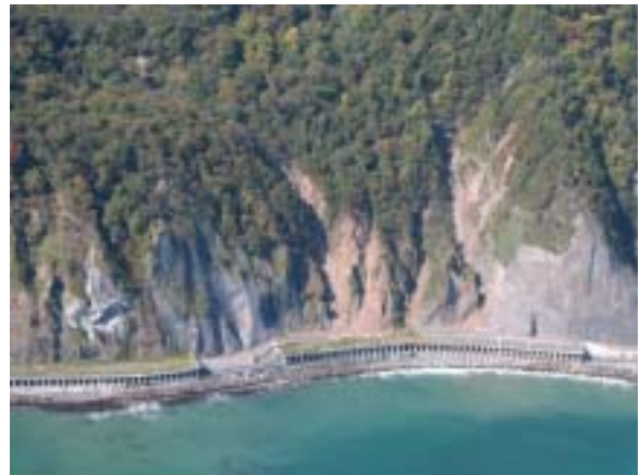
図-6 国道336号線 黄金道路斜面の土砂崩落