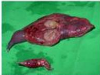
Fig. 1.2. Aspecto anatómico de resección en cuña pulmonar y muestra un fragmento que tiene un margen de seguridad, que permite hacer resección metastásica múltiple en posición periférica o subperiférica.

Resección en cuña de parénquima pulmonar que incluye la lesión metastásica y un margen de parénquima sano de seguridad. Se emplean autosuturadoras cortadores mecánicas de gran precisión y seguridad