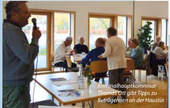
Kriminalhauptkommissar Thomas Ott gibt Tipps zu Betrügereien an der Haustür