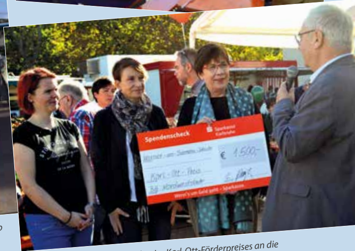
Übergabe des Karl-Ott-Förderpreises an die Werner-von-Siemens-Schule