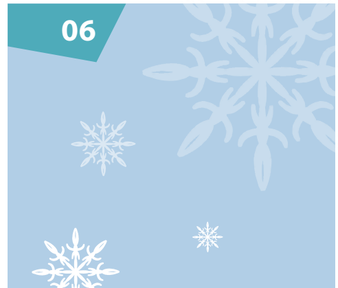
Da geh'n wir hin - Weihnachtliches in der Nordweststadt