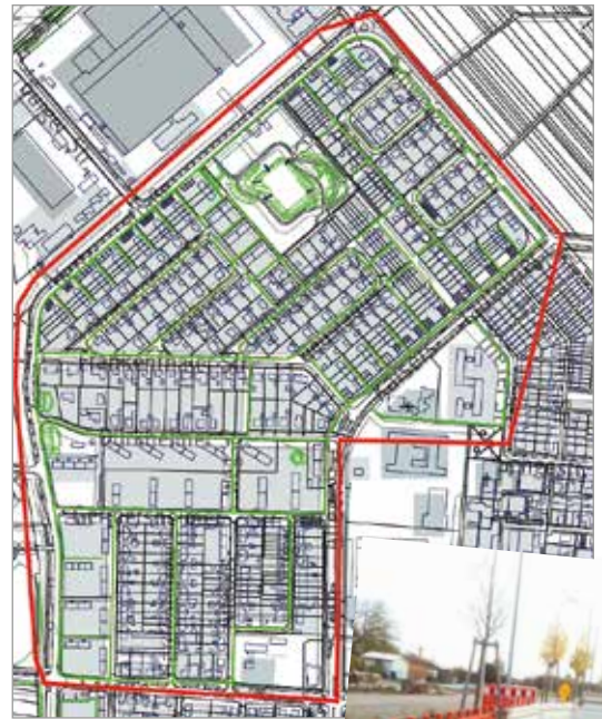
Oben: Karte der Baumaßnahme (rot: geplantes Baugelände / grün: geplante Erneuerung) Rechts: Bild von der Umrüstung auf LED-Beleuchtung

Die LED-Leuchten sind deutlich langlebiger und ermöglichen Energieeinsparungen von bis zu 70 Prozent gegenüber den alten Quecksilberdampfhochdrucklampen. In der Nordweststadt sind bereits in vielen Bereichen LED-Leuchten montiert. Im Rahmen der oben genannten Maßnahme wird nun auch ein Großteil der übrigen Bereiche mit LED-Leuchten ausgestattet sowie der Bestand erneuert und lichttechnisch optimiert.