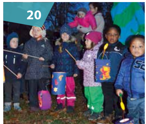
St. Martin