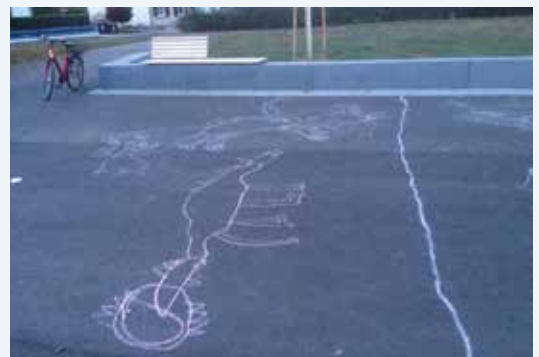
„Street-Art“ auf dem neuen Marktplatz (Foto BL)