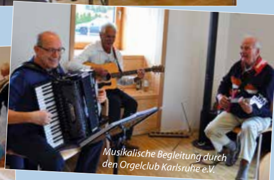
Musikalische Begleitung durch den Orgelclub Karlsruhe e.V.