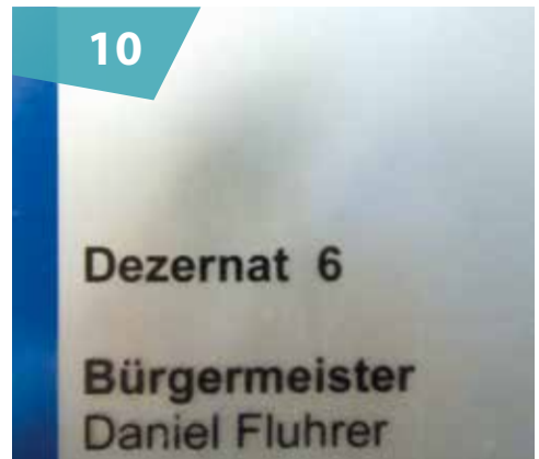
Wechsel im Baudezernat