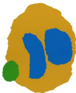
Baina Aita eta Ama Urdinek esan zuten: «Zu ez zara gure Urdin Txiki, berdea zara eta».