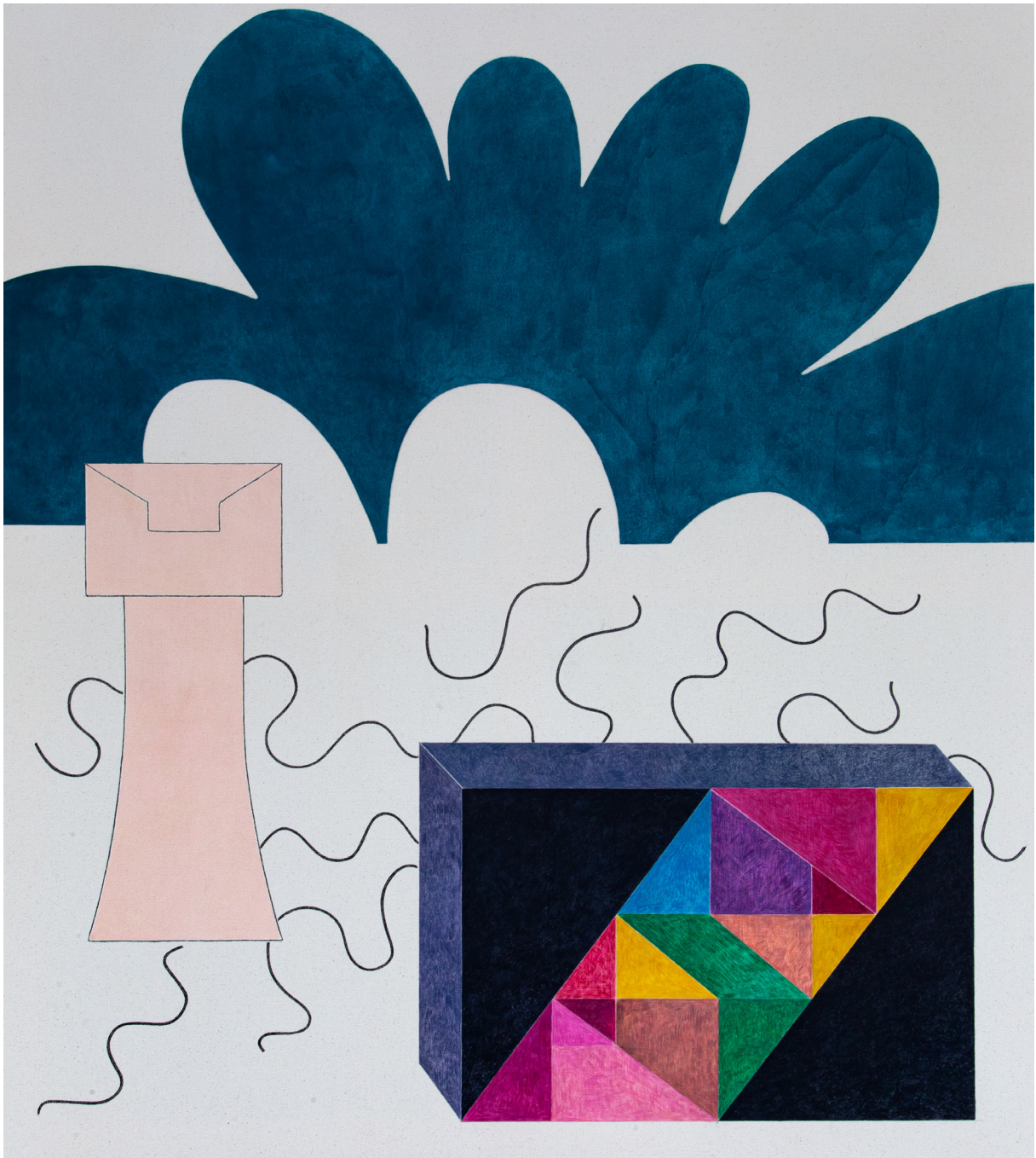
A Table of Content seglarduk/smärting, olja, akryl, flash 2020