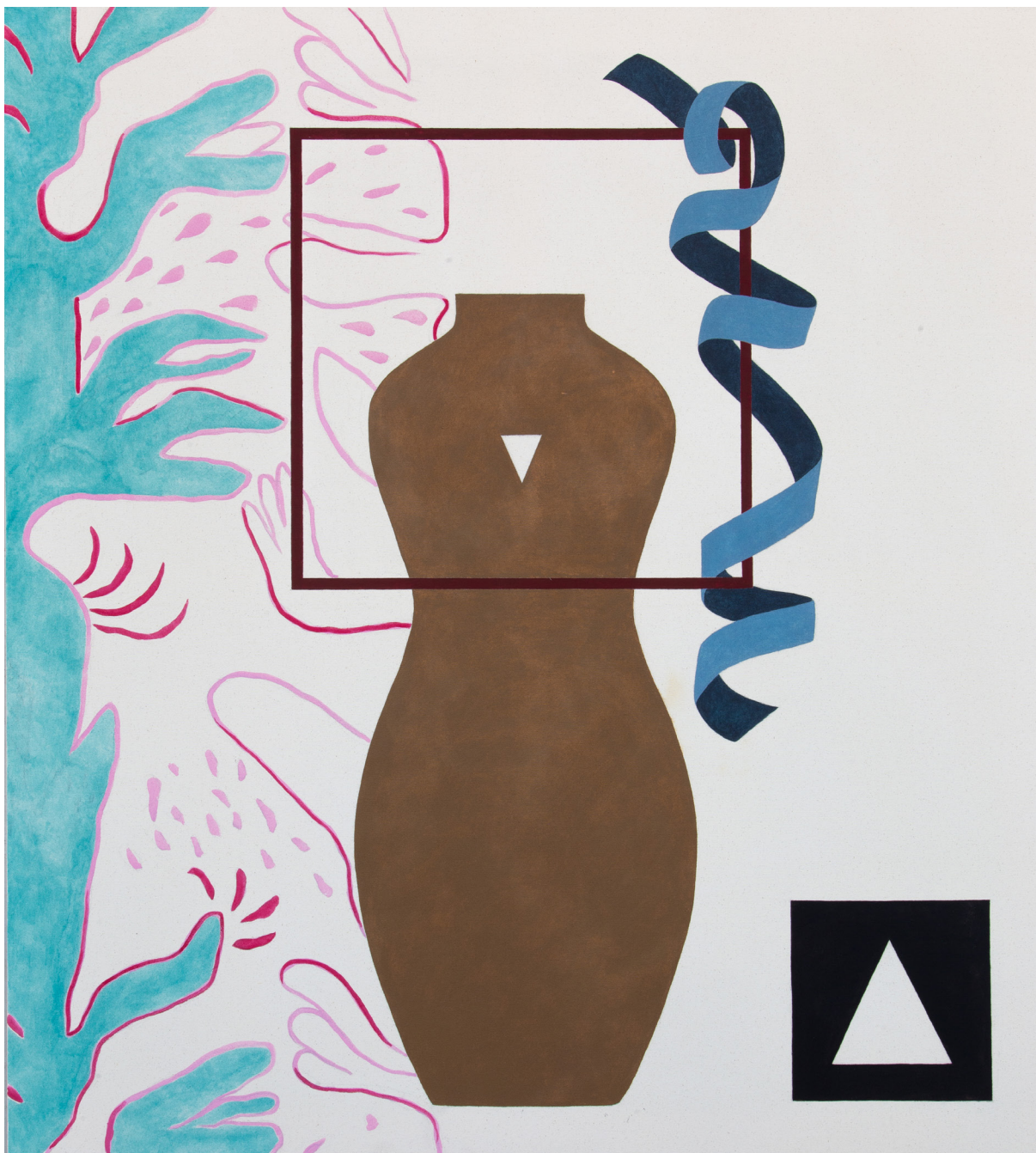
A Table of Content