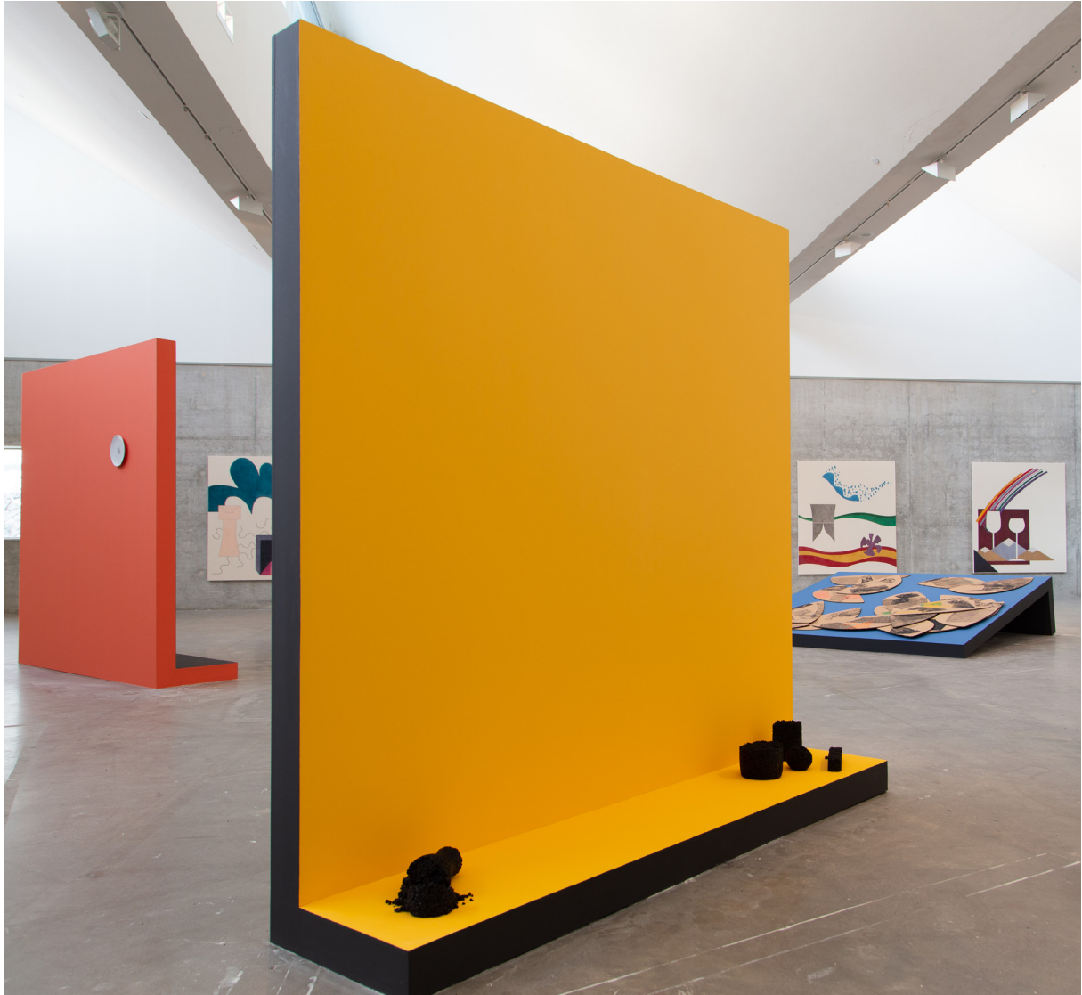
The Rock asfalt 2020

Industrialiseringen och massproduktionen av varor hade i mitten av 1800-talet skapat stora avfallsproblem. Produktionen av gas och koks bildade biprodukten tjära som dumpades i hålrum i jorden eller i vattendrag där den förorenade och tog död på allt liv. Ur stenkolstjäran framställdes 1856 det första syntetiska färgämnet, ett lilafärgat ämne som kallades mauvein. Efter hand utvanns även andra kulörer ut tjäran och de färgämnen som tidigare tagits fram ur naturmaterial ersattes nu av konstgjorda sådana. En produkt som förr ofta bestod av stenkolstjära är asfalt, som ända sedan 700-talet använts som vägbyggnadsmaterial. Substansen jordbeck och asfalt nämns också redan i Första Moseboken både som slukhål i Sodom och Gomorra och som byggmaterial i Babels torn. Verket The Rock består av en serie skugglika objekt i asfalt som visar på insidan av olika kärl.