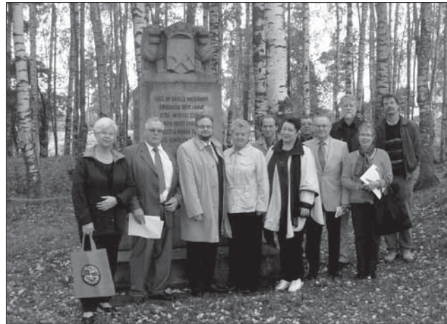
Sakkolan kirkkomaan muistolehdossa.

Menomatalla käväisimme Viipurin maakunta-arkistossa sukutietoja tutkimaan. Viipuri-keskuksen ystävällisellä avulla saimme tulkin mukaamme ja meille oli varattu aika kahdeksi tunniksi sukutietojen tutkimiseen.