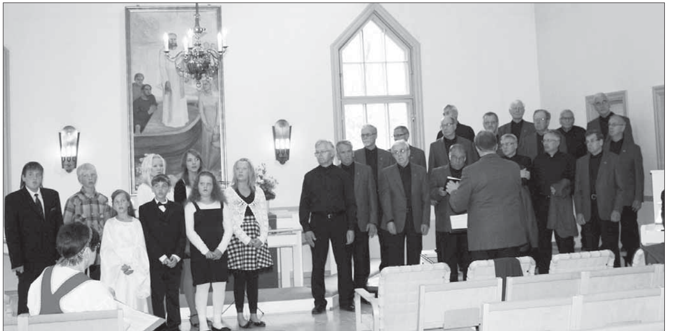
Luhalahden Nuorisönäyttis ja Pinsiön mieskuoro lauloivat yhdessä: "Kerrohan isä oi, onko pyöreä maa?"