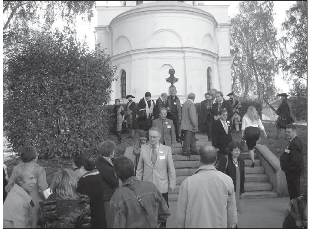
Pietari Suuren patsaalla käynti.