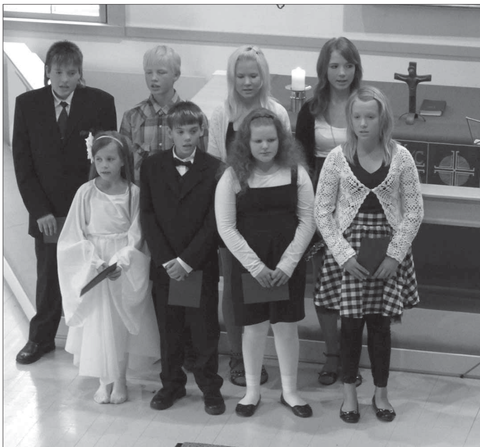
Luhalahden nuorisoryhmäläiset ilahduttivat raittiusseuran juhlaa esityksillään.