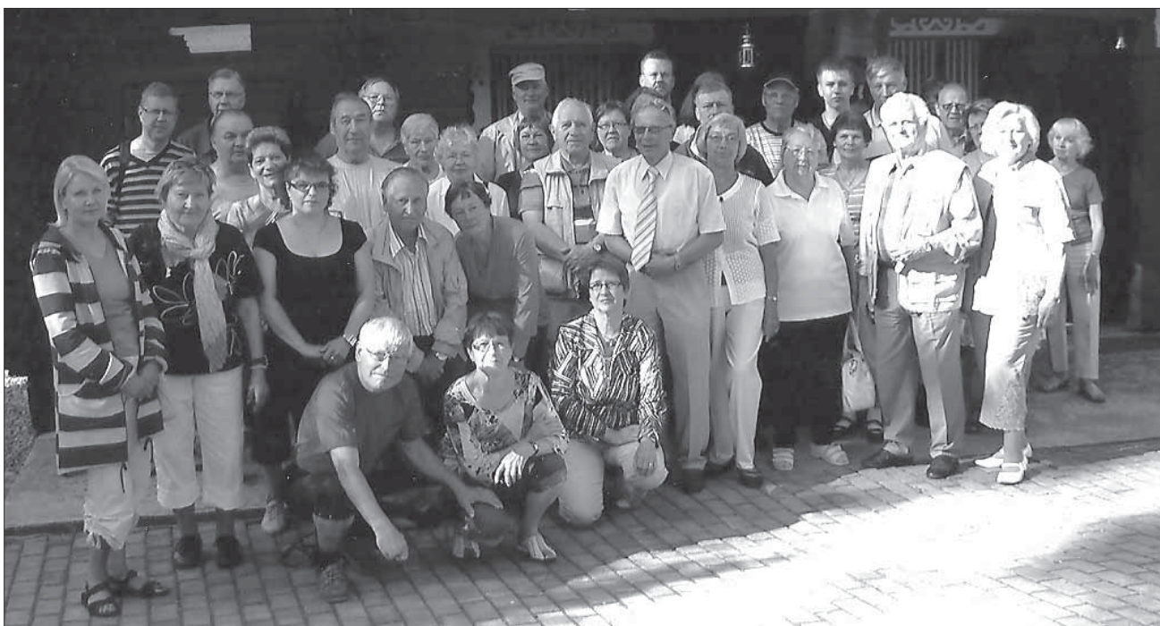
Matkalaisryhmämme Musakan Lomarannassa 30.6.2010.