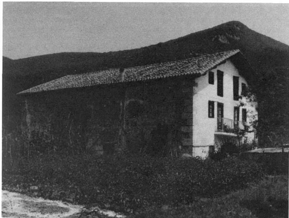
Sabin jaio zan baserria

Gure ikurrinpean olerkietan, erri eta etxe «austuta», «birrinduta» (208) ikusi ondoren baikortasuna estaldu eta olerkariaren garrasia entzuten da.