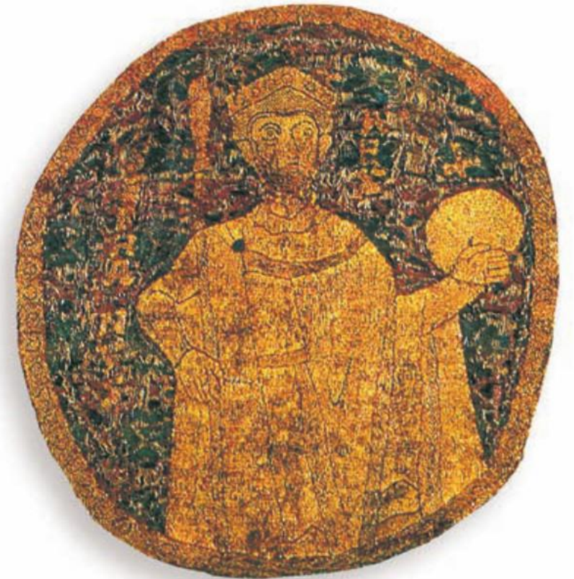
163.1. István ábrázolása a koronázási paláston. Figyeld meg a koronáját!